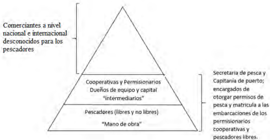
(Diagrama 2) 19

Por otra parte es que encontramos esta época como una etapa de cambios del autoconsumo de la pesca tradicional en la costa a un comercio que poco a poco se adentró en la red de comercio internacional, dicho trabajo de igual forma no se encuentra exento de las vicisitudes tanto sociales como ambientales, a medida que avancé en la investigación, me adentro en las situaciones cotidianas de los trabajadores, fuera y dentro del ámbito laboral, muchas de ellas provocadas por la dificultad ambiental de la pesca otras tantas por simple y llana desorganización institucional.