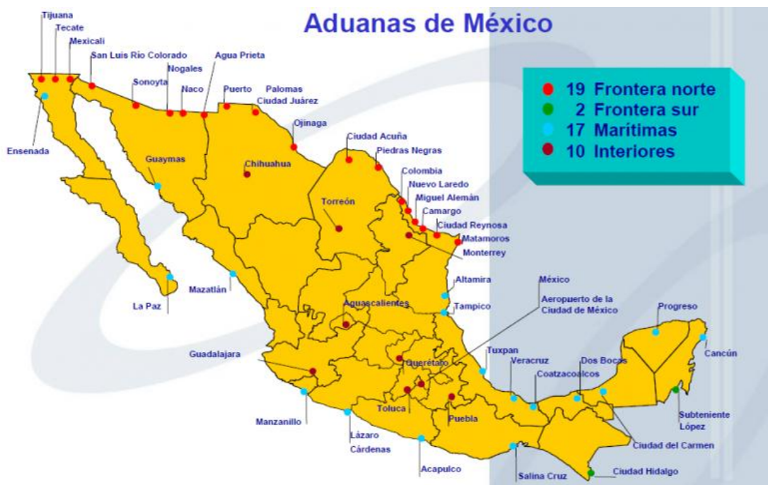
MAPA 1: DISTRIBUCIÓN GEOGRÁFICA DE LAS DIFERENTES ADUANAS.