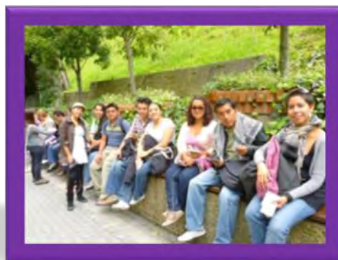
Estudiantes (MDE) Primera Generación

Generación 2010-2012 (Ver cuadro 1) de estancia en UPN Colombia, la cual está conformada por diez mujeres y nueve hombres en total son 19 los que participaron en esta primera generación a la UPN-Colombia, de ellos seis estudiantes corresponden a la línea de Diversidad Sociocultural y Lingüística, una a la Línea de Educación Artística, dos a la enseñanza de la ciencias Naturales, dos a Practicas Institucionales y Formación Docente, tres estudiantes a la línea de Política Educativa, tres estudiantes a la Historia y su Docencia, un estudiante a la Línea de Teoría e Intervención Pedagógica, y por último un estudiante de la línea de Hermenéutica y Educación Multicultural.