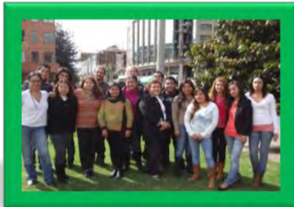
Estudiantes (MDE) Segunda Generación

De la segunda generación 2010-2012 (Ver cuadro dos), tenemos una participación de 18 estudiantes en la UPN Colombia, este dato es muy sobresaliente, porque se logra mantener la presencia en el número de estudiantes comparado a la generación pasada, y de los cuales corresponden a: cinco estudiantes de la línea Sociocultural y Lingüística, dos a la línea de Intervención Pedagógica, dos a Hermenéutica y Educación Multicultural, cinco estudiantes corresponden a la línea de Política educativa, dos de Enseñanza de las Ciencias Naturales, y dos de Educación Ambiental.