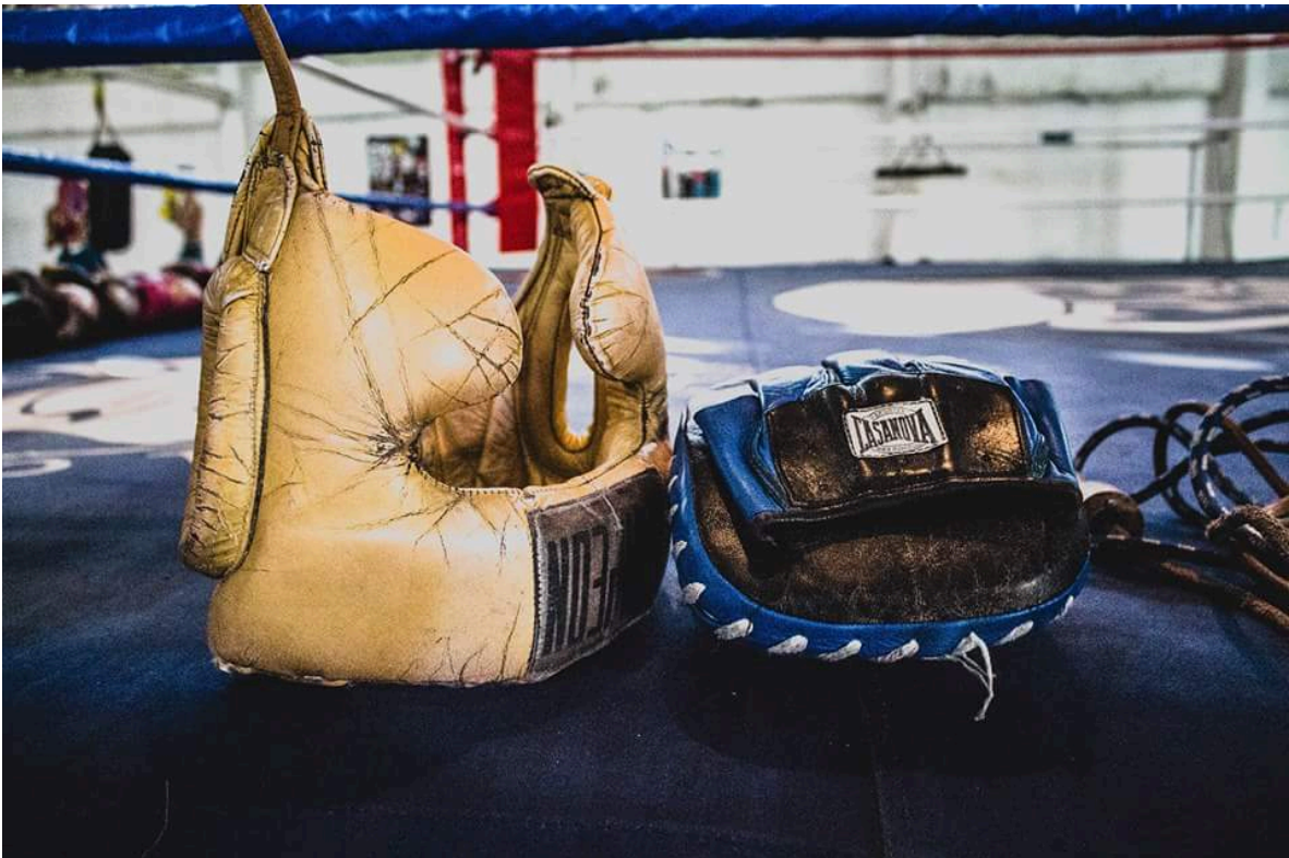
Caretas de préstamo del gimnasio.