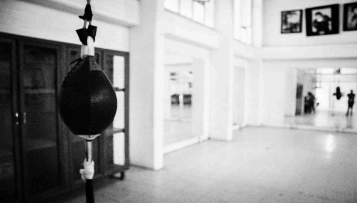
Peras para el uso de los pupilos.