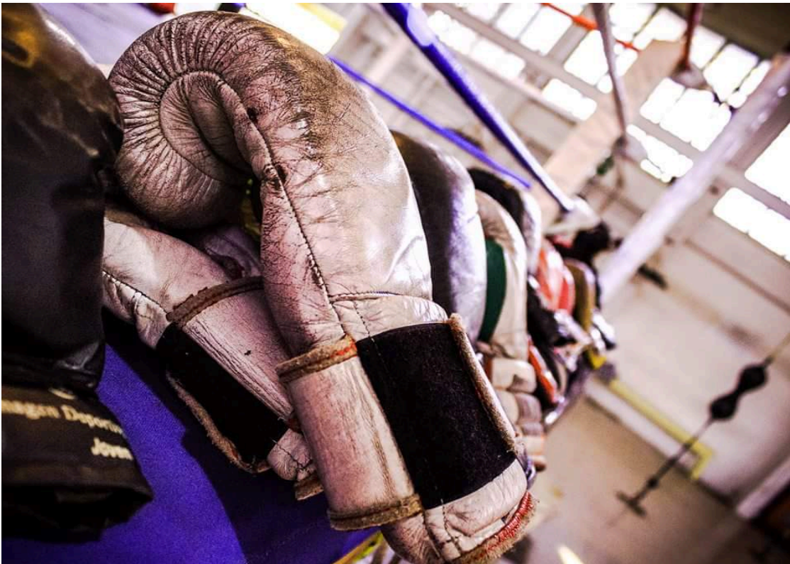
Guantes que ocupan todos los chicos.