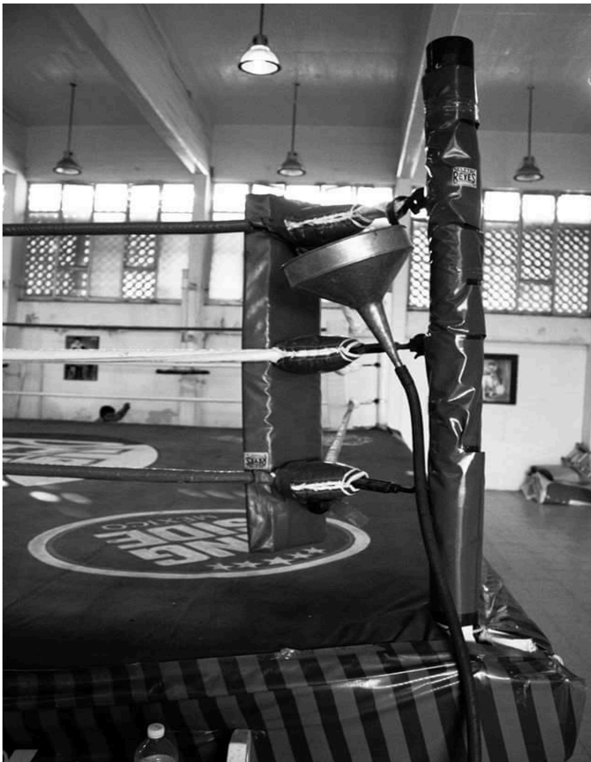
El ring del deportivo donado por la delegación Cuauhtémoc.