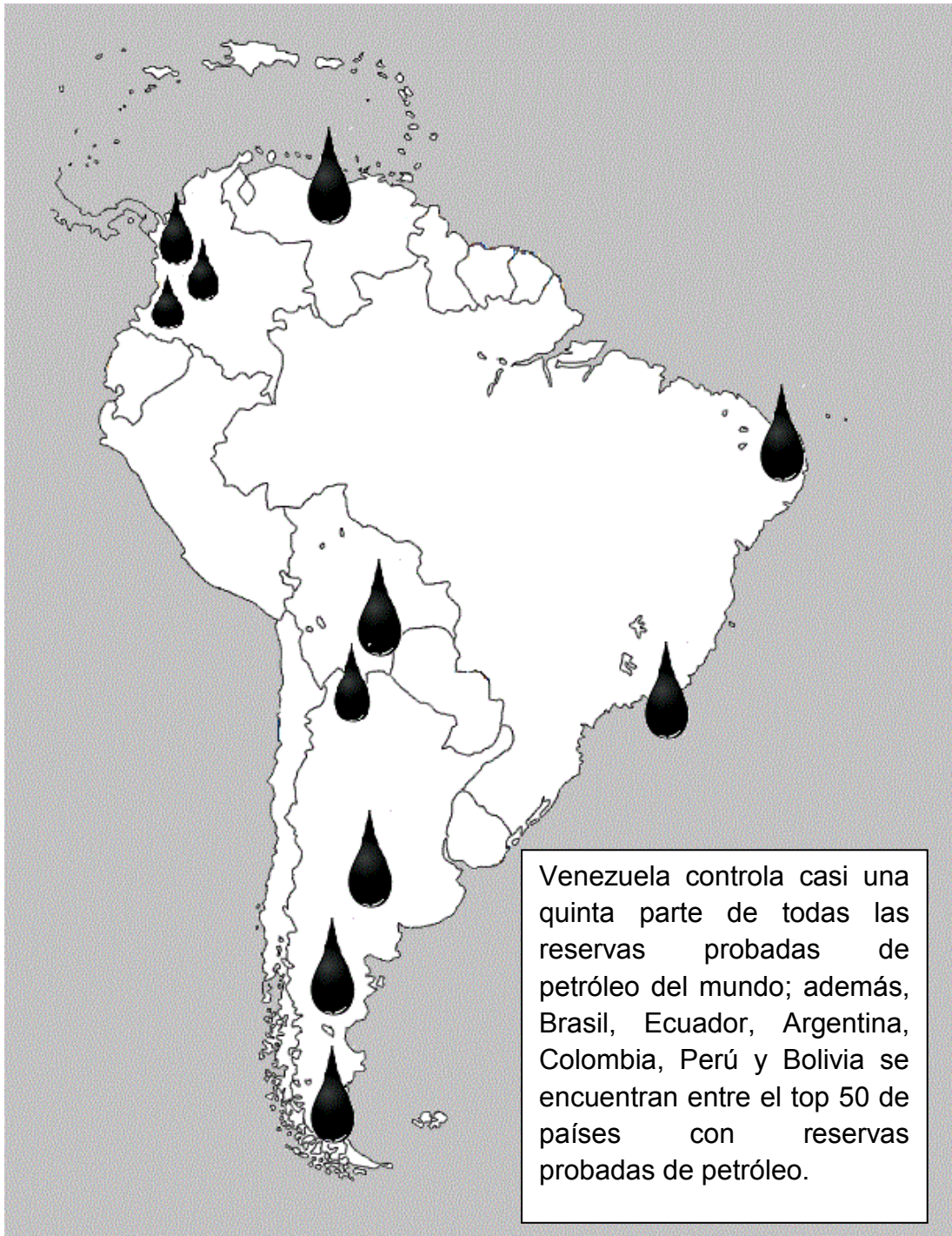
Mapa: Reservas de petróleo Fuente: Elaboración propia, Información: indexmundi.com