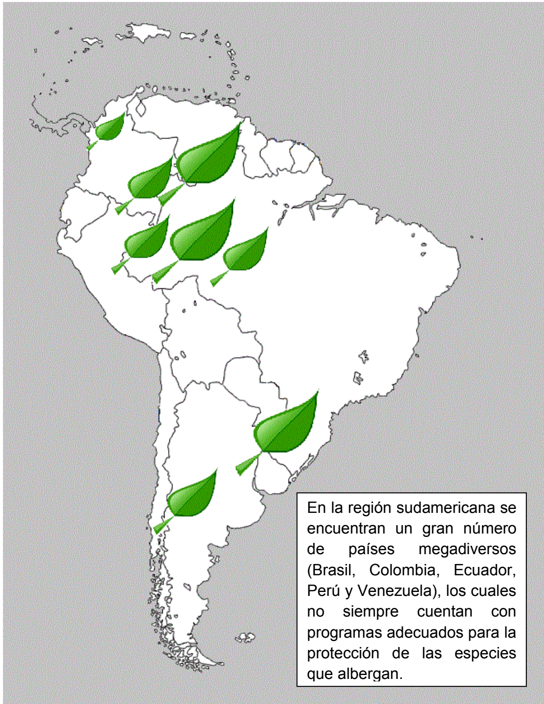
Mapa: Biodiversidad en Suramérica.

Fuente: Elaboración propia, Información: ionia1.esrin.esa.int/