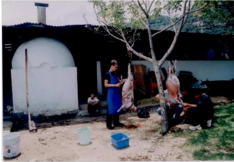
Joven haciendo el halal