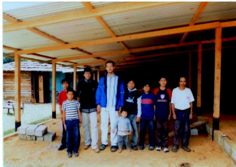
Indígenas, mestizos y españoles en la carpintería.