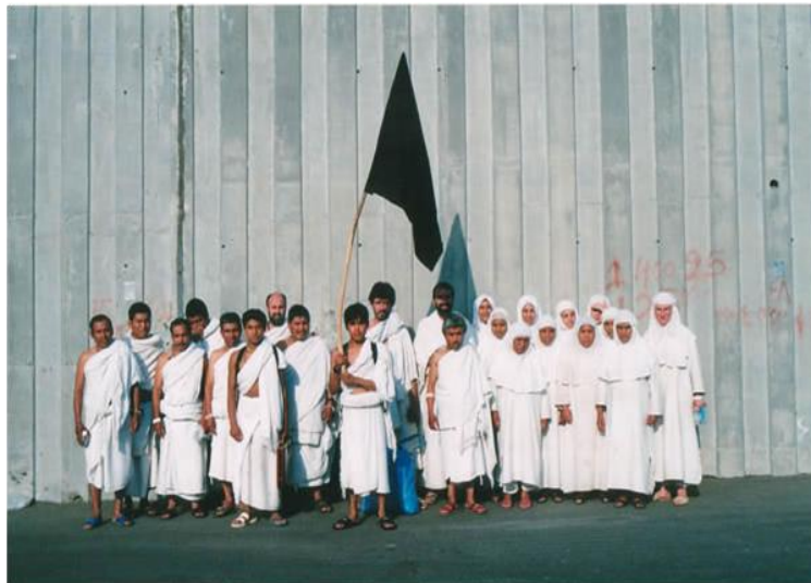
Hombres y mujeres de la cofradía en La Meca.