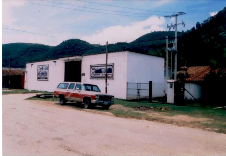
Exterior de la carpintería La Alpujarra.