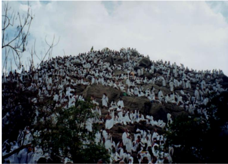
La Umma congregada en la realización del Hayy.