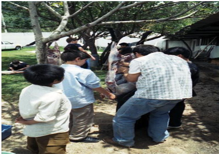
Todos participan en el sacrificio.