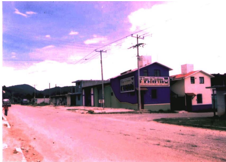
Frente del Hogar del Carpintero.