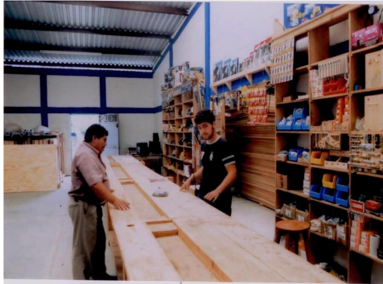
Joven musulmán atendiendo a un cliente en el Hogar del Carpintero.