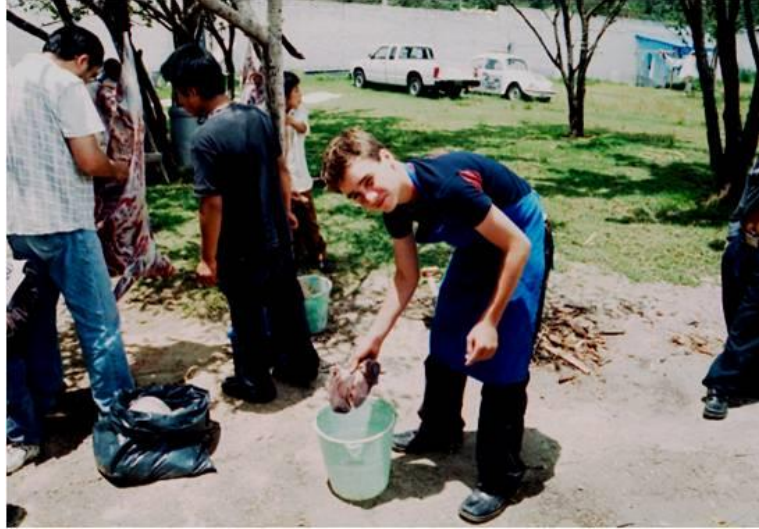
Separando las entrañas del carnero.