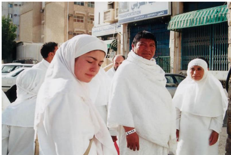
En las calles de La Meca.