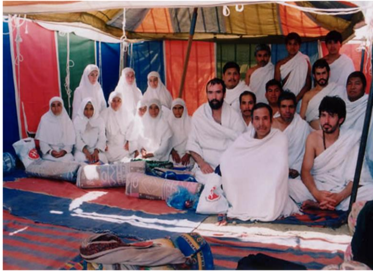
En una tienda a las afueras de La Meca.