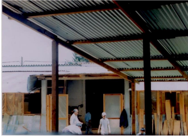
Jóvenes y adultos trabajando en la carpintería.