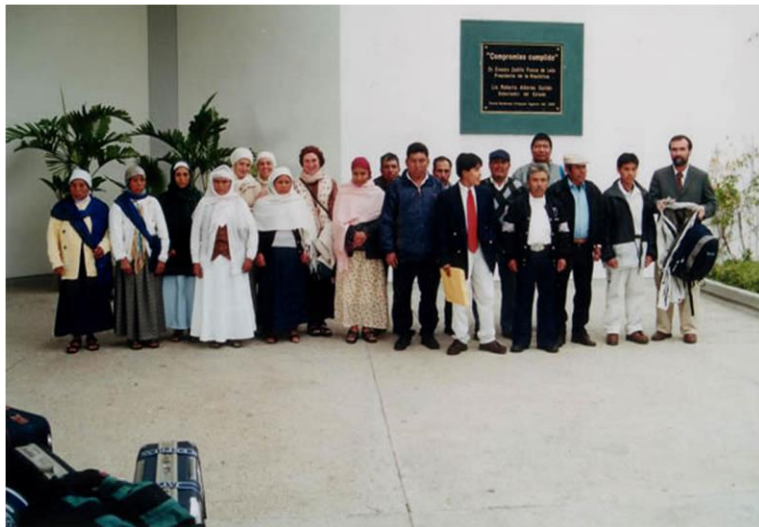
Hombres y mujeres seleccionados para hacer el primer Hayy.