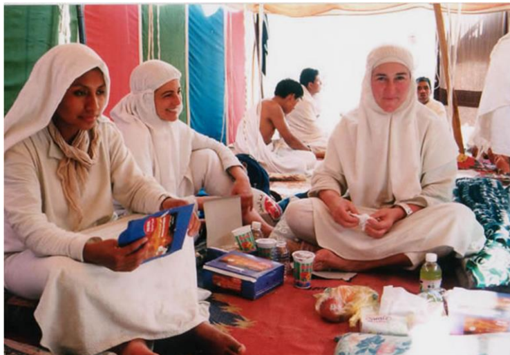
Mujeres compartiendo los alimentos durante el Hayy.