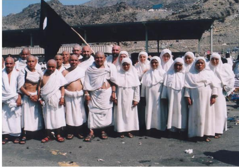
Cumpliendo un pilar.