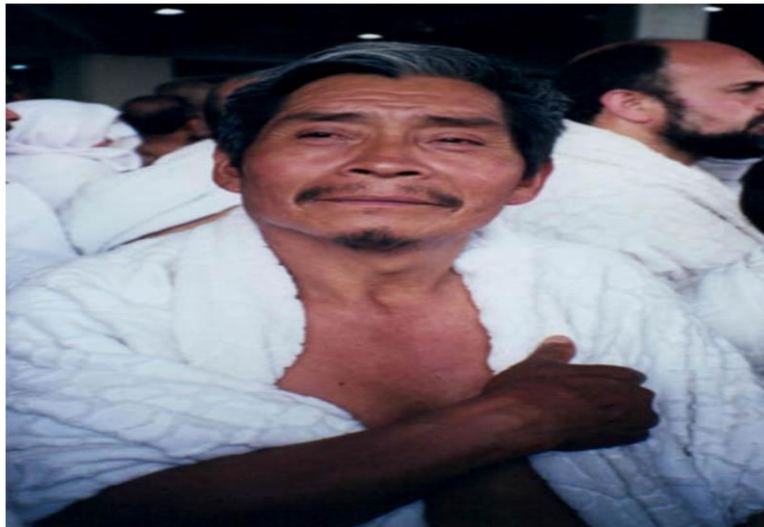
Visitando la casa de Allah.