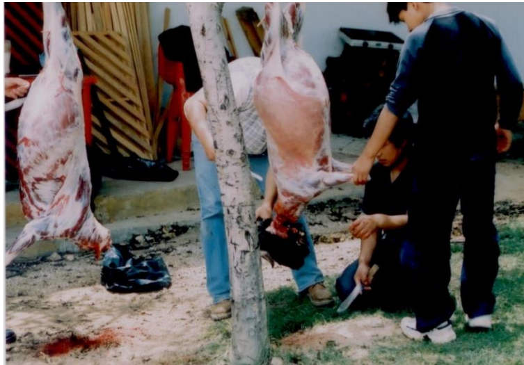
El desangramiento del cordero como parte del ritual del al Yumuah .