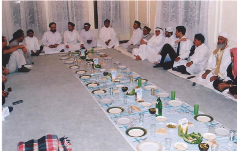
Musulmanes de la cofradía compartiendo alimentos con otros musulmanes durante el Hayy.