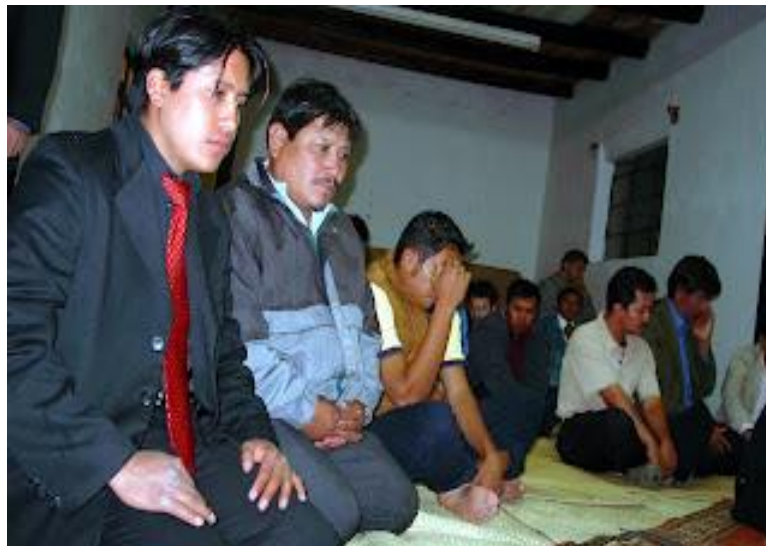
De Los Altos a La Meca