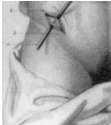
FIGURA 2. Primera colostomía. Duret 1793. (Tomada de Grosfeld JL. “ARM –a Historical Overview”. En Holschneider AM, Hutson JM, editors. Anorectal Malformations in Children. Embriology, diagnosis, surgical treatment, follow up. New York: Springer; 2006; 3-11.)

primera colostomía de sigmoides (colostomía inguinal o procedimiento de Littre) (FIGURA 2) fue realizada por Duret en 1793 (2) .