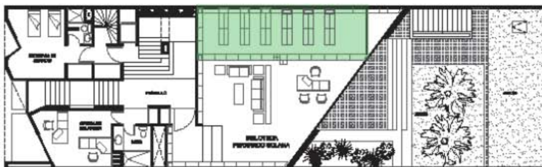
Clasificación planta sotano