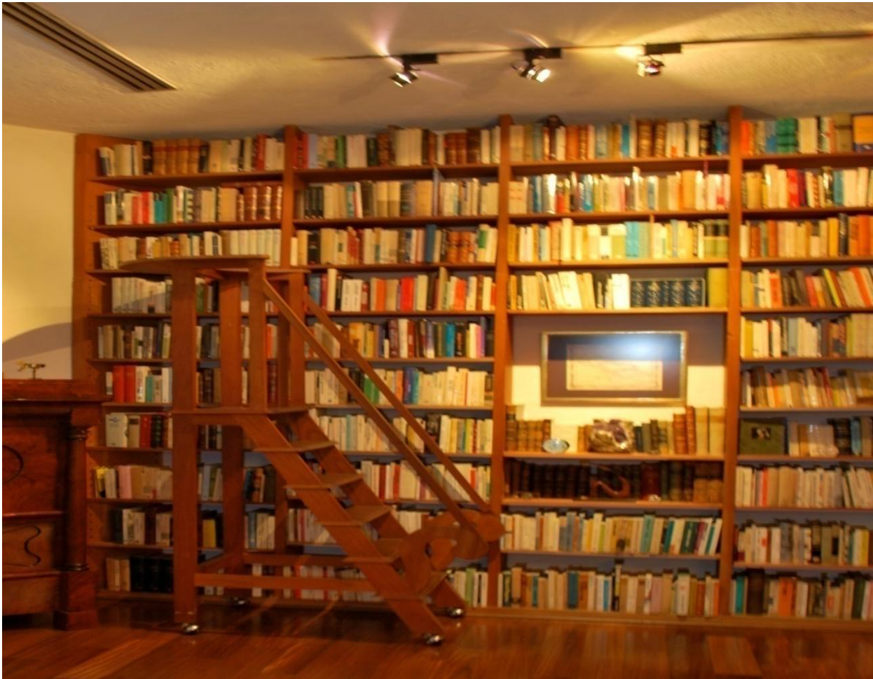
Imagen Arq. T. Adriana Palomino Orozco

Un flexo instalado en la pared ilumina parte de la estantería, resulta práctico incluso las lámparas de techo que cuelgan sobre la estantería.