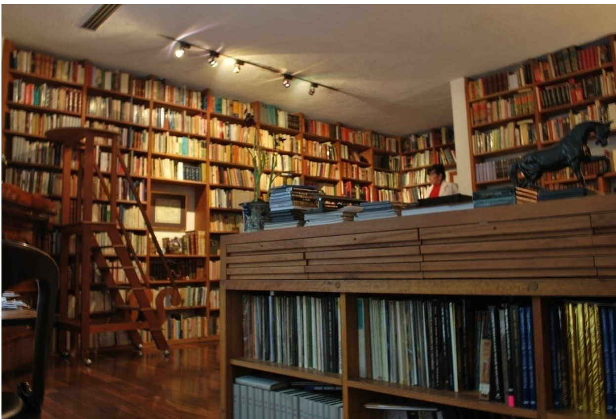
Imagen Arq. T. Adriana Palomino Orozco

Es importante no ocupar por completo el espacio de los entrepaños en los anaqueles, para facilitar la incorporación de nuevos volúmenes; pero también al no ocuparlas por completo, se corre el riesgo de que los libros se deformen, se doblen, o se caigan; para evitarlo, es preciso instalar sujeta libros, de los que existen diferentes modelos en el mercado.