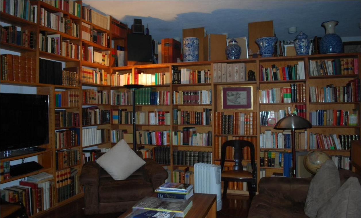
Imagen Arq. T. Adriana Palomino Orozco

La separación entre los entrepaños, y por lo tanto el número de entrepaños por anaquel, corresponderá a la altura de los materiales que allí se guarden, más 25 % de espacio para bascularlo con el fin de colocarlos o retirarlos.