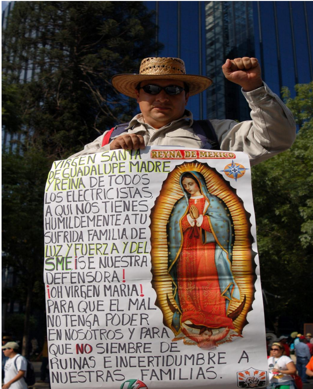
Electricista en una de las manifestaciones cercana al cierre, muestra un cartel con la virgen de Guadalupe, símbolo religioso de los mexicanos. Fecha de fotografía: 15 de Octubre 2009.