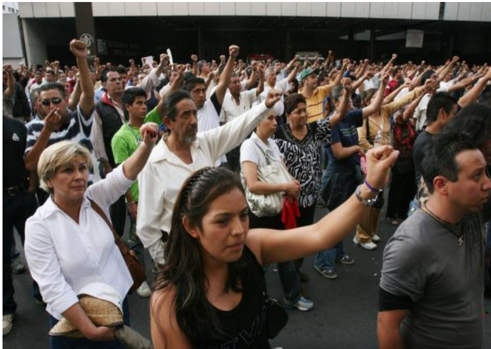
Ex trabajadores con familiares claman, por hacer valer sus voces al manifestarse, Foto; Info7, Véase en http://info7.com.mx/a/galeria/1105/secc/4

¡Seguimos vivos!, claman más de 16 mil electricistas tras varios meses de resistencia, las movilizaciones se llevaron a cabo a los alrededores de la ciudad de México, el más visitado por los ex trabajadores; el zócalo capitalino. La movilización que más llamó la atención de los medios de comunicación tras el cierre, ha sido la huelga de hambre de los electricistas.