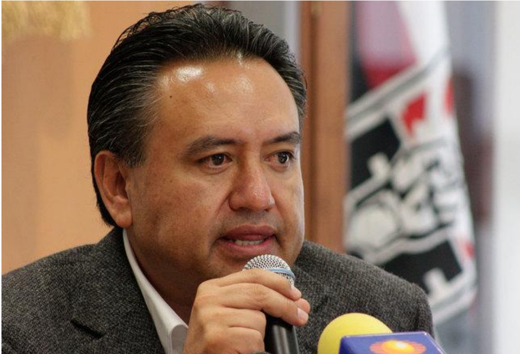
Martín Esparza, Líder del Sindicato Mexicano de Electricistas (SME), Véase en http://guerrerosme.blogspot.mx/2013/05/esta-en-manos-de-la-segob-lasolucion.html