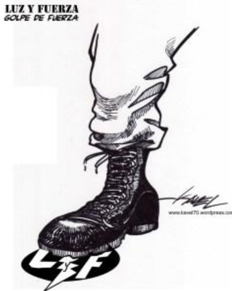
Caricatura: La Jornada , Octubre 2009