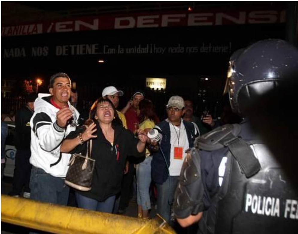
Elementos de la Policía Federal y del Ejército Mexicano ocuparon anoche las instalaciones de la empresa Luz y Fuerza del Centro (Foto: Alfredo Domínguez) La Jornada.

Un artículo de opinión hecho por el periodista Ciro Gómez Leyva, en el periódico Milenio , aseguró, que, 600 encuestas realizadas por el Gabinete de Comunicación Estratégica en zonas donde operaba Luz y Fuerza del Centro. El 80% de los encuestados estaban a favor de que el gobierno pusiera orden en esta empresa. El 42.5% estaba a favor de cómo intervino la fuerza policiaca. El 48% estaba de acuerdo de que Comisión Federal de Electricidad, operara en zonas de LyFC.