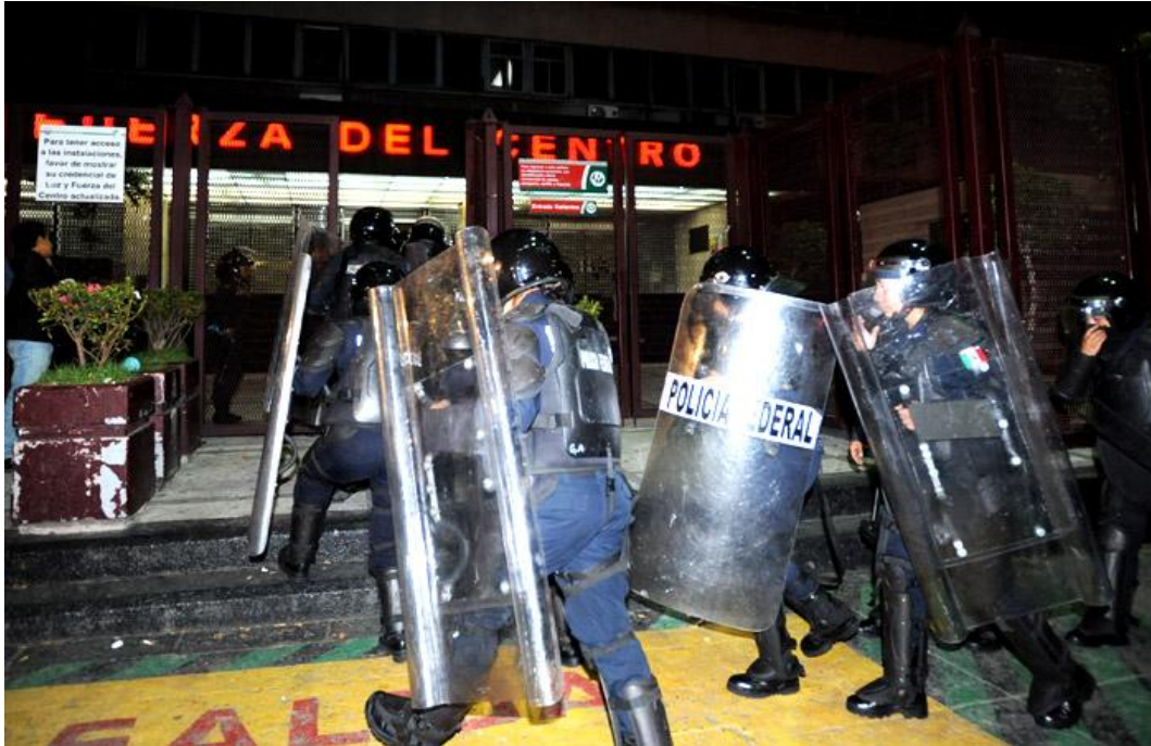
La Policía Federal tomó las instalaciones de LyFC, sin que se hayan reportado enfrentamientos, (Foto: Animal Político) Veasé en http://www.animalpolitico.com/2011/10/sme-a-dos-anos-de-la-extincion-de-luz-y-fuerza-del-centro/#axzz2rikVnHnj