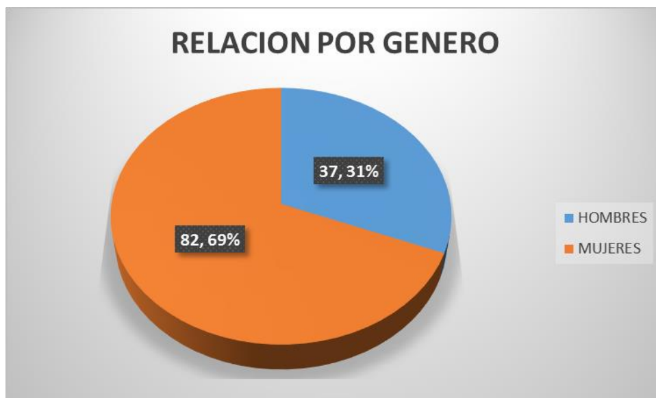
Gráfica 1. Distribución de género en pacientes adultos mayores con fractura de cadera y polifarmacia

Del total de 120 pacientes estudiados, 37 son del género masculino que corresponden al 31.66% y 82 al género femenino que son el 68.33%, como se muestra en la gráfica 1. La media de edad de los pacientes estudiados por fractura de cadera fue de 79 años con una desviación estándar de 8.05, con una edad mínima de 60 años y una máxima de 96 años.