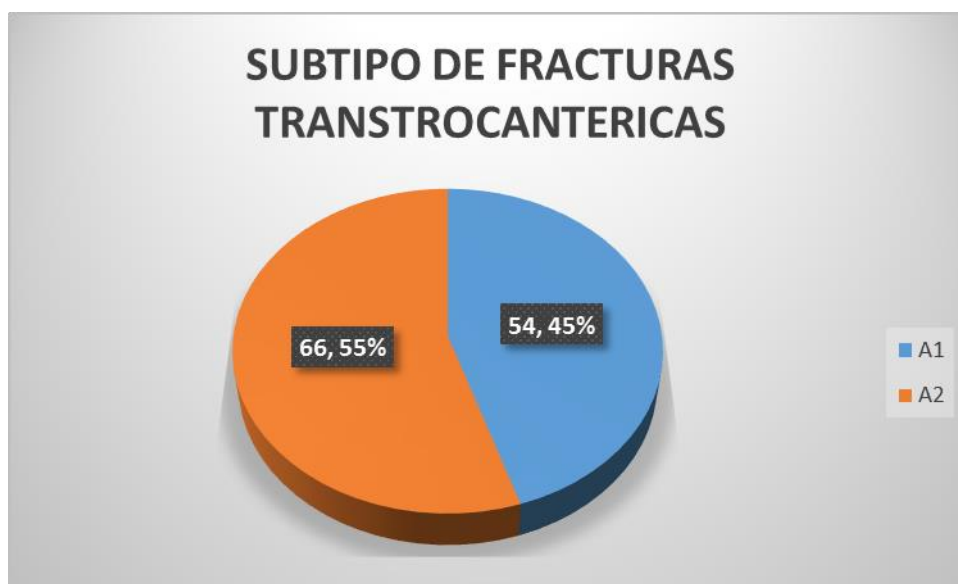
Grafica 2. Subtipo de fractura transtrocanterica más frecuente en adultos mayores con polifarmacia

De los 120 paciente se encontró que del subtipo de fracturas transtrocantericas se presentaron A1 un total de 54 correspondiendo un 45%, así como A2 66 correspondiendo 55% como se muestra grafica 2, todos tratados quirúrgicamente mediante DHS, se encontró como tiempo de espera para ser operado fue de 6 días a partir de su ingreso a al área de urgencias, siendo el promedio de estancia intrahospitalaria 8 dias desde su ingreso a la área de urgencias.