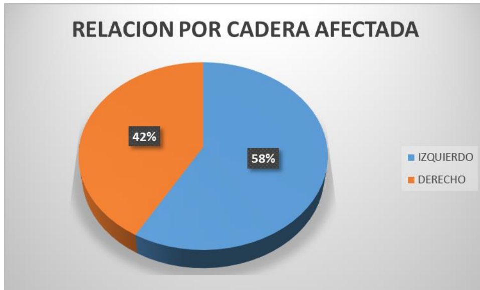
Grafica 3. Se muestra la relacion entre cadera afectada

Se encontró además que el lado más afectado fue el lado izquierdo 70 con un porcentaje de 58.33% y lado derecho con un total de 50 correspondiendo un 41.66%, como se muestra en grafica 3, los cuales como previamente se comentó fueron tratados con DHS en todos los eventos por el tipo de fractura.