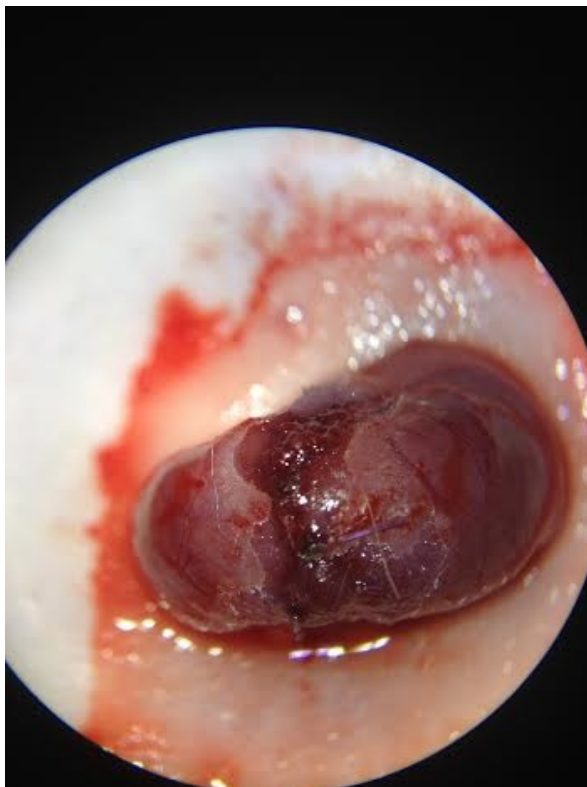
Imagen 3. Anastomosis reforzada de intestino delgado con cianocrilato exteriorizada.

En el día 12 de postoperatorio las ratas fueron sacrificadas y laparotomizadas, aquellas que murieron antes también fueron laparotomizadas para evaluar la integridad de la anastomosis. Al abordar la cavidad abdominal se evaluaron las adherencias peritoneales; para esto se utilizó una escala previamente utilizada en un protocolo de investigación semejante (P). Se le dio un valor numérico dependiendo del grado de adherencias: “0”, no adherencias; “1”, mínimas adherencias, principalmente entre la anastomosis y el epiplón; “2”, moderadas adherencias, esto es, entre la anastomosis y el epiplón y entre la anastomosis y otra asa de intestino delgado; “3”, adherencias severas y extensas, incluyendo formación de absceso.