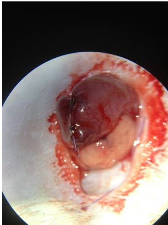
Imagen 2. Anastomosis simple de intestino delgado exteriorizada.

En el grupo de anastomosis simple [AS] se realizó una anastomosis termino-terminal con 6 puntos individuales de poliglecaprone 5-0 distribuidos de forma equitativa. En el grupo de anastomosis reforzada con cianocrilato [AR] la anastomosis fue término-terminal con solo 4 puntos individuales de poliglecaprone 5-0; la anastomosis se reforzó y selló con Histoacryl (N-butyl-2 Cianoacrilato). El asa de intestino se regreso a la cavidad y se cerró la aponeurosis con polipropileno 5-0 surgete continuo; la piel se cerró con puntos simples de poliglactina 3-0. Se administró tramadol como analgésico durante los primeros 3 días postoperatorios y en ningún momento se utilizó antibiótico. Los animales se mantuvieron en una dieta a base de alimento especial para rata y agua a libre demanda, desde las primeras 12 horas del postoperatorio y hasta 12 días después.