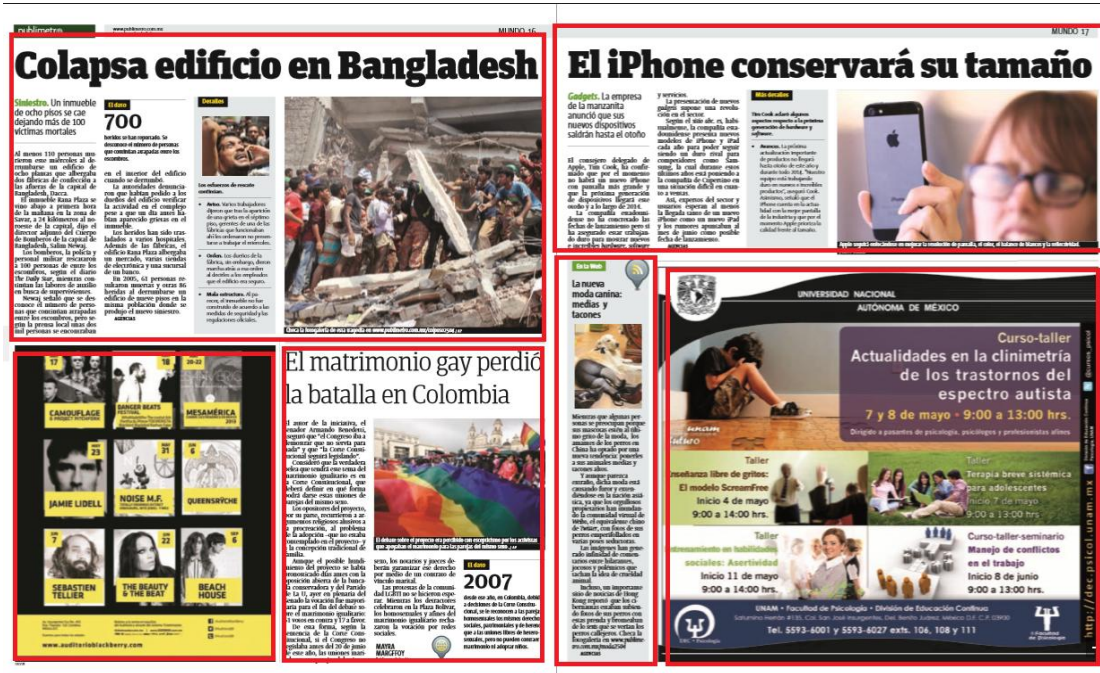
Imagen 12. Sección MUNDO. Jueves 25 de abril, 2013

Este apartado es uno de los más extensos en número de páginas en este periódico, esto debido a la amplia cobertura que deben hacer sobre los sucesos acontecidos en el panorama mundial.