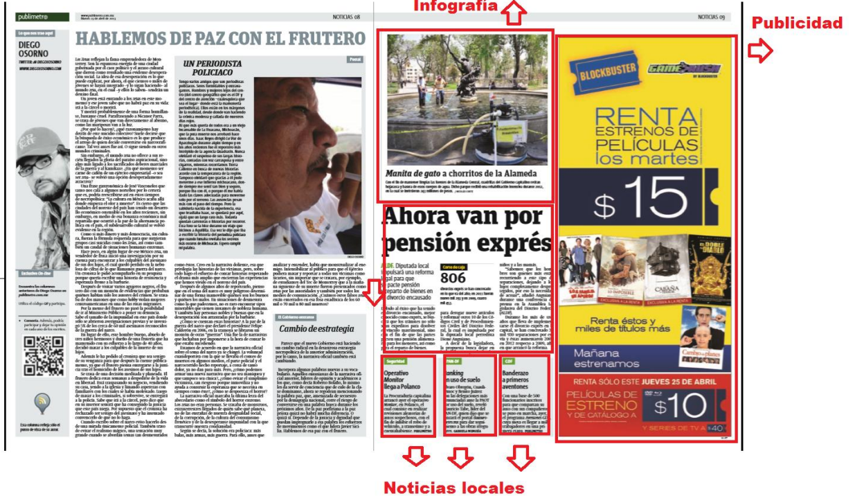
Imagen 6. Sección NOTICIAS. Martes 23 de abril, 2013

En algunas otras planas de esta sección, se presentan las Infografías y las Notas Breves para exponer cuestiones de interés sobre la ciudad, éstas dos formatos son otra opción de Publimetro para presentar las notas, y debido a su extensión reducida son varias las noticias que se presentan en una página.