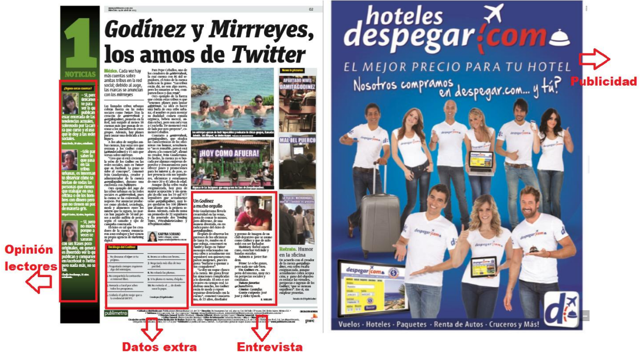
Imagen 4. Sección NOTICIAS. Miércoles 24 de abril, 2013.

Un ejemplo de noticia principal es la nota de arriba; ésta comunica la existencia de dos grupos sociales, de cómo surgen, y cómo “conviven e interactúan” en las redes sociales. De acuerdo con Publimetro , la realidad social también corresponde a lo que ocurre en la realidad virtual, desde ahí se forman grupos y comunidades, ese es el nuevo espacio donde las personas existen y que por lo tanto debe ser comunicado.