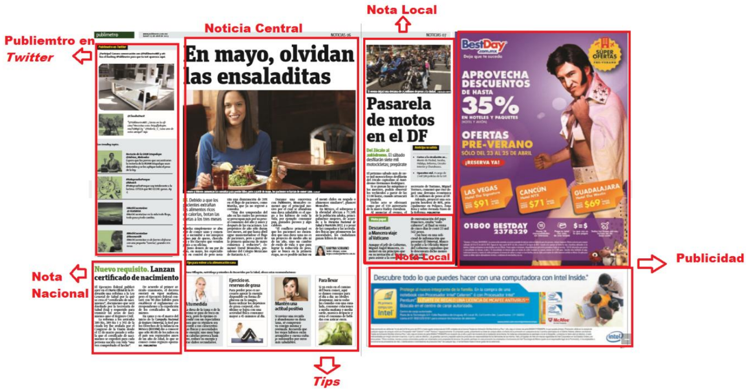
Imagen 5. Sección NOTICIAS. Jueves 25 de abril, 2013

En algunas páginas de este diario hay hasta ocho espacios donde se publican notas informativas y publicitarias. En este tipo de planas suele haber una noticia central, que es la de mayor extensión a comparación de las notas breves y resumidas que están posicionadas alrededor de ésta.