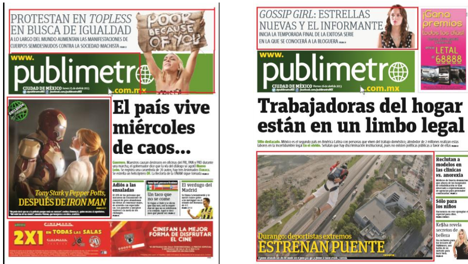
Imagen 2. Primera Plana, en orden: lunes 22, martes 23, miércoles 24, jueves 25 y viernes 26 de abril.