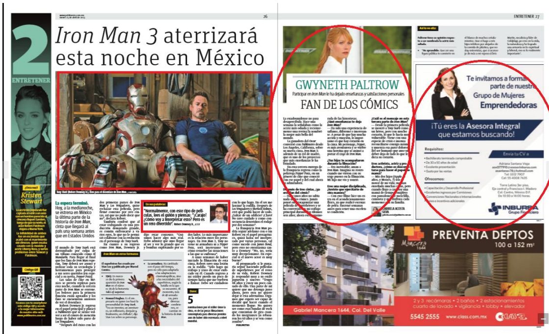
Imagen 18. Sección 2ENTRETENER. Jueves 25 de abril, 2013.