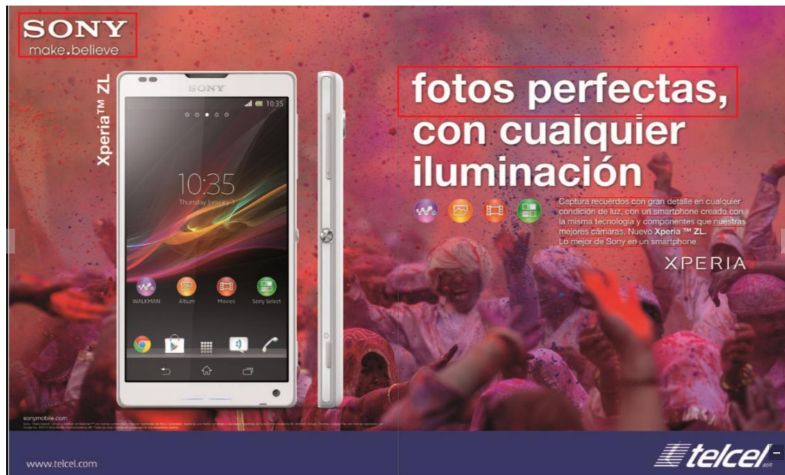
Imagen 1. Falsa portada. Lunes 22 de abril, 2013.

Se trata de un discurso llamativo, con colores y mensajes que proyectan un mundo onírico, lleno de ilusión y fantasía; la vida como una fiesta que divierte, con acontecimientos alegres para disfrutar y celebrar.