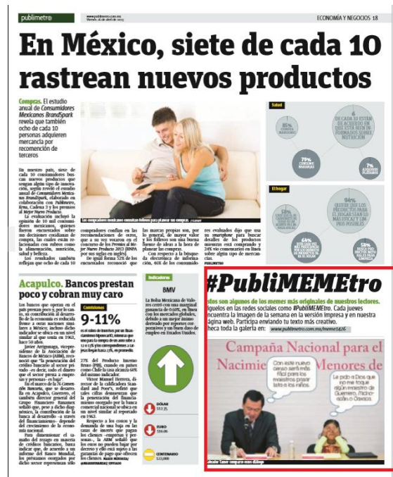
Imagen 7. Sección Noticias. Jueves 25 de abril y viernes 26 de abril, 2013.

PubliMetro en Twitter y los trending topics es el segundo espacio que su contenido informa sobre la interacción, comunicación y protagonismo generado en la realidad virtual (ver Imagen 5).