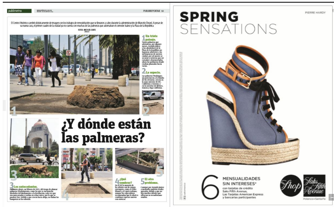
Imagen 8. Publlirreportaje, sección NOTICIAS. Viernes 26 de abril, 2013.

Hasta aquí el contenido de este periódico ha demostrado una realidad muy distinta de la que se vive; se trata de un simulacro que demuestra la realidad como un espectáculo, cada suceso parece tener cierto estilo, estética y armonía, todo parece ser arreglado para ser mirado, como si se tratase de una realidad que debe ser observada y contemplada con emoción, tranquilidad, y entusiasmo, que genera disfrute, sorpresa, que despierte curiosidad y provoca sensaciones que alejan del propio lugar. La realidad que realmente acontece queda alejada y suplantada por una hiperrealidad.