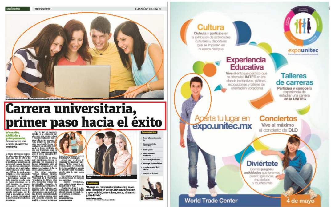
Imagen 17. Sección EDUCACIÓN Y CULTURA. Jueves 25 de abril, 2013

La nota explica una realidad muy distinta a la de las problemáticas del panorama nacional actual y con ello, elimina todo acercamiento con la realidad. Esta noticia informa o más bien publicita una vida hiperreal donde universidades muestran el lugar indicado para el “éxito del resto de la vida” y jóvenes sonrientes “de catálogo” “disfrutaban la experiencia educativa” asociada a la diversión más que a la formación.