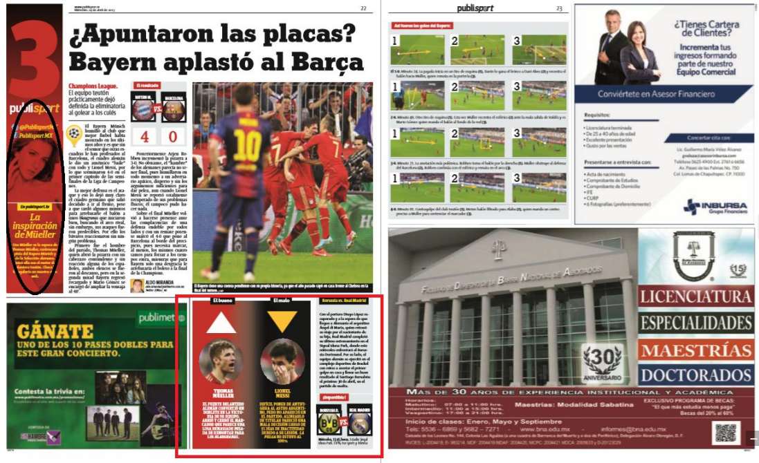
Imagen 21. Sección Publisport . Miércoles 24 de abril, 2013.

El espectáculo y competencia deportiva trata de lograr victorias, el objetivo es ganar, siempre ganar. La contemplación de estos eventos remite a una realidad donde la conquista de éxitos, de valentías da reconocimiento, posiciona en lugares privilegiados, implica admiración y orgullo.