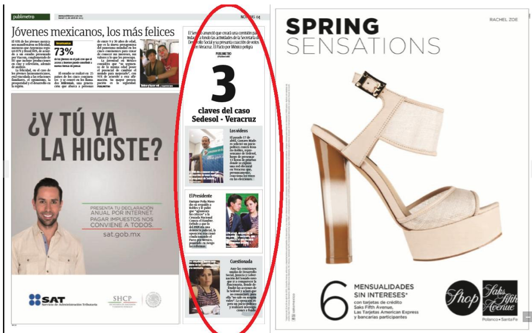
Imagen 11. Sección NOTICIAS. Jueves 25 de abril, 2013.

En forma de guía breve, paso a paso se informa la “seriedad” de este asunto. Parece que fuera un drama de pantalla lleno de intrigas; como una telenovela con estelares, con víctimas y con villanos.