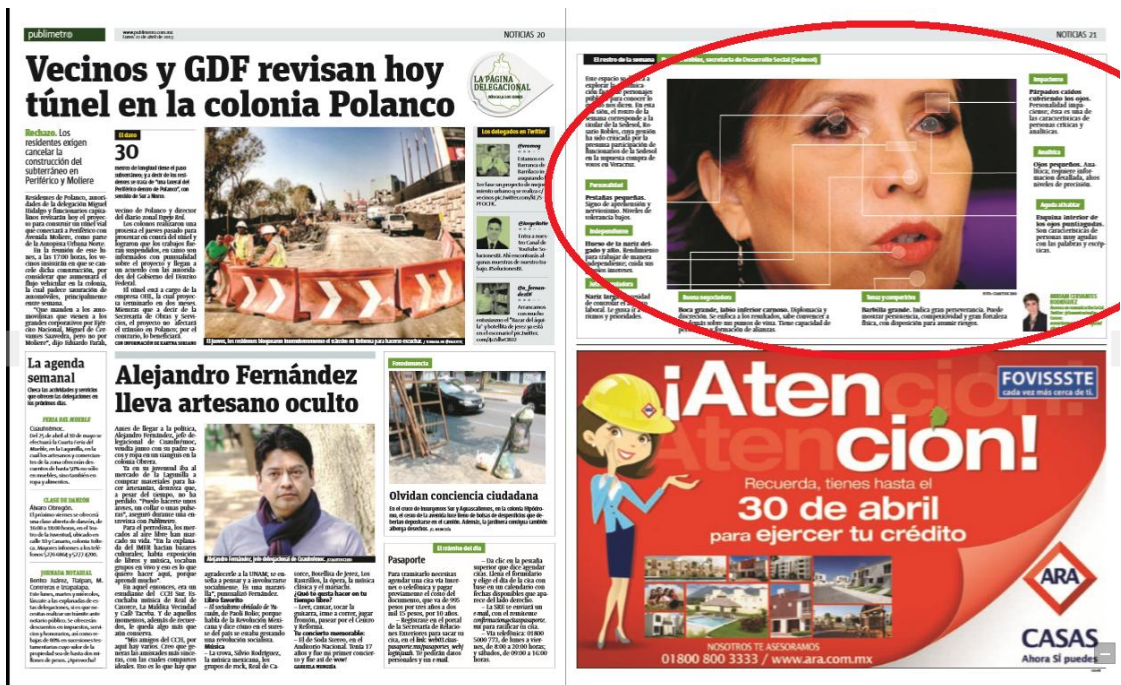
Imagen 10. Sección NOTICIAS. Lunes 22 de abril, 2013.

Ya no se trata de líderes políticos con ideales y compromisos sociales en un contexto, de funcionarios públicos que tienen a su cargo la administración de proyectos para beneficio de la sociedad y que deben responder por sus acciones. La importancia de la historia de su carrera política, el contexto de los hechos y su ideología que la identifica y al hace actuar no son relevantes, más bien se trata de protagonistas con una fachada.