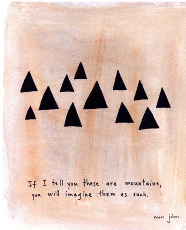
Marc Johns "If I tell you these are mountains". Acuarela sobre papel, 8x10 pulgadas. 2009

ilustrador Marc Jones en uno de sus dibujos afirmó con palabras, describiendo una serie de triángulos en un plano "Si digo que estos triángulos son pinos, entonces pensarás en ellos como pinos".