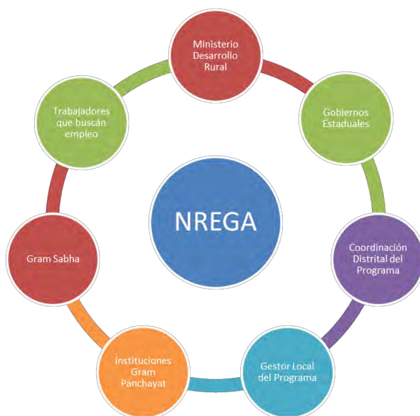
Figura 2 – Estructura de Gestión del Programa NREGA