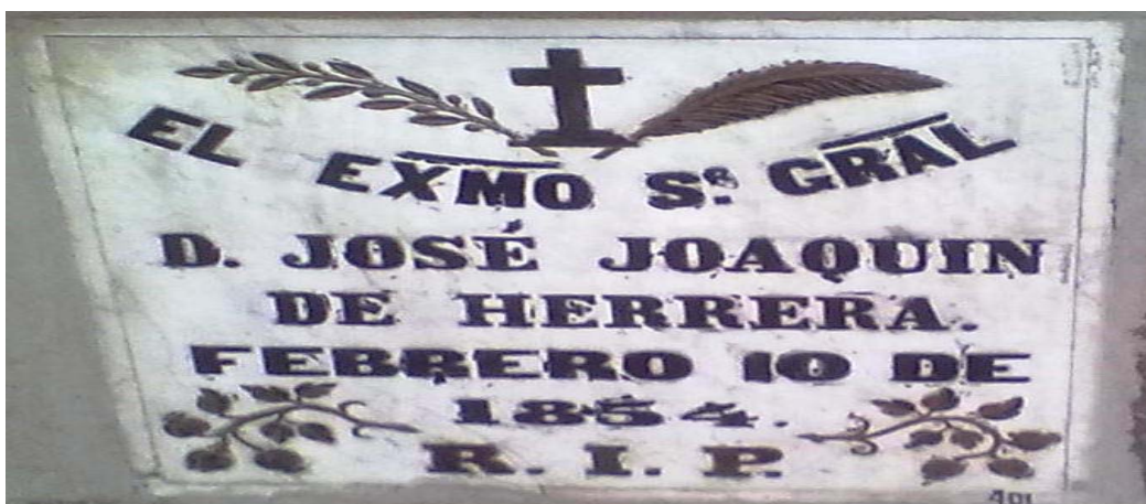
Imagen de la cripta número 401 del panteón San Fernando, donde yace enterrado José Joaquín de Herrera