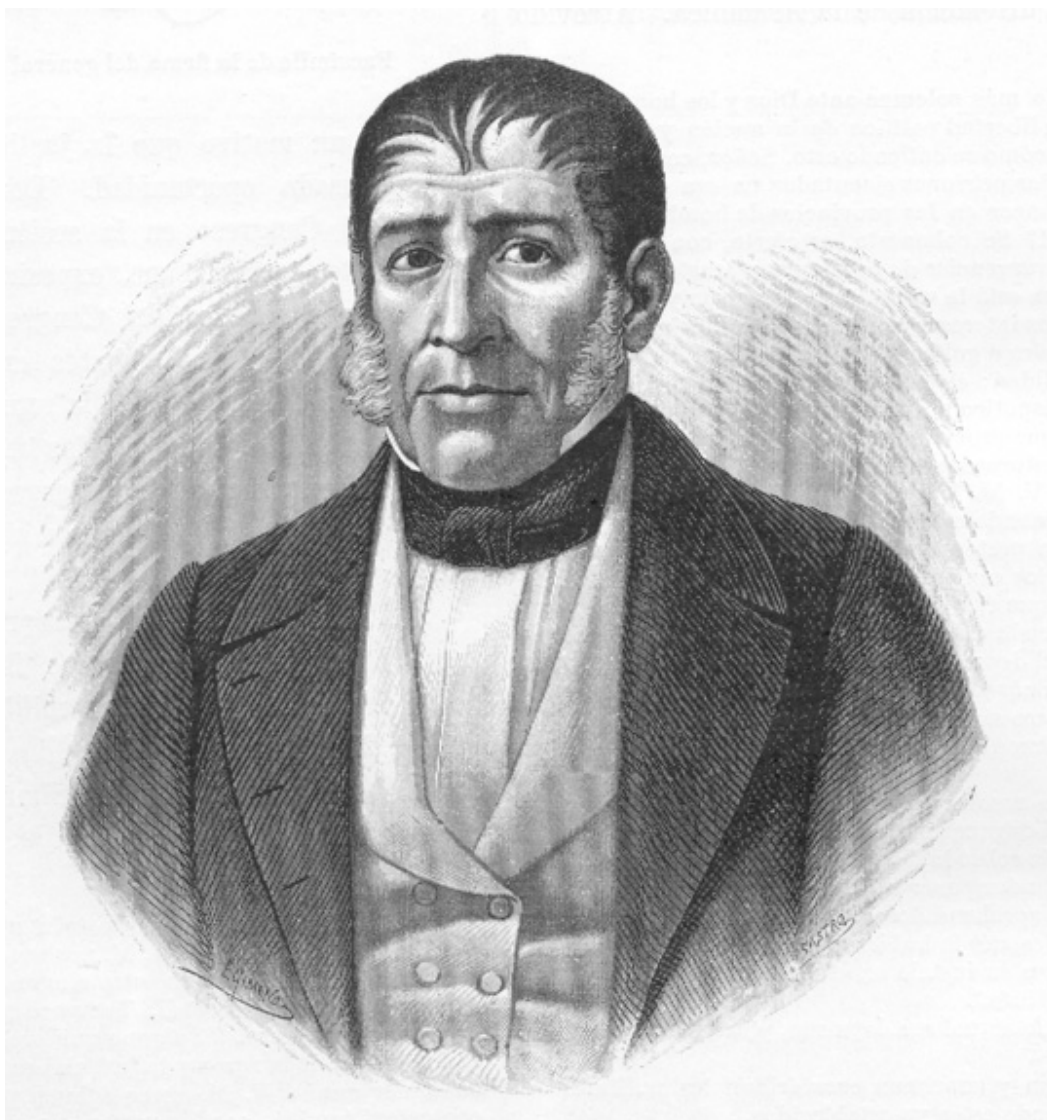
Imagen más conocida del personaje: