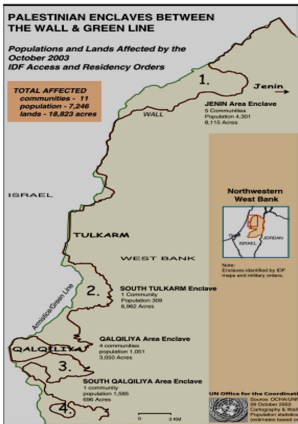
MAPA 2. Enclaves palestinos entre el muro y la Línea Verde. 100