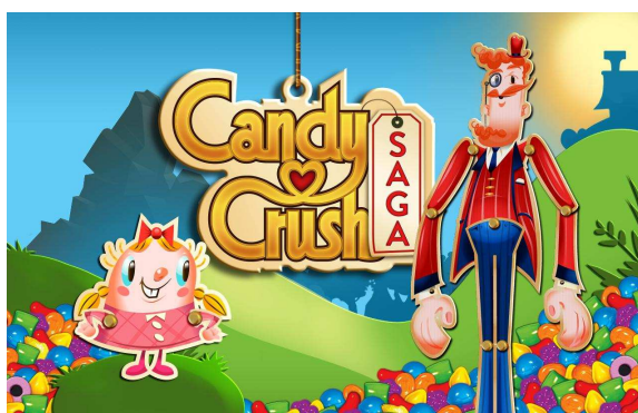
Ilustración 5: el popular juego en Facebook llamado Candy Crush tiene sus prolegómenos en los MOOs

utilización, aunque obedece a proyectos colaborativos, tiene un fin de ocio y entretenimiento. Brevemente, puede decirse que los MUD o MOO 42 , son juegos multiusuarios en donde cada participante representa a un personaje que debe confrontarse con otros jugadores (Zorrilla, 2003). Esto dio pie a que actualmente los MUD y MOO sean usados principalmente por video jugadores. Vale decir que algunos MUD y MOO en línea, ya permiten que los usuarios chateen entre ellos. Resulta importante mencionar que juegos ofrecidos por Facebook, los cuales son muy populares entre los jóvenes actualmente, poseen sus precedentes en estas comunidades virtuales (para muestra ver ilustración 6)