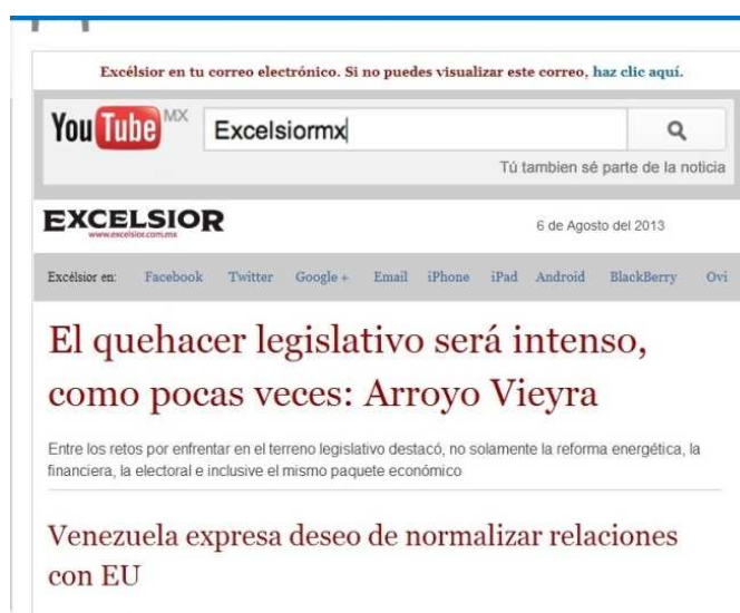
Ilustración 3: ejemplo de lista de difusión, Diario Excélsior.

Se organiza, ya sea jerárquicamente, lo cual implica que un administrador mande el mensaje; o bien, informalmente, puesto que cualquier miembro puede mandar estos mensajes (Zorrilla, 2003). Uno de los puntos por los cuales estas comunidades no cuentan con la total aceptación de los cibernautas, es que en muchas ocasiones generan spam en los correos electrónicos. Para muestra, la lista de difusión enviada por el periódico Excélsior (ver ilustración 3).