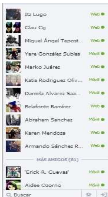
Ilustración 4, ejemplo de Chat en Facebook

También hay chats que permiten una comunicación más privada, sean términos de interpersonalidad virtual, o bien, mediante grupos más privados. Basta decir que el desarrollo de software como Messenger permitió que se gestaran conversaciones de este tipo. Aunque cabe precisar que con el desarrollo tenido por el ciberespacio, actualmente las opciones se han diversificado, incluso programas como Messenger desaparecieron; de igual modo, han emergido otros como Skype (que permite video llamadas), además de que redes digitales como Facebook y Google + han incorporado a sus servicios aplicaciones de tipo chat . Para muestra, ver la ilustración 4.