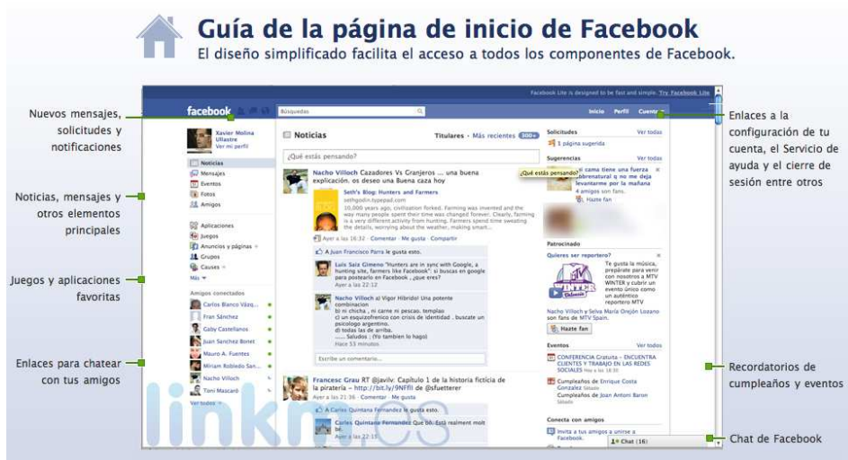
Ilustración 9: Facebook, ejemplo de red social virtual