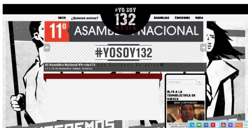
Ilustración 7: el movimiento #YoSoy132 generó una página/blog donde sube toda la información del movimiento.

De igual modo, los blogs son herramientas que surgen para que determinados grupos compartan sus inquietudes, intereses y necesidades. En ocasiones pueden ser un medio para constituir proyectos de índole colaborativo, sea en el plano laboral, de investigación o escolar, en tanto que: “promueven la comunicación horizontal en empresas, escuelas y organizaciones” (Zorrilla, 2003: 61). Para muestra ver ilustración 7.