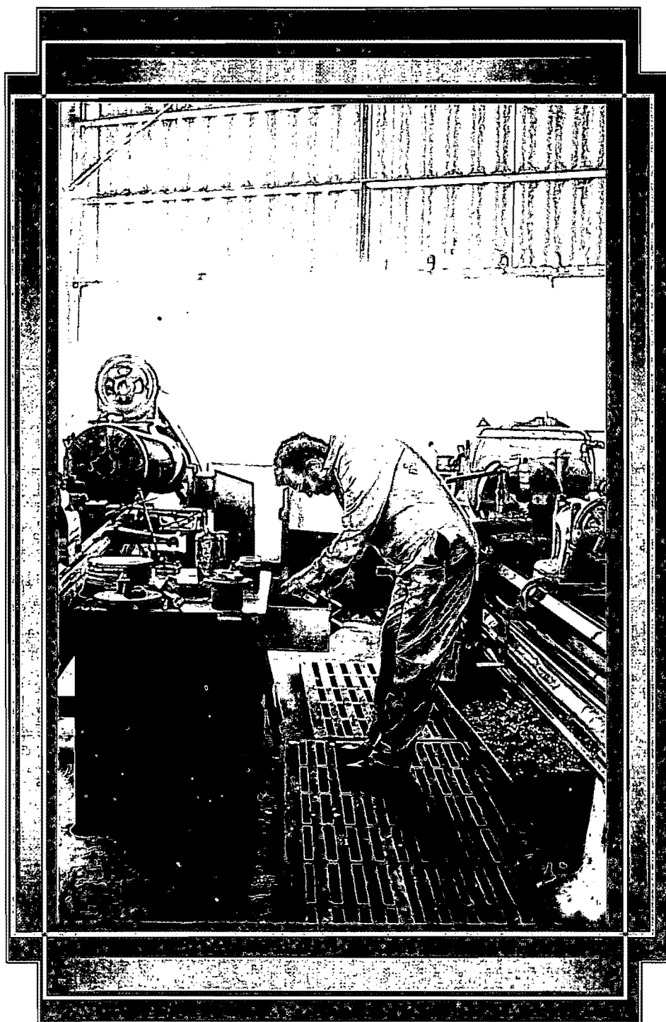
Herramienta y maquinaria