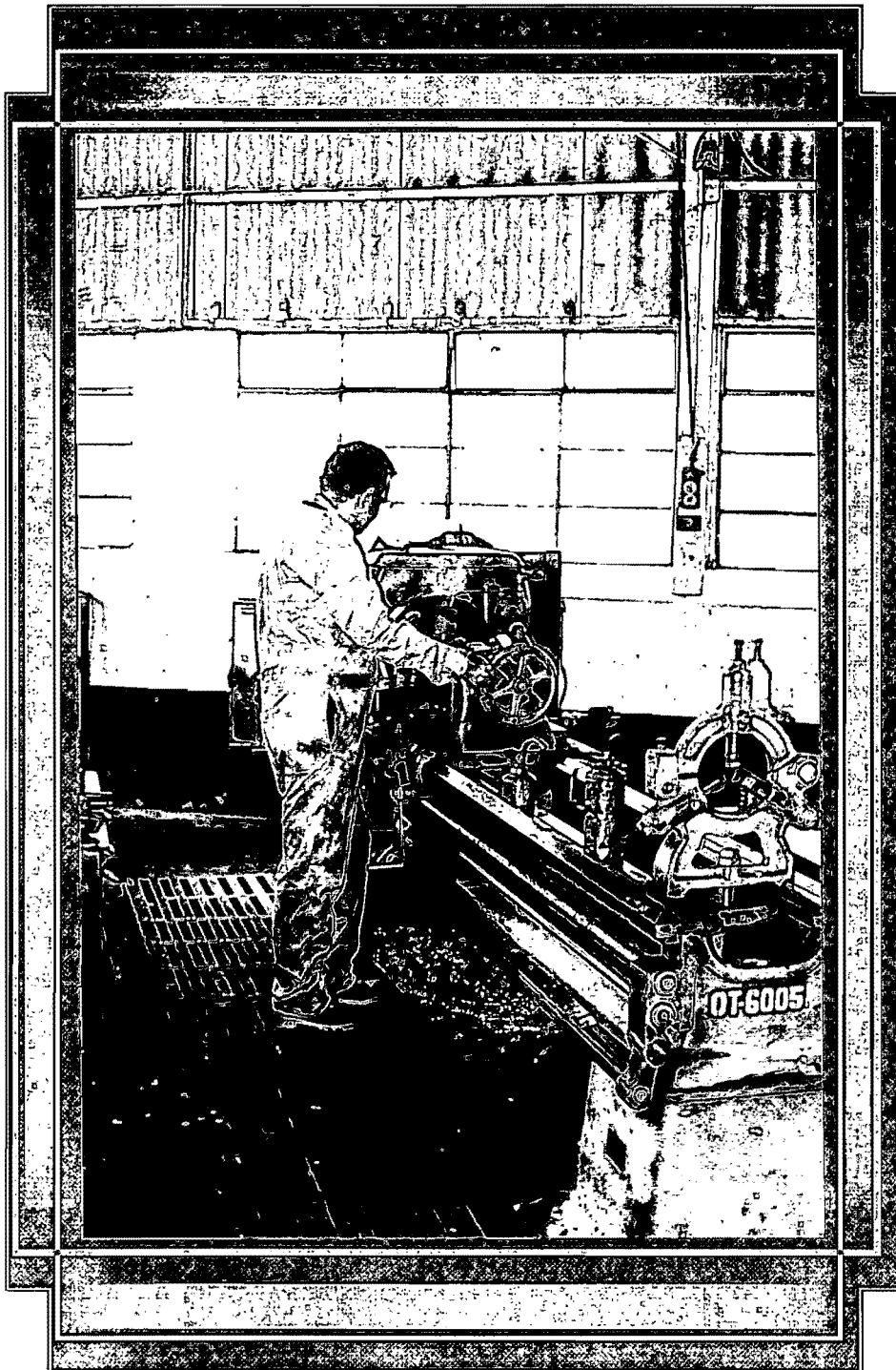
Carga estática sostenida