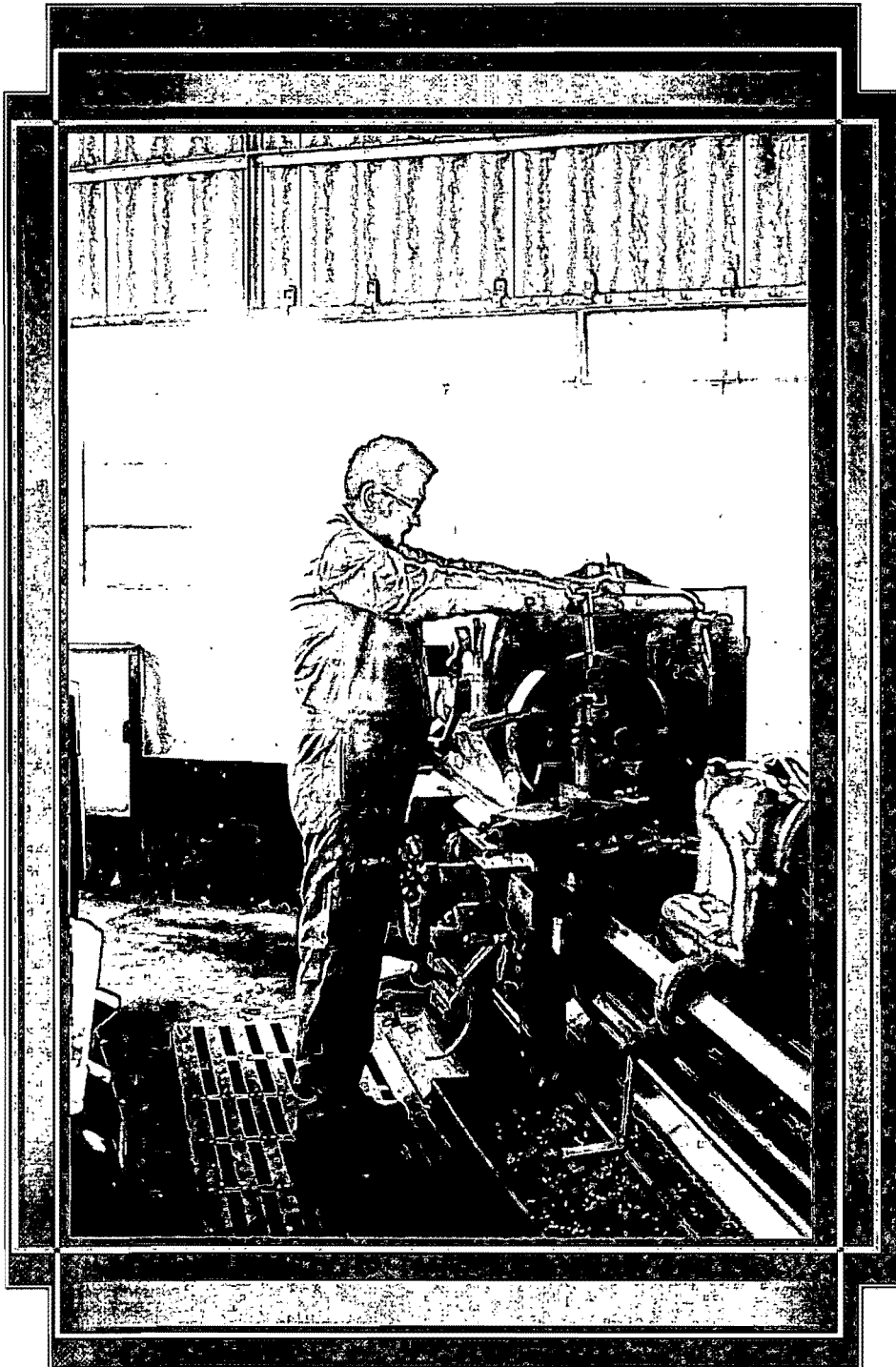
Aplicación de fuerza