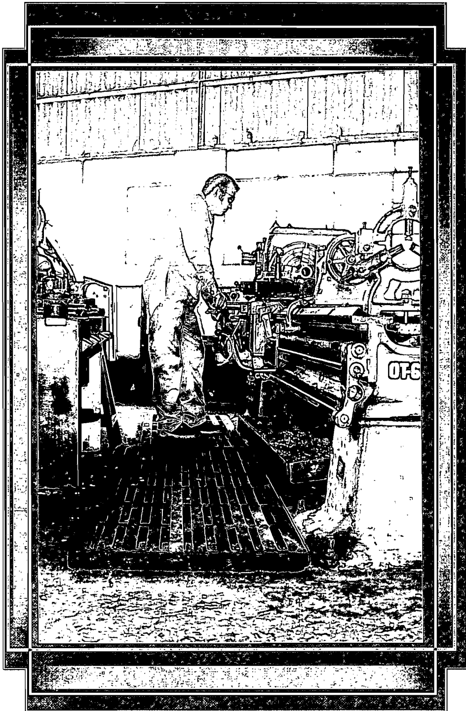
Medio ambiente laboral