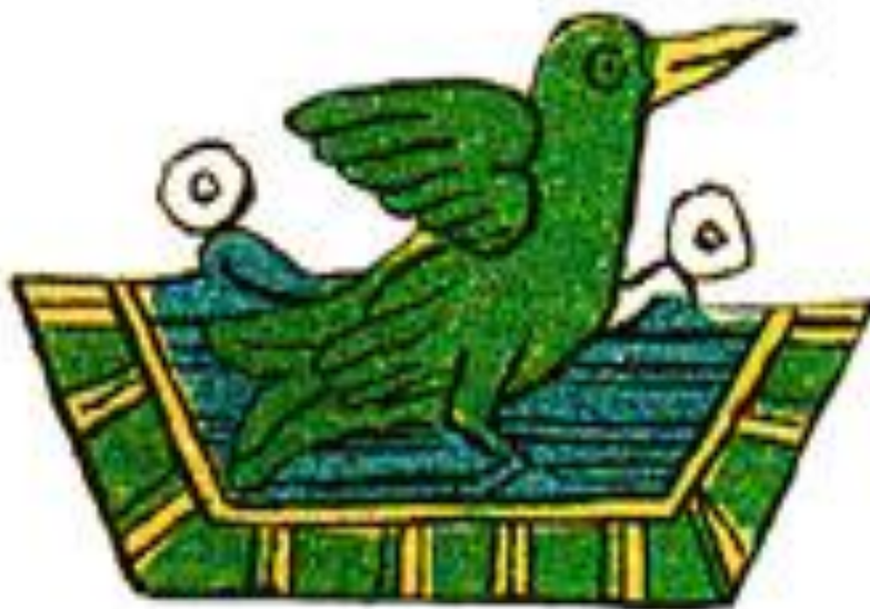
Dibujo 1: Símbolo de Huitzilalapan, “ Río de Colibríes ” “En el agua de los colibríes”