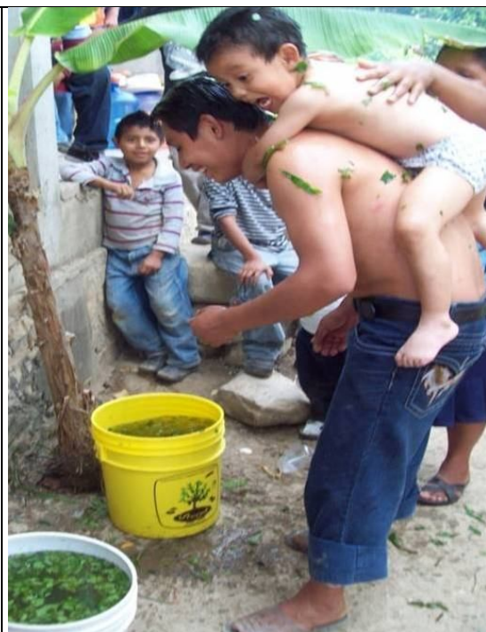
Rito del maltiaconetzi o baño del niño (las dos imágenes superiores); también del maltiaconetzi llevan al niño a conocer su milpa (imagen inferior).