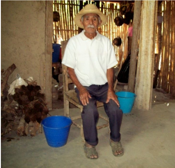
Entrevistado. 76 años. Originario de Aguacatitla.