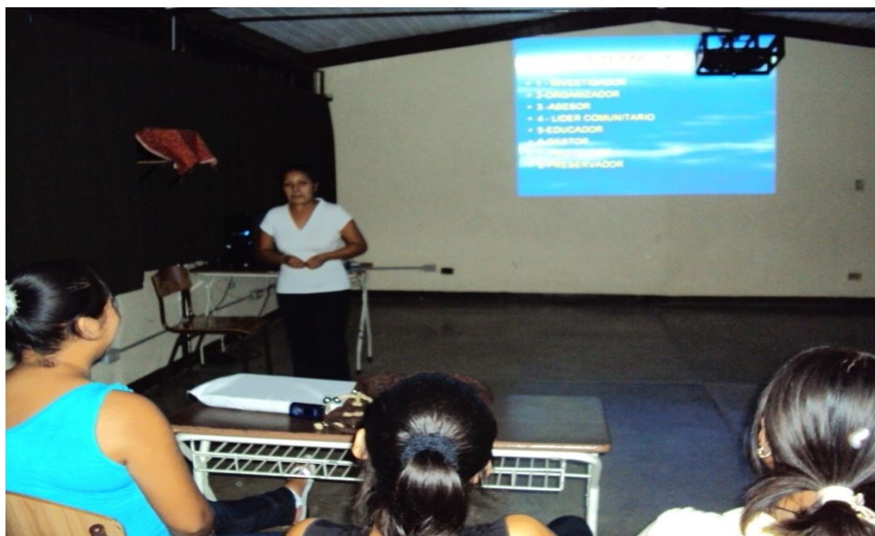
La pasante en Trabajo Social otorga sus clases de la cuarta unidad.