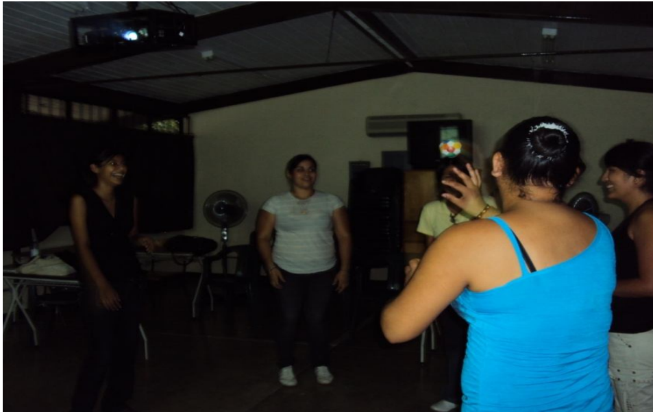
Aplicación de la dinámica de los tres elementos del mundo.