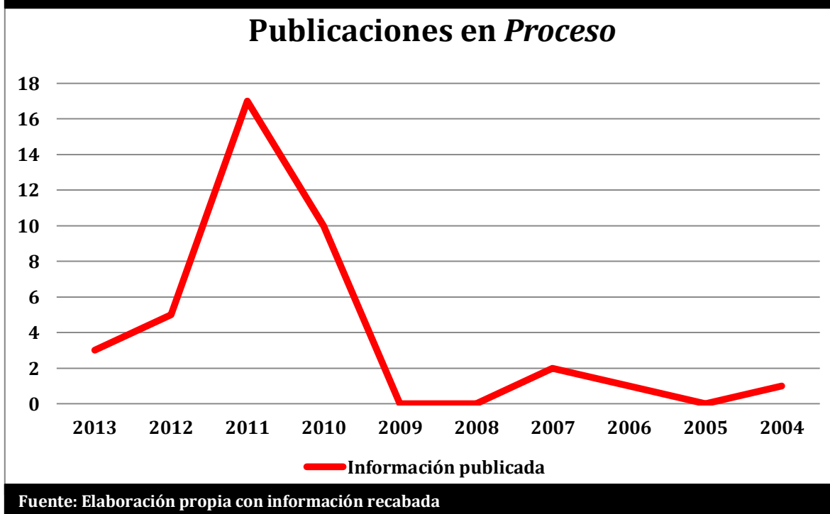
GRÁFICA 1: PUBLICACIONES EN EL SEMANARIO PROCESO DEL AÑO 2004 AL 2013

La anterior gráfica presenta el movimiento de información publicada en Proceso , mostrando el pico más alto en 2011.