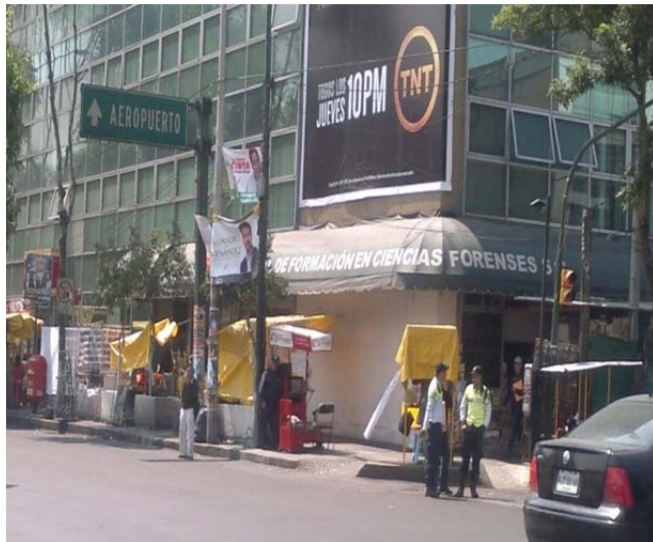
Exterior de las instalaciones de la Academia Internacional de Formación en Ciencias Forenses, S.C., en la Ciudad de México. 4 de junio de 2012.

Este contexto es bien complicado (sic), porque ellos tampoco son tan criminales, están siendo educados de esa manera y la solución no es castigarlos, criminológicamente hablando tendríamos que proponer medidas alternativas que sean integrales. Las instituciones deberían brindar a estas personas terapia de pareja, de familia y penalizarlos con trabajo comunitario.