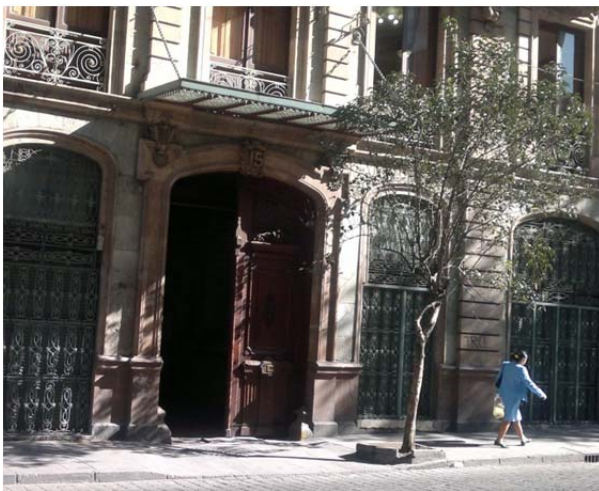
Fachada de la UAPVIF Cuauhtémoc. Ciudad de México. 20 de julio de 2011.

Todavía recuerdo que salí de ese lugar completamente conmovida, no pude contener el llanto, porque conocí fragmentos de historias francamente espeluznantes ¡jamás me imaginé tanto dolor en una sola persona! y me pregunté: ¿Cómo se puede vivir así? ¿Por qué esas mujeres toleraban tanto sufrimiento? ¿Qué las mantenía de pie? ¿Qué las impulsaba para continuar? y lo más importante: ¿Cómo iban a salir de eso?