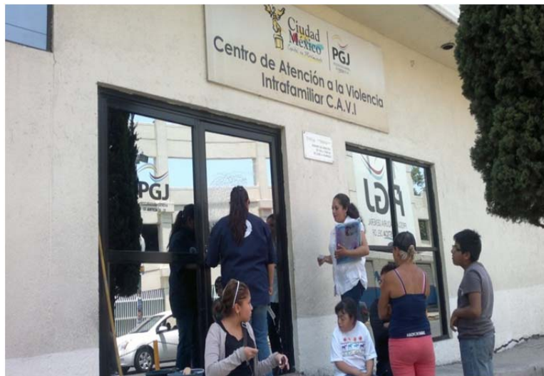
Fachada de las instalaciones del Centro de Atención a la Violencia Intrafamiliar CAVI ubicado en la colonia Doctores de la Ciudad de México. 1 de junio de 2012.

-Durante casi dos años estuve tomando terapias, me enseñaron a valorarme como mujer, como ser humano, como esposa y como mamá, estando aquí aprendí que no todo en esta vida debe ser violencia, porque tengo a mis hijos y a mis nietos, a todos los amo y soy feliz con ellos, pero yo quería estar bien con mi esposo y como él no quiso, ya no pudimos arreglar nada, entonces opté por mí misma, por iniciativa empezar a tramitar un divorcio.