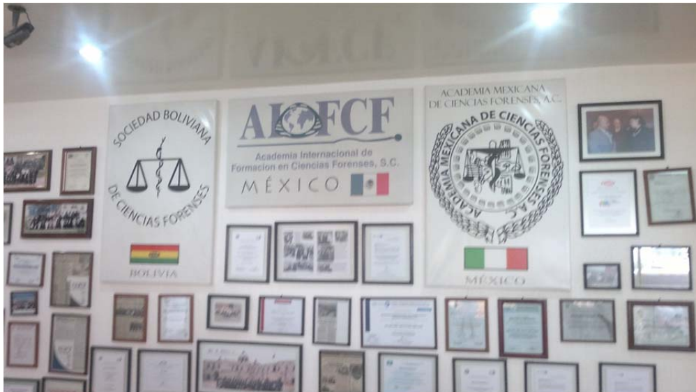
Interior de la Academia Internacional de Formación de Ciencias Forenses, S.C., en la Ciudad de México. 4 de junio de 2012.

-Es así como en el ámbito de las relaciones personales, la conducta violenta se define como el abuso de poder, en el cual, su objetivo principal, no es producir daño a la otra persona, aunque comúnmente lo ocasione, la principal motivación de ésta es someter la voluntad y el poder de decisión del otro, empleando el uso de la fuerza ya sea física o psicológica.