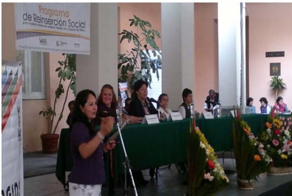
Autoridades y usuarias de centros de servicios en la "Feria de Reinserción Social". 5 de julio de 2012.

A ustedes mujeres y personas que están aquí, las invito para que vean que realmente hay muchos apoyos sociales vinculados todos ellos, para que nosotras podamos incorporarnos a la sociedad. Ahora no me queda mas que decir ¡gracias...muchas gracias a todos! Hoy agradezco a todos los profesionistas y las instituciones que me orientaron.