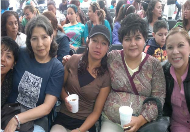
Usuaris de la UAPVIF Cuauhtémoc en el evento de la Feria de Reinserción Social en la colonia Centro de la Ciudad de México. 5 de julio de 2012.

contexto, resulta fácil comprender porque la nueva forma de concebir la conciencia femenina no es un asunto sencillo. Las mujeres que intentan hacer una diferencia en su estilo de vida, tendrán el compromiso, el reto y la responsabilidad de asumir una actitud diferente ante su propia femineidad.