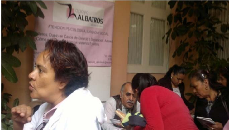
Servicios que se ofrecían en la “Feria de Reinserción Social”. 5 de julio de 2012.

ofrecen, solamente a aquellas personas que son presa de delitos sumamente graves, ¡y no pude evitar sentirme triste, horrorizada e indignada!