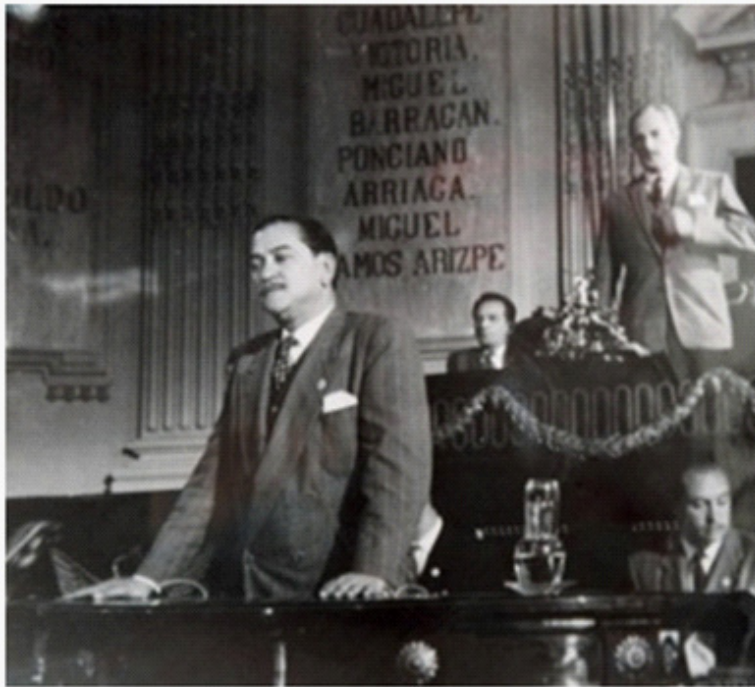
En La Sombra del Caudillo (Julio Bracho, 1960).

humano y su sentido social, y sexto, por su intención generosa y su tributo al Movimiento de 1910”.