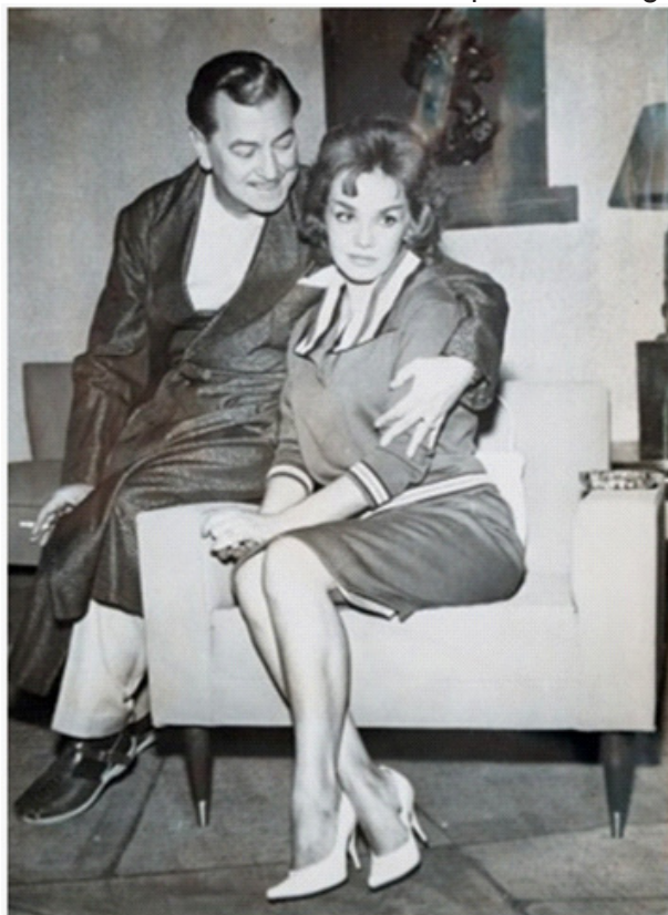
El teatro fue su gran pasión.

En 1966 la revista Cine Mundial publica la siguiente nota: “Viva María”, filmada en la ciudad de