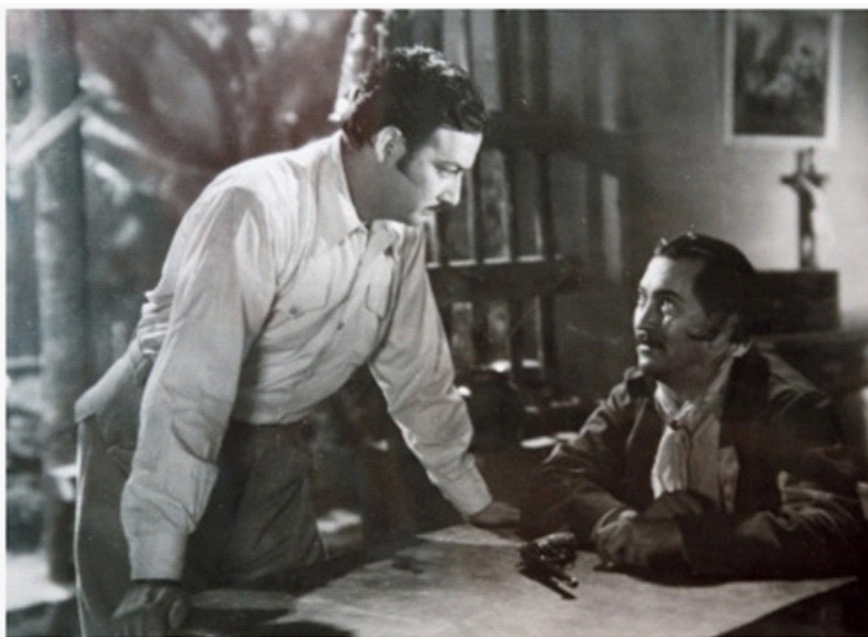
En Canaima (Juan Bustillo Oro, 1945).