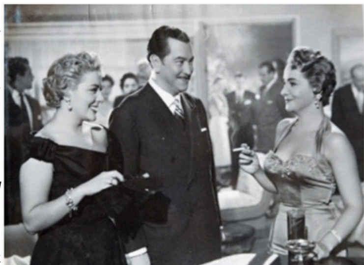
En Locura Pasiona (Tulio Demicheli, 1955).

Felicidad , fue la cinta en que López Moctezuma interpreta a Mario Ramírez Cuevas , un viejo burócrata que se