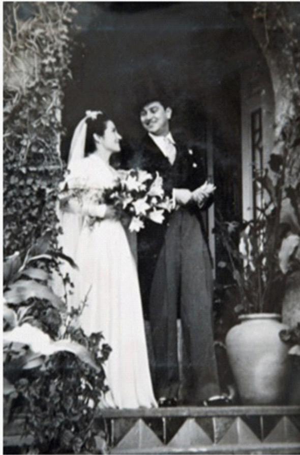
Inician su vida matrimonial el 25 de enero de 1940.