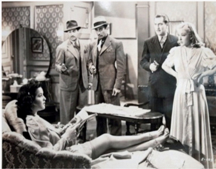
En El gendarme desconocido (Miguel M. Delgado, 1941).

ge Negrete, Carlos López Moctezuma y René Cardona, en El peñón de las Ánimas , historia de haciendas, venganza y muertes trágicas que se convierte en una especie de Romeo y Julieta en versión ranchera.