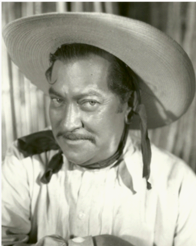
En El Rebozo de Soledad (Roberto Gavaldón, 1952).