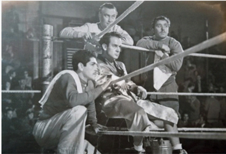
En Campeón sin corona (Alejandro Galindo, 1945)

de de bromear después con Silva: “C’mon, kid”, le dice, pero el tenso héroe lo rechaza furioso “¡Déjeme ya sabe que no hablo inglés!” 20