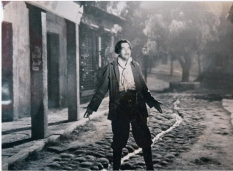
El tigre de Yuruari indefenso ante los delirios de alcohol en Canaima .

se sostiene de una silla al comprobar que es impotente para liquidar a su enemigo; en un súbito ataque de locura trastabillea en las calles gritando al empedrado su rabiosa mentira: “He matado a Marcos Vargas”. 24