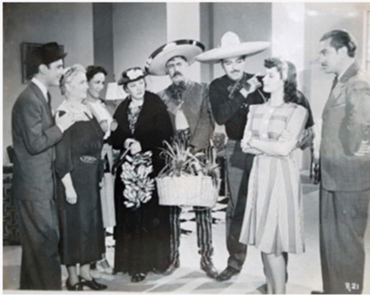
En Del Rancho a la Capital (Raúl de Anda, 1941).

de financiamiento (el Banco Cinematográfico), producción y distribución. Otra causa, importantísima, fue la ayuda norteamericana”. 17