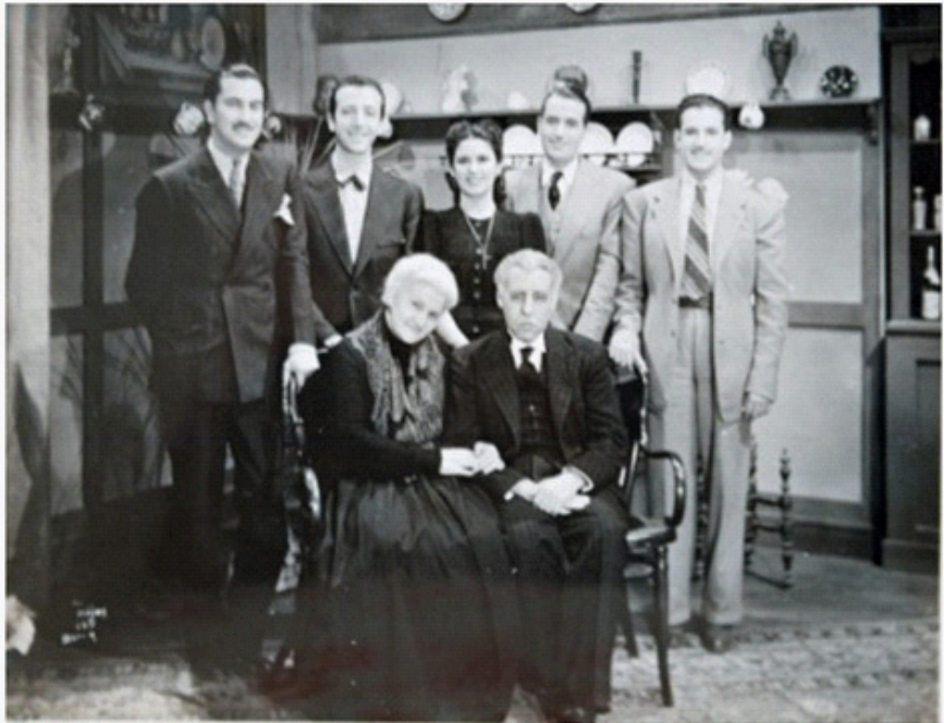
En Cuando los Hijos se Van (Juan Bustillo Oro, 1941).

mada arquetipo 12 del género de la familia: “El deseo de saltar a un canto hogareño permaneció sin menoscabo en el primer plano de mi mente. La vinculación a los lazos familiares y a su ternura, reavivados intensamente por la partida de mi hermana Virginia, me instigaron a proponer un filme de expresión emocional, que me nació con el título ya hecho: Cuando los hijos se van.” 13