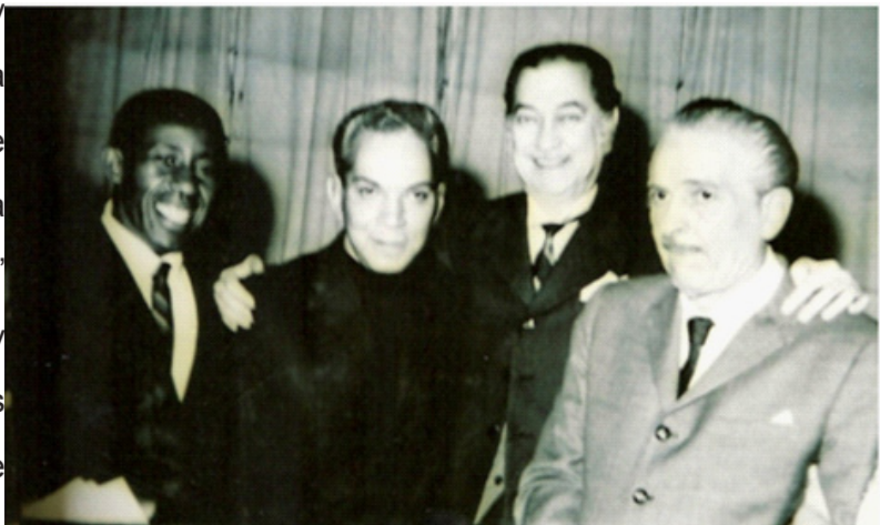
En el festejo de Los zorros Mario Moreno Cantinflas , Carlos López Moctezuma, Arturo de Córdova y Zamorita.

diferente carácter una supuesta oposición de principio entre el cine “oficial” (la estimable y costosa obra de Isaac) y el “revolucionario” ( El grito , cinta de realización muy precaria) anunció el peso muchas veces equívoco y simplificador que lo ideológico cobraría en la marcha