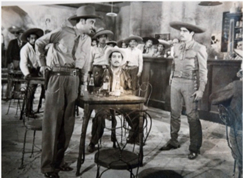
En Sota, Caballo y Rey (Roberto O'Quigley, 1944)

nal, fluye el deseo de modernización en todos los ámbitos, desde el hogar donde aparatos eléctricos con diseños extraños ayudan a las amas de casa en los quehaceres del hogar, hasta la industria donde la agilización de los procesos de producción prometen el ingreso al primer mundo.