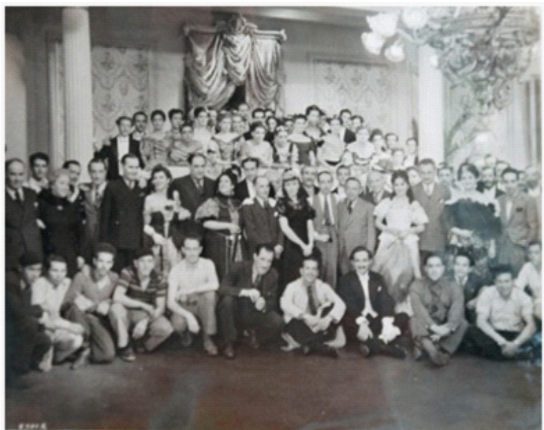
En Perjura (Rafael J. Sevilla, 1938).

Para 1939, López Moctezuma despegaba como el villano por antono-