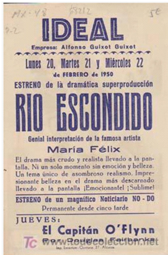
Río Escondido (Emilio Indio Fernández, 1947).

Es el año de 1947, se crea la Comisión Nacional Cinematográfica, entre cuyos propósitos se encontraba “salvar al cine nacional con la calidad estética de sus películas”, ejemplo contundente de este propósito es Río Escondido , que en su exhibición a la prensa recibió vibrantes y emotivos comentarios: