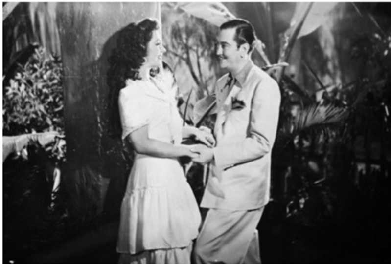
En La reina del Trópico (Raúl de Anda, 1945).

“Jorge Negrete interprete del personaje central de la película ya no se mueve como un charrito fanfarrón y cantador, sino como un hombre verdadero que se enfrenta al horror de la selva; es en Canaima donde Negrete se encuentra como actor, dominando la expresión, la mímica y la actuación propiamente dicha”.