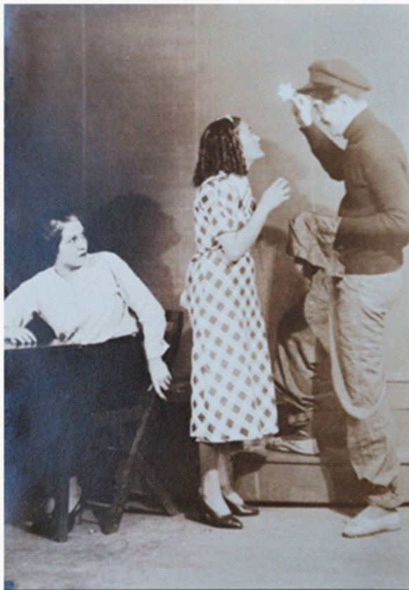
En la obra Liliom del también llamado Teatro Experimental .

“La temporada anunciada será corta pero selecta: cuatro programas solamente, integrado el