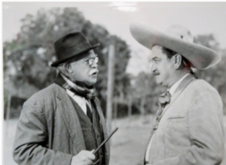
En Simitrio (Emilio Gómez Muriel, 1960).

En el año de 1961 colabora con quien fue su productor de cabecera, Raúl de Anda en Alias el Alacrán , película de aventuras tipo western donde el Charro Negro , interpretado por el mismo de Anda enarbola la bandera del bien contra el mal.