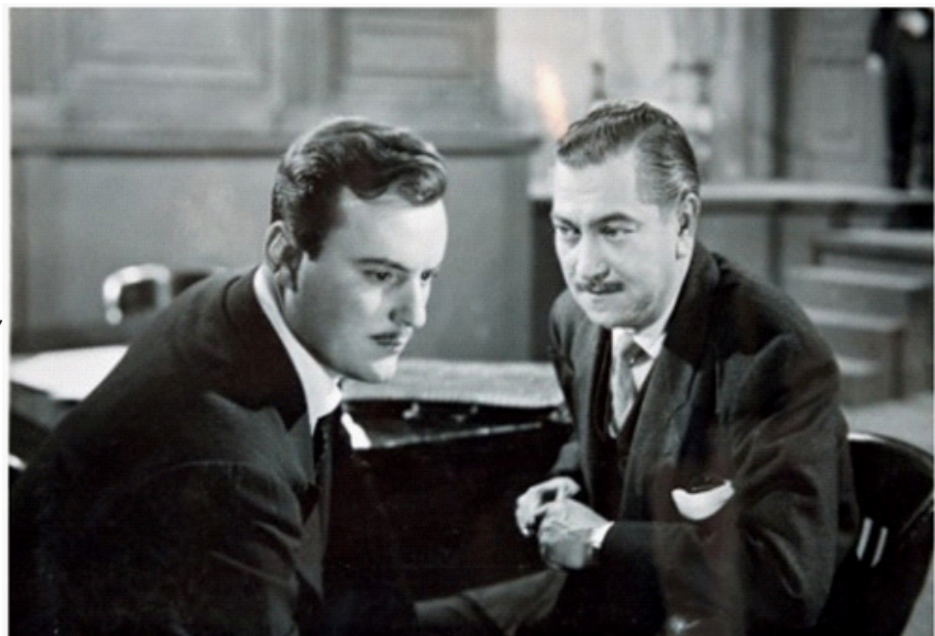
En Asesino X (Juan Bustillo Oro, 1954).

Chilam Balam, profeta maya interpretado en el año de 1955 por Carlos López Moctezuma dio pie, en la columna Ases y Estrellas del periodista y poeta Efraín Huerta, a los siguientes comentarios: “Sin clarinazos, antes bien, discretamente, la cinta mexicana “Chilam Balam”