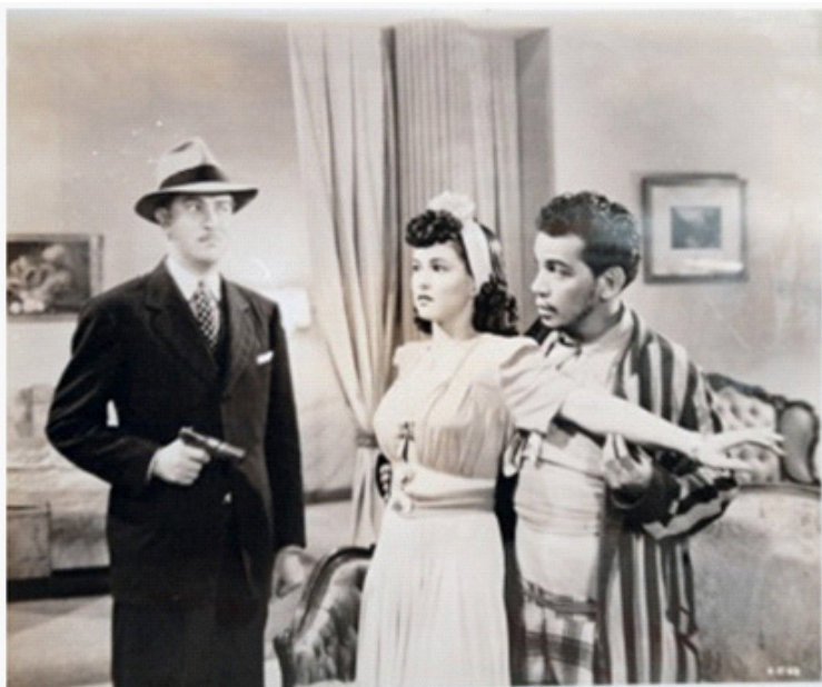
Mario Moreno Cantiflas , Mapy Cortéz y Carlos López Moctezuma. Otra causa: una atención del estado que se tradujo en medidas favorables

Participó también en Amanecer Ranchero y Lo que sólo el hombre puede sufrir .