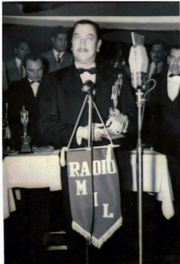
En Marzo de 1949 recibe su primer Ariel .

En 1950, los Campos Elíseos también sucumben ante la maldad de Regino Sandoval al ser exhibida la película, con gran éxito, en las salas Ópera y la que lleva el nombre de la famosa avenida.