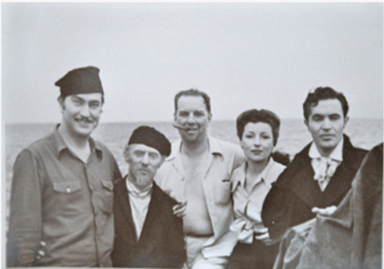
En Ave de paso (Celestino Gorostiza, 1945).

De los artistas del reparto dice así uno de los principales críticos madrileños: “Merecen grandes elogios Carlos López Moctezuma, por su bien estudiado “Coronel Ardavín”; El Indio Bedoya, por su inigualable “Cholo Parima”, y Gilberto González por su magistral “Sute Cúpira”.