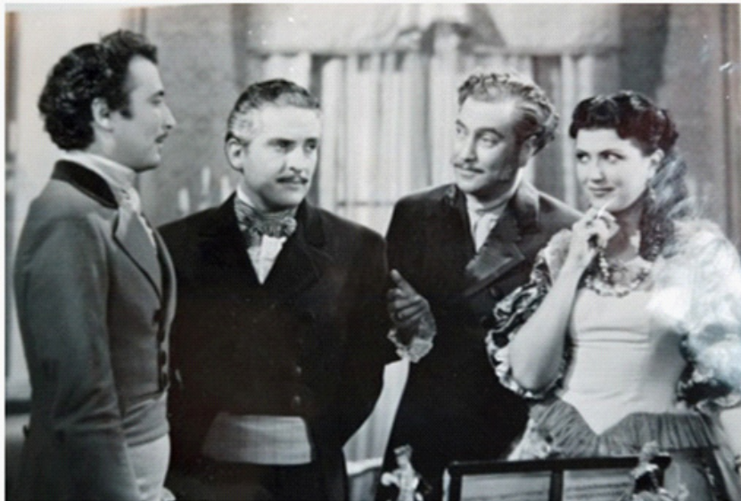
En El Conde de Montecristo (Chano Urueta, 1941).

Especial interés causaron los arreglos a los diálogos escritos por Aurelio Manrique, la música de Silvestre Revueltas. Ahora sí, oímos hablar mexicano con auténtica propiedad sin exageraciones, ni retruécanos de mal gusto. Bajo la dirección de Chano Urueta, Miguel Ángel Ferriz, Domingo Soler, Esther Fernández, Isabela Corona y Carlos López Moctezuma quien da al personaje de Curro toda la fuerza que el papel requiere. Lo que llevó a la prensa nacional a señalar a esta cinta como la más real y más lograda de cuantas se filmaron, hasta entonces, con tema netamente revolucionario.