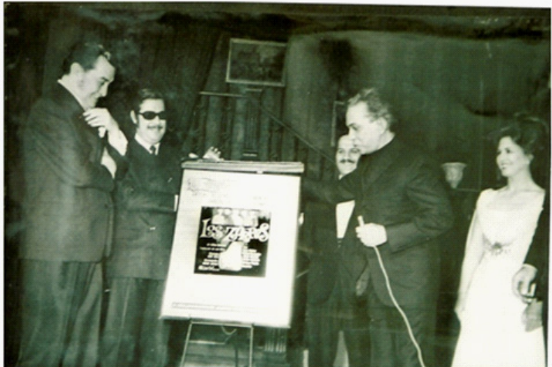
Correspondió a Mario Moreno Cantinflas develar la placa en el aniversario de Los zorros .

“La obra, en tres actos, se desarrolla al sur de los Estados Unidos, una noche de primavera del año 1900. En ella se puso de manifiesto, una vez más, el profesionalismo de los actores, ya que al terminar el primer acto los aplausos fueron muy nutridos.”