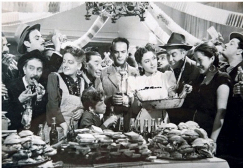
Festejando a “la gloria” del barrio en Campeón sin corona .

Esta escena y otras secuencias en la película dieron pie a un vasto análisis psicológico y social del comportamiento del mexicano de los barrios bajos, como a continuación señala Ayala Blanco: “Para hablar de Campeón sin corona tenemos que pecar, como la película, de psicologismo. Sobre el personaje central pesan varios años de indagaciones psicológicas serias y filosofemas sobre el “ser del mexicano y su complejo de inferioridad. En el mejor de los casos, el rango universal de algunas formulaciones de Samuel Ramos ( El perfil del hombre y la cultura en México ) o de Octavio Paz ( El Laberinto de la soledad ) son tan valiosas como la modestia particularizante de Alejandro Galindo.” 21