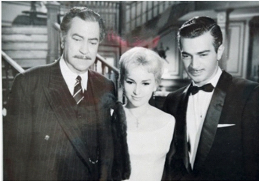
En La Llorona (René Cardona, 1959).

En vacaciones escolares, y cuando no había compromisos de trabajo, se refugiaba en el bello Aguascalientes, donde era recibido por la numerosa familia de su esposa. En varias ocasiones la fecha de su visita correspondía a la feria de San Marcos, donde la ruleta era su juego preferido a lado de su esposa de quien decía le traía suerte.