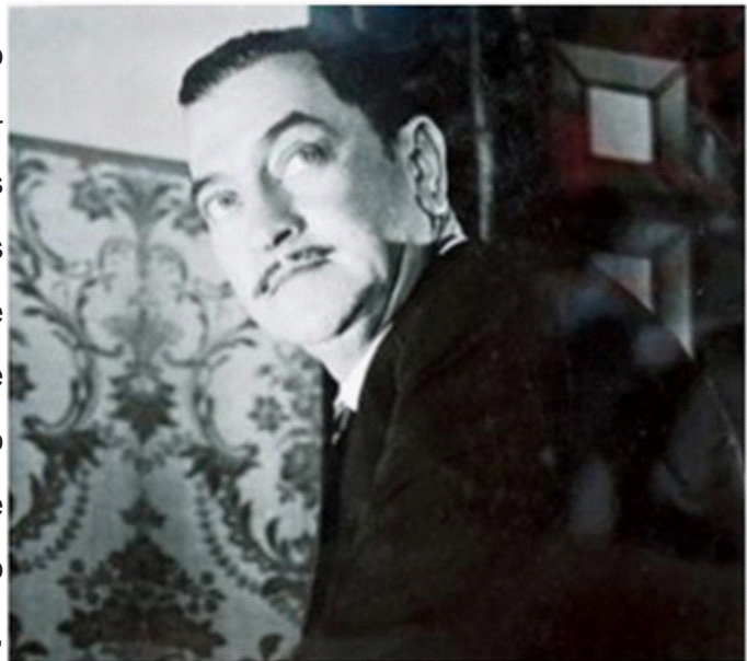
Sus dotes histriónicas lo mantuvieron siempre frente a las cámaras.

"Yo me daba cuenta de que siendo tal como era, mi porvenir estaba en no hacer de galán. Mi físico, mi disposición, los rasgos de mi cara – yo me conozco como pocas gentes logran hacerlo de sí propios -- me dieron la pauta. Después de once años de mantenerme en mi segundo plano, he visto pasar a mi lado a galanas y galanes, que en cuanto se les cae un poco de pelo o engordan, están perdidos. Yo, en cambio, tengo mucha vida artística por delante, y aquí me mantengo".