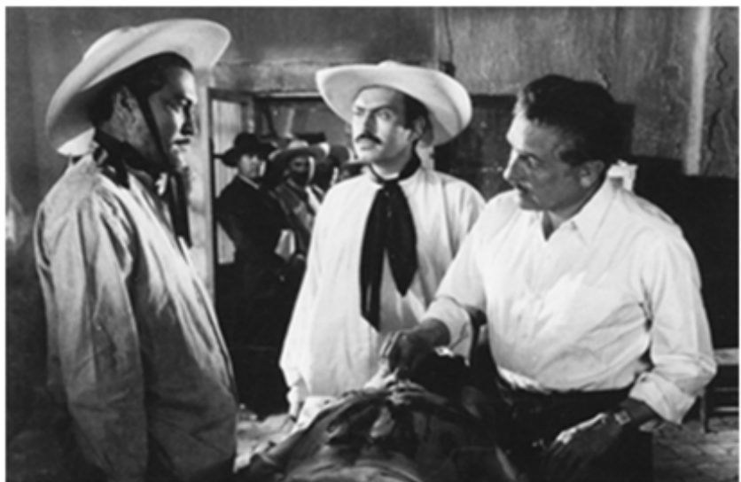
En El Rebozo de Soledad (Roberto Gavaldón, 1952).

“El día del estreno, un jueves y con lluvia se pasó de los 20 mil pesos, y al día siguiente, viernes, se conservó la misma entrada”.