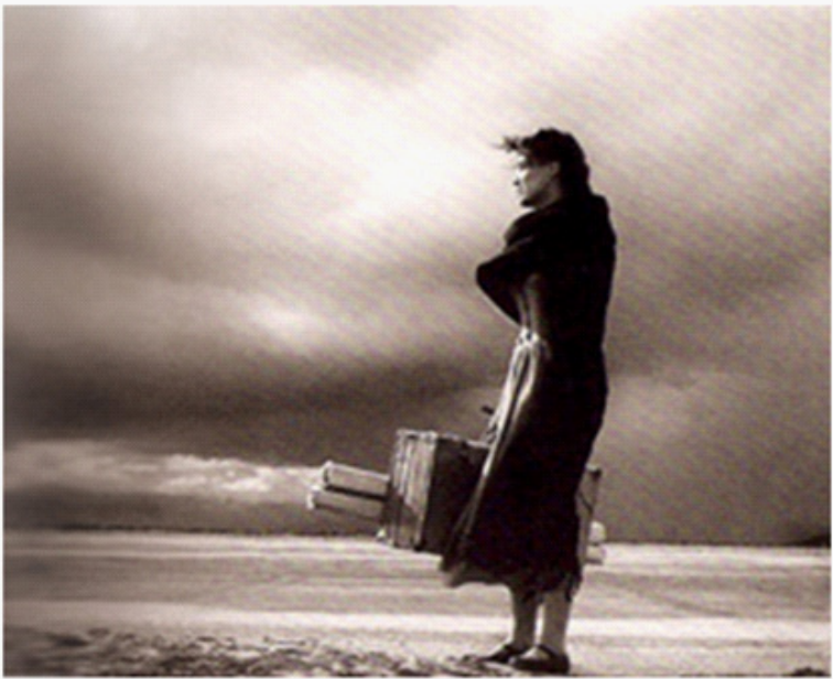
Grandes figuras como María Félix, Gabriel Figueroa y Mauricio Magdaleno se conjuntaron en Río Escondido .

zuma”. En otra colaboración el mismo Leopoldo Pastor resalta las virtudes de Río Escondido afirmando:” Muy contadas películas se pueden clasificar de extraordinarias: Río Escondido es una de ellas, obra cumbre del cine mexicano que se grabó en el celuloide con caracteres fuertes, indelebles y humanos. Una pintura fílmica, coloreada con el blanco y negro de la tragedia de un pueblo. Blanco ‘por el símbolo que representa el amargo sacrificio de una maestra rural, que