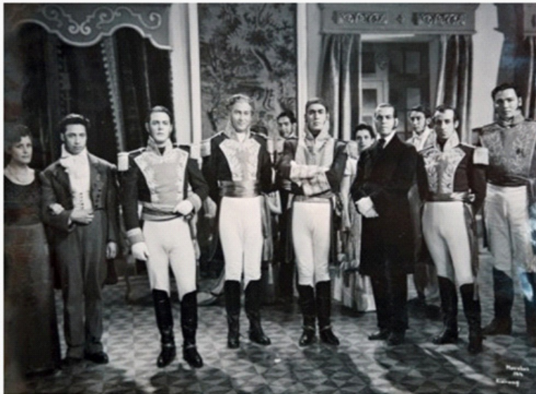
En El Rayo del Sur (Miguel Contreras Torres, 1942).

También interpretó al Comendador Francisco Bobadilla en Cristóbal Colón , película dirigida por