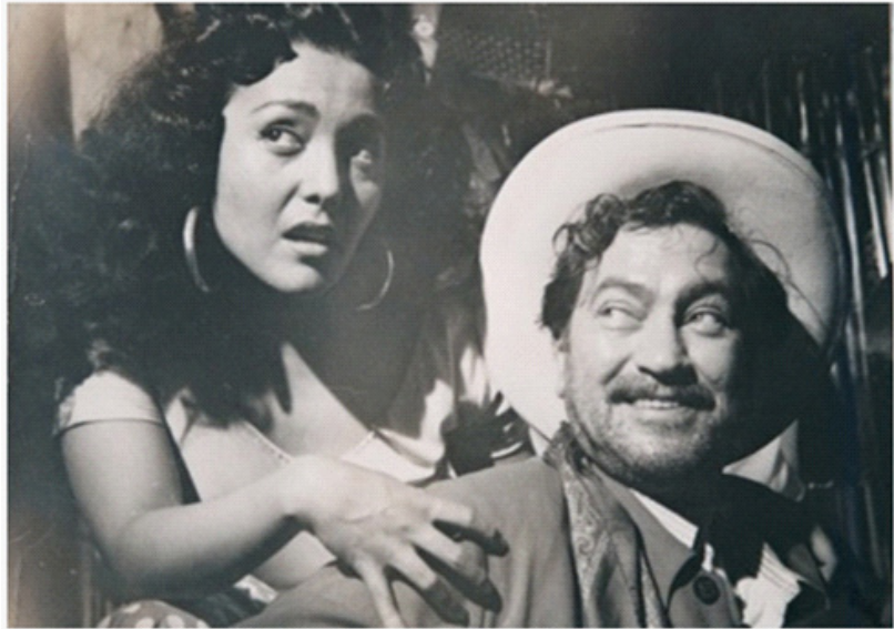
En La rebelión de los Colgados (Emilio Fernández y Alfredo B. Crevenna, 1954).