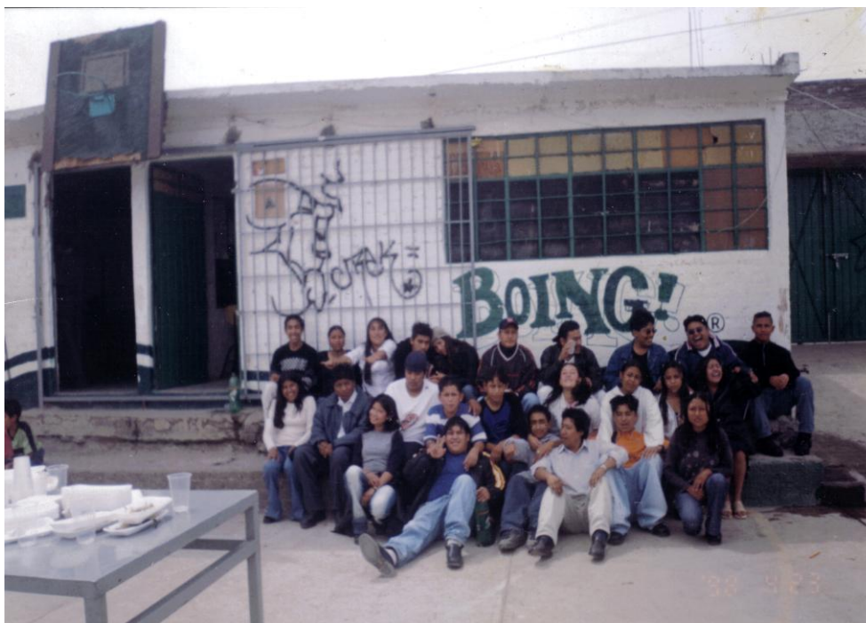
Foto N° 6. Un momento de descanso en la secundaria "16 de septiembre" una vez después de festejar la construcción de la explanada junio del 2005