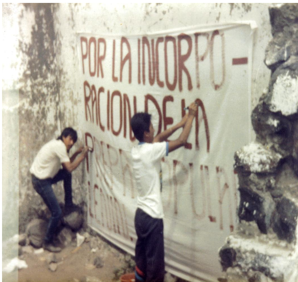
Foto N° 1. Realizando una manta para exigirle al Gobierno del Estado de México el reconocimiento oficial de una preparatoria popular en el Cerro del Marques Municipio de Valle de Chalco Solidaridad.