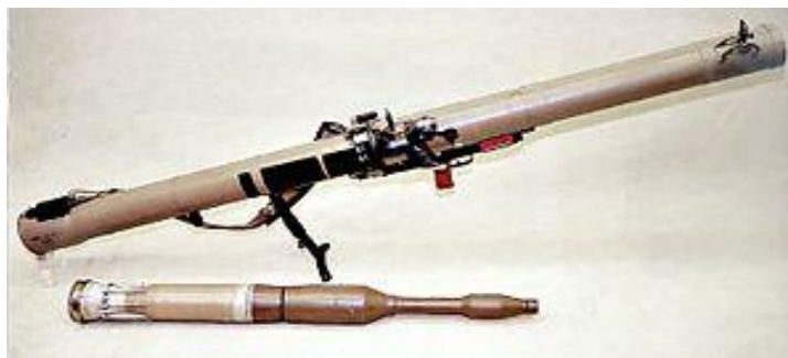
Imagen del lanzagranadas ruso RPG-29 utilizado en la segunda guerra del Líbano.