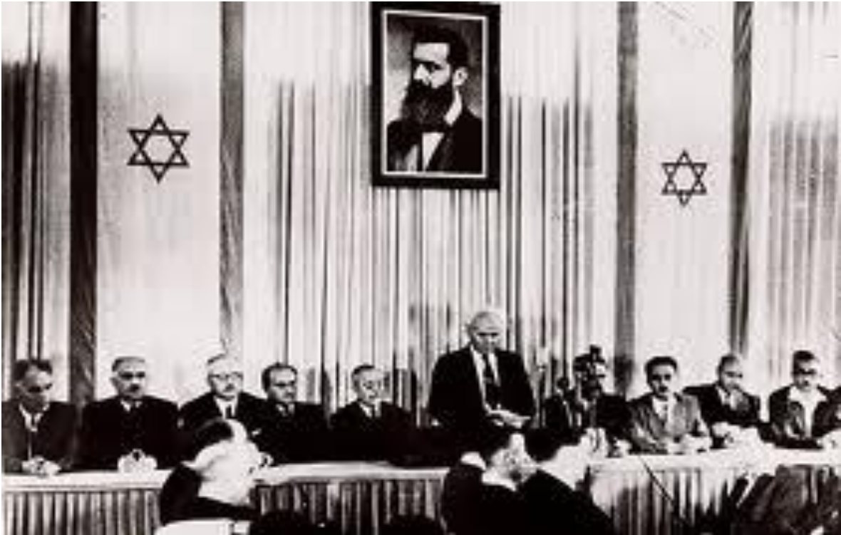
David Ben Gurión durante la declaración de independencia de Israel el 14 de mayo de 1948, en el Museo de Arte de Tel Aviv.

Después del 14 de mayo de 1948 el conflicto tiene la cara que actualmente conocemos, cuyo motor principal es el abuso de poder por parte del Estado sionista, el reclamo sordo de los países árabes, la ocupación de territorios palestinos por parte de los israelitas, los intereses comerciales de los países aliados a Israel. A continuación detallamos una cronología de las guerras que dan una terrible sustancia a esta historia.