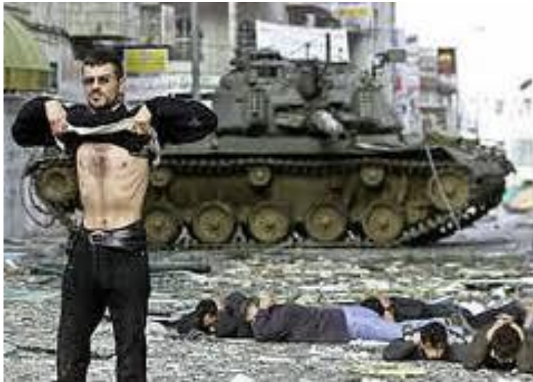
Foto de archivo de la guerra del Líbano en 1982.

de “negligencia grave” la conducta del general Eytan y sobre todo considera que Ariel Sharon faltó a sus obligaciones, por lo cual recomienda su dimisión o su cese. Sharon estuvo fuera de la vitrina política de Israel por espacio de 15 años, pero ningún tribunal internacional se atrevió a juzgarlo.