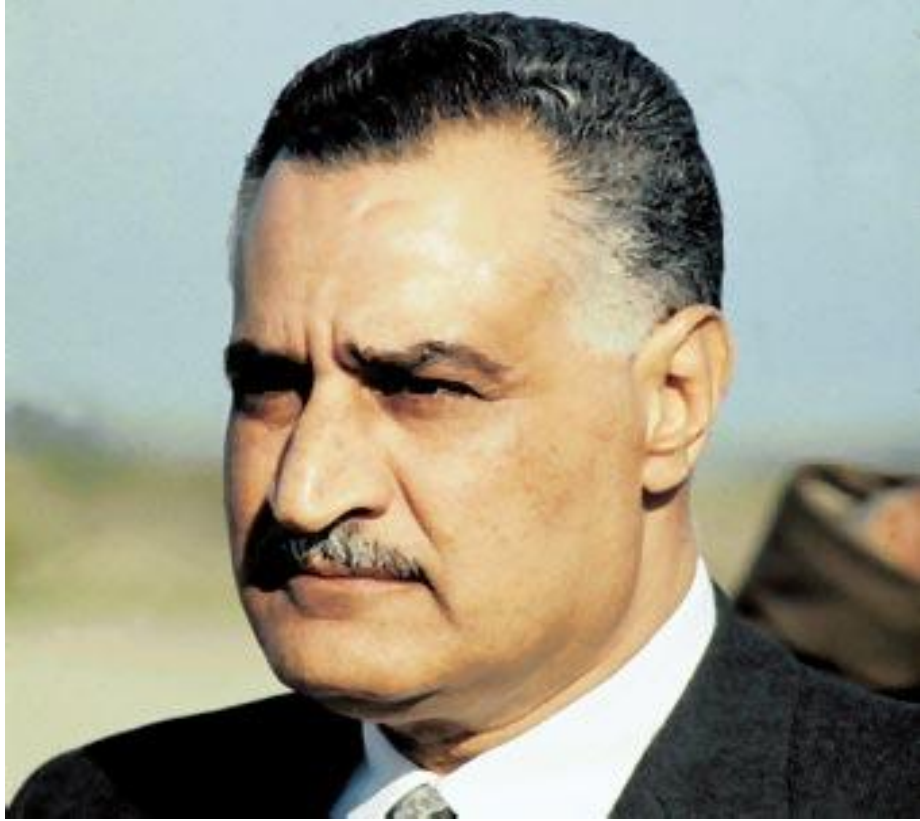
Foto de archivo del presidente egipcio Gamal Abdel Nasser.