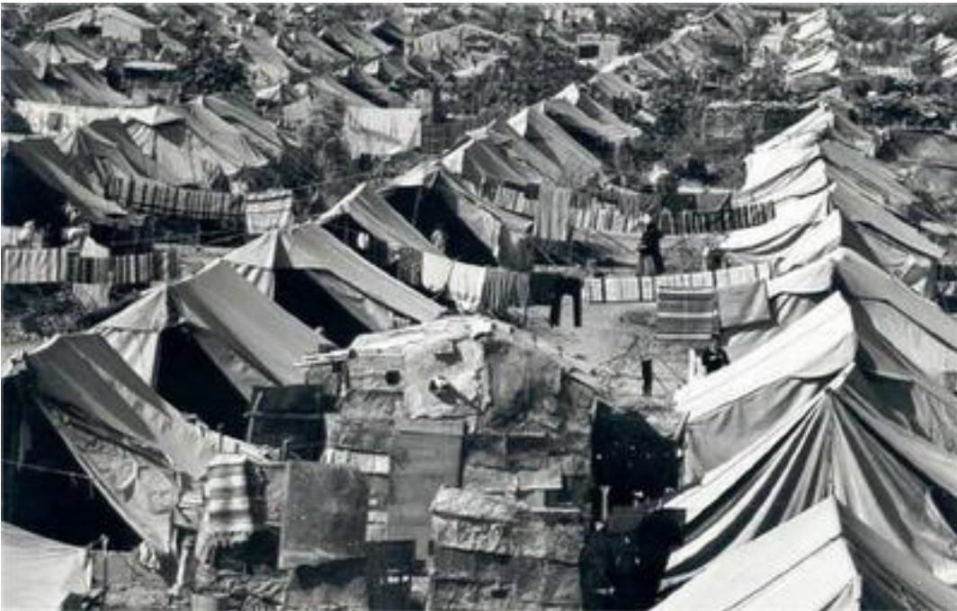
Fotografía de archivo de un campamento provisional de refugiados palestinos tras la "Harb al-Nakba" en 1948.