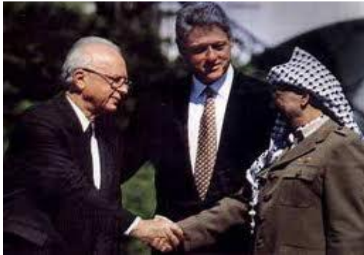
Isaac Rabín, Bill Clinton y Yasser Arafat, durante la firma de los Acuerdos de Oslo el 13 de septiembre de 1993.

Era momento de revelar el secreto y el 13 de septiembre de 1993, al medio día en los jardines de la Casa Blanca, ambos mandatarios se estrechaban la mano como señal de paz entre ambos pueblos, lamentablemente ésta no llegaría a concretarse por completo. 28