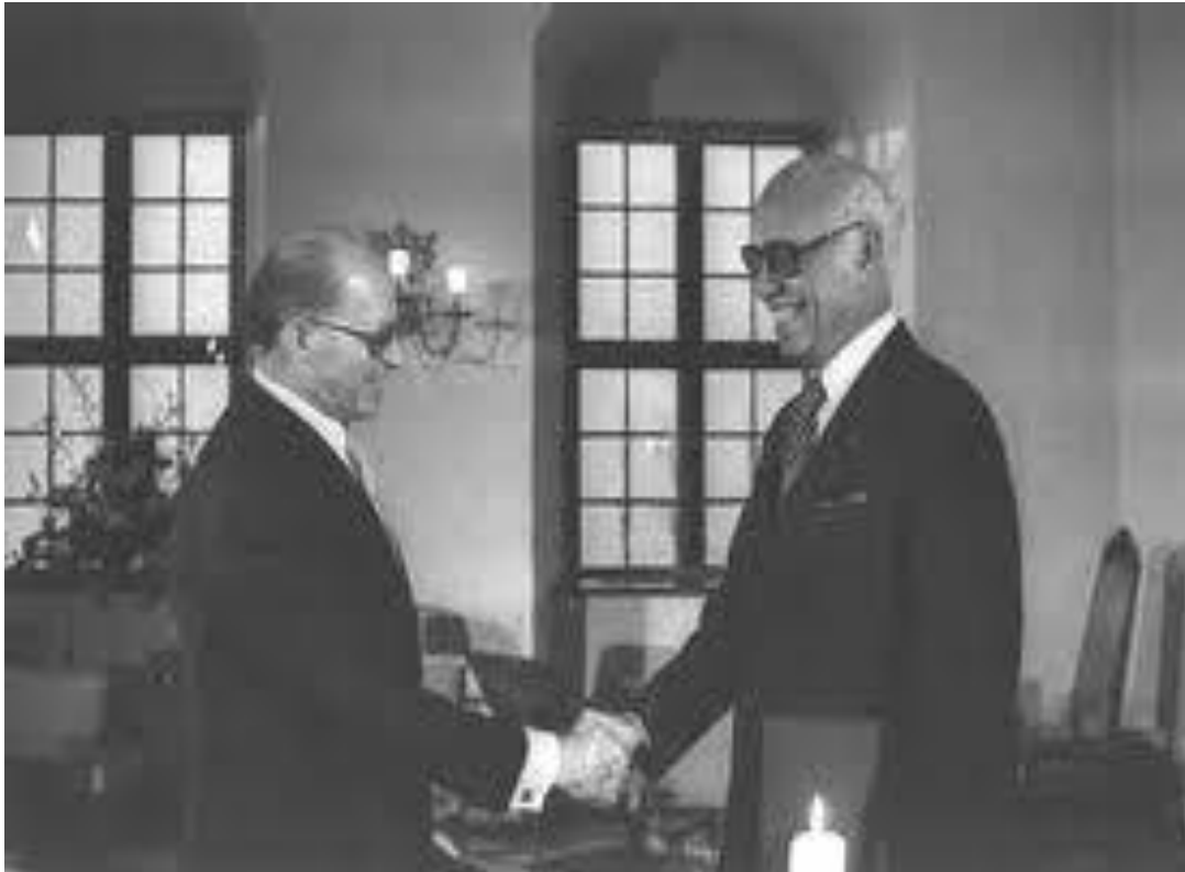
Menájem Beguín estrecha la mano de Anuar el-Sadat durante la entrega del Premio Nobel de la Paz en 1978.

Egipto vendió los intereses de Palestina lo que despertó el rechazo de los nasseristas, las mezquitas, las universidades y hasta de los Hermanos Musulmanes. 24 Es importante mencionar que Anuar el-Sadat y Menájem Beguín fueron reconocidos con el Premio Nobel de la Paz en 1978 por la labor en este acuerdo de paz.