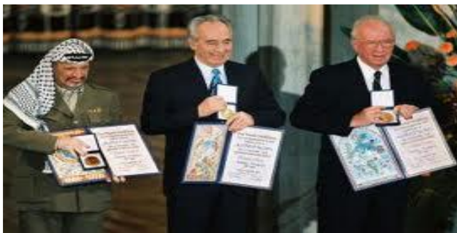
Yasser Arafat, Shimon Peres e Isaac Rabín durante la ceremonia de entrega del Premio Nobel de la Paz de 1994.

Resumiendo a un sólo punto su papel más destacado es continuar las conversaciones de paz con Yasser Arafat y la OLP hasta donde pudo. Es muy importante acotar que Yasser Arafat, Isaac Rabín y Shimon Peres recibieron en conjunto el Premio Nobel de la Paz en 1994 por su participación en el proceso de pacificación del Medio Oriente. 15