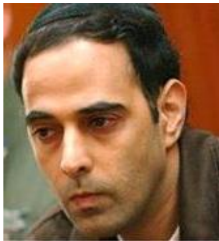
Foto de Archivo de Yigal Amir asesino de Isaac Rabín.