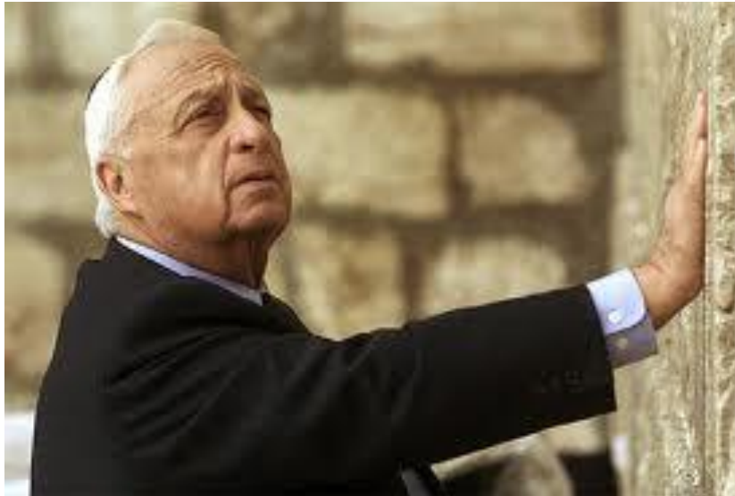
Ariel Sharon en el muro de las lamentaciones.

Finalmente Ariel Sharon cae enfermo el 4 de enero de 2006 a consecuencia de un derrame que le ocasiona la muerte cerebral y que lo mantiene en coma hasta nuestros días.