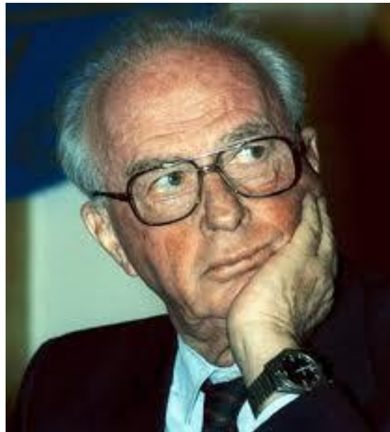
Foto de Archivo del primer ministro de Israel Isaac Rabín.

noviembre de 1995 a la cual asisten más de 100 mil asistentes y al término de la misma Yigal Amir, estudiante religioso ultra ortodoxo; dispara 3 balas al pecho de Isaac Rabín matando no sólo a un hombre, sino a la esperanza de paz de toda una nación. 11