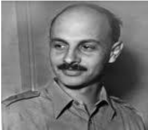
Yigael Yadin, arqueólogo, político y militar israelí ejecutor del Plan Dalet