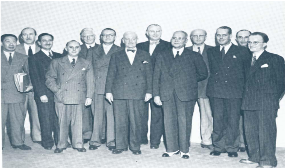
Foto de archivo de los integrantes de la UNSCOP