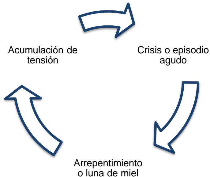
Figura 1. El ciclo de la violencia por Leonore Walker en 1979 (OPS, 2001).

En este esquema la violencia se presenta de forma cíclica, intercalando periodos de calma y afecto, sin embargo los episodios de crisis van tornándose más violentos y frecuentes, hasta llegar a situaciones que pueden poner en peligro la vida de las mujeres. Tal dinámica advierte del establecimiento de un vínculo de dependencia emocional y posesión difícil romper, tanto para el agresor como para la víctima.