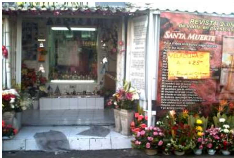
Entrada al altar de la Santa Muerte, ubicado en la calle de Alfarería 12 Tepito. En la fachada se observan algunas oraciones dedicadas a la Santa, flores y veladoras.