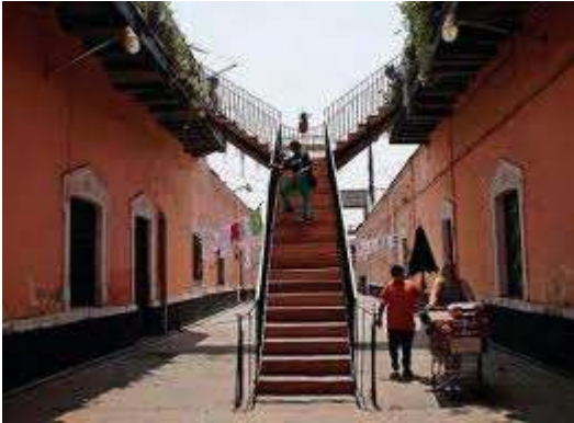
Así lucían las vecindades del barrio de Tepito, la clásica escalera en medio que conectaba con todas las viviendas.

El Centro Operacional de Vivienda y Poblamiento (COPEVI) le echó el ojo a Tepito para poner un programa piloto en 1968 para edificar 24 viviendas en la derrumbada vecindad “Las Catacumbas” ubicada en la cerrada de Díaz de León, este dichoso plan pretendía lograr un efecto demostrativo argumentando que una acción de renovación urbana debía y podía realizarse con la reubicación de la población residente en el mismo predio pero con mejores instalaciones.