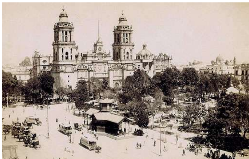
Esta fotografía se atribuye a Alfred Briquet. En ella se aprecian los tranvías de mulitas, los carruajes de alquiler, la estación terminal, la Catedral con su atrio arbolado, al igual que la Plaza de Armas, mejor conocida como Zócalo. Foto archivo http://www.mexicomaxico.org

tenían su terminal en pleno Zócalo y de allí se distribuían a distintos rumbos y barrios de la ciudad.