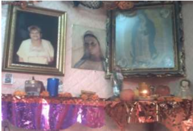
altar que se encuentra dentro de la accesoria de migas chucha, dedicado a Chucha y a la Virgen de Guadalupe.