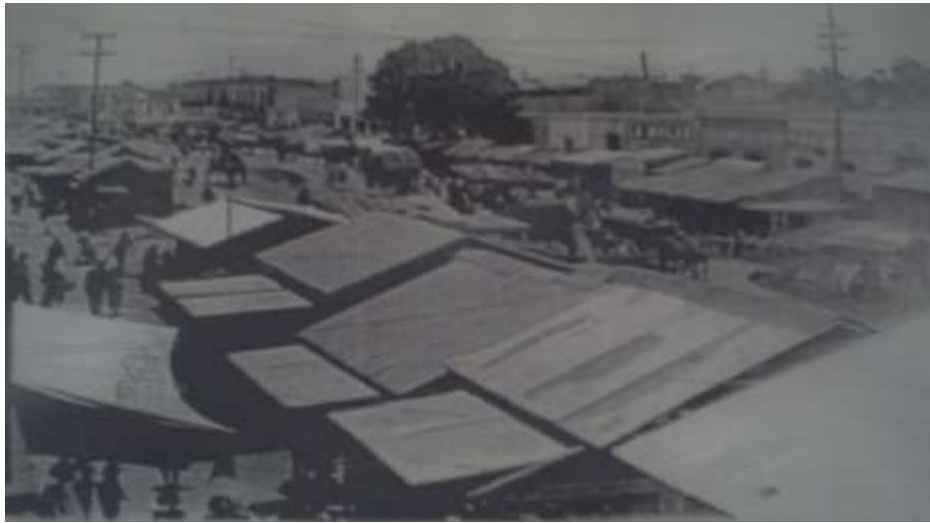
Calle Jesús Carranza, Tepito 1920.

Un aspecto importante que trata el capítulo, es el nuevo tótem religioso que tienen los tepiteños, la Santa Muerte. Siendo una nueva fe ha tenido mucho auge en los últimos 10 años, afirman que es muy milagrosa, que no hay reglas para rezar y también va de la mano con la católica, sin embargo, la iglesia no la admite como una nueva religión, aspecto trascendente que contradice a dos personas, una devota de la Santita y otra, la del padre de la iglesia de San Francisco de Asís.