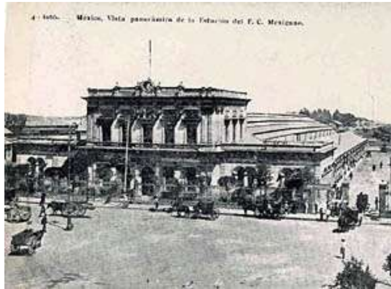
Estación del Ferrocarril de San Lázaro

negocio chueco; así, los mesones son espacios habitacionales tipo vecindad que se sumarían a las características físicas de este popular barrio.