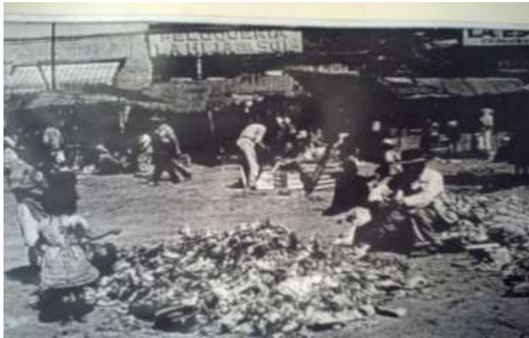
Tepito 1920, se observa la peluquería y a un lado la carnicería.

Estos puestos abarcaban negocios como carnicerías y peluquerías, se puede ver una toma de agua y un puesto en el que se vende fierro viejo y ropa usada. Este era el ambiente del tianguis de Tepito. Ahora solamente hay pasillos repletos de fierros viejos, cubiertos con lonas de colores. Los principales artículos que se ofertan son lentes, joyería y ropa de marcas como Channel, Giorgio Armani, Tous, Louis Vuitton y la que está más de moda, Ed Hardy; de ese barrio ya casi no queda nada, solo el bonito recuerdo en la mente de algunos que vieron muy de cerca los inicios del emblemático barrio bravo.