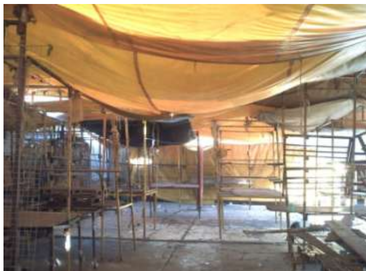
Explanada de la Iglesia de San Francisco Tepito 2011. Así luce lo que alguna vez fueron puestos de leña, ahora fierros y lonas que esconden basura y malvivientes.