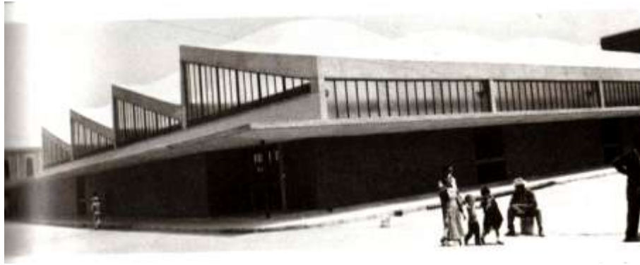
Mercado de zona 14, Tepito 1957. Foto, Trueblood Beatrice. "Pedro Ramírez Vázquez, Un architecte mexican", p. 36.