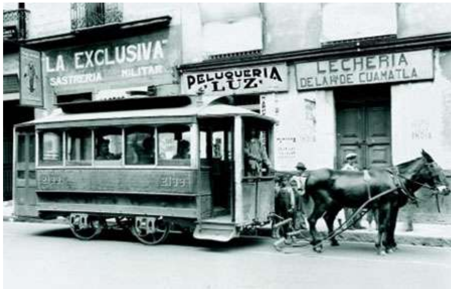
Tren de mulitas 2132.

En 1851 el tren de mulitas número 2132, transportaba a cientos de personas de un lugar a otro para llegar a su negocio, a comprar una que otra cháchara o llegar a su lugar de residencia. Este tren, cuyo recorrido diario iba desde la calle de Escalerillas, a la plazuela del Carmen, con el cabalgar lento y cansado de las mulitas, llegaba hasta Fray Bartolomé de las Casas, teniendo la calle de Granada como terminal.