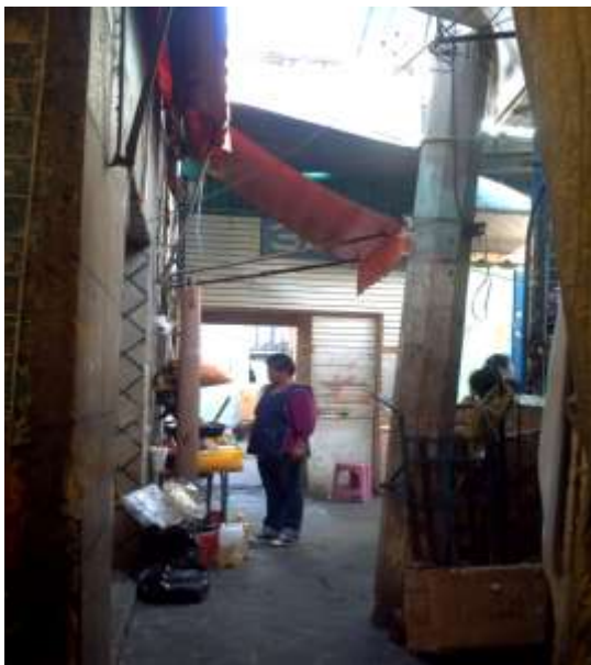
Callejón de la Rinconada 32 Tepito 2011. Antiguamente aquí comerciaban los ayateros hoy se comercian todo tipo de mercancías que van desde los lentes de moda hasta ropa interior de mujer además de tener en su interior catres y diablos de los comerciantes del tianguis.

La medida de orden duró poco tiempo, pues los mercados no alcanzaron a albergar a todos los que se dedicaban a esta actividad. Así, se empezó a dar autorización formal para que se instalaran de nuevo algunos de los llamados ayateros en la calle, básicamente en el Callejón de la Rinconada.