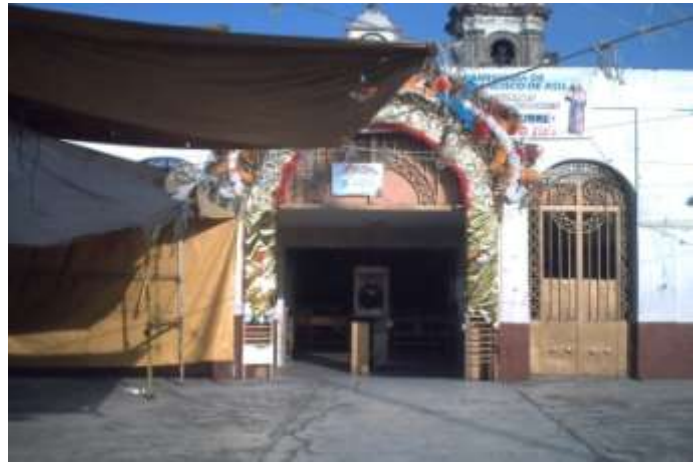
Actual Parroquia de San Francisco de Asís, Tepito 2011. Así luce la explanada de la Parroquia, llena de puestos y lonas que dificultan la entrada y la vista completa de la fachada de la iglesia.