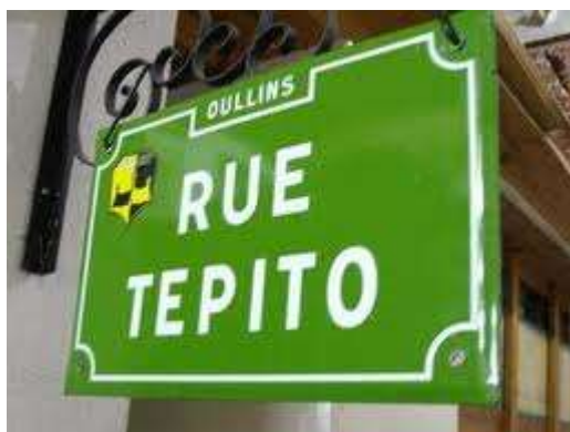
Placa original de la calle de Tepito en Francia. Actualmente la placa se encuentra en el Centro de Estudios Tepiteños (CETEPIS).