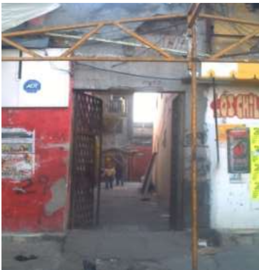
Vecindad ubicada en la calle de Bartolomé de las Casas, Tepito 2011. La fachada se encuentra en total deterioro, con los puestos que cubren gran parte de la entrada. Ésta es una de las vecindades que no fue renovada.