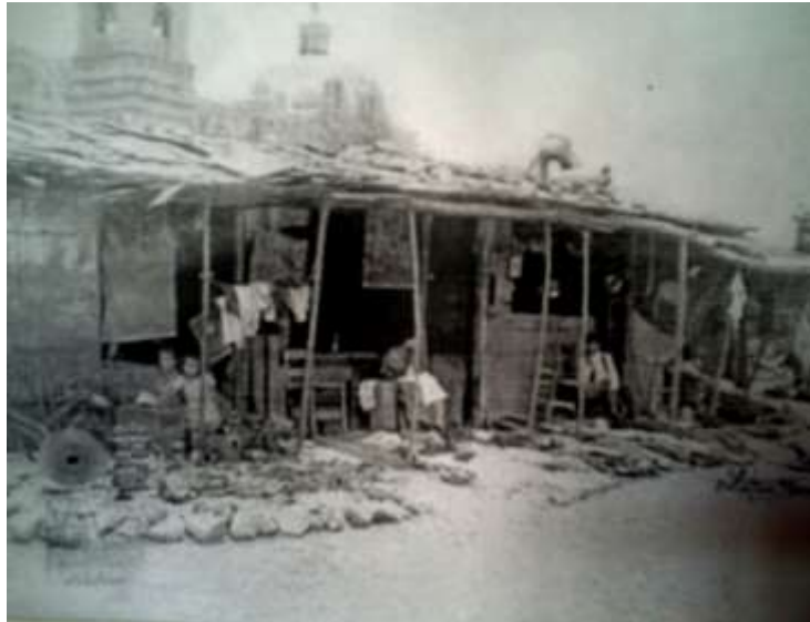
Tepito 1920, detalle de los puestos de madera, atrás del templo de San Francisco, la fotografía detalla un puesto de ropa usada y fierros viejos.