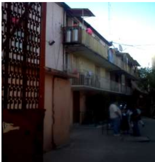
Interior de la vecindad, ubicada en la calle de Bartolomé de las Casas, así quedó la construcción después de la renovación en el barrio. Foto Angélica Hernández Iruiz, Tepito 2011.

comenzaron a asignarse en febrero de 1980, dando prioridad a los habitantes de vivienda transitoria, a los afectados por los ejes viales, y a inquilinos de los inmuebles adquiridos por FIDEURBE que estaban por demolerse. La cuarta etapa del Plan se inicio en 1981 con la construcción de 95 departamentos.