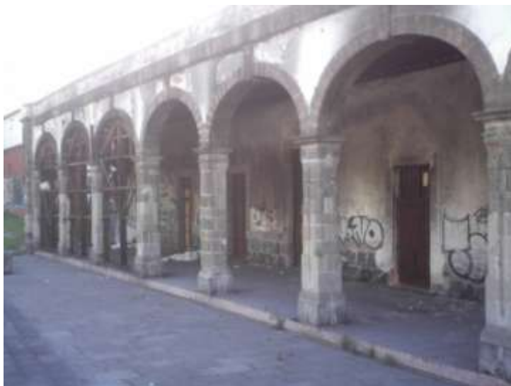
Así luce actualmente la estación del ferrocarril de San Lázaro, solo conserva su estructura en los últimos arcos. Foto Angélica Hernández Iruiz, México 2011.