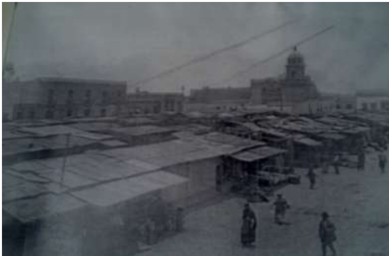
Bartolomé de las Casas, Tepito 1920. Al fondo se observa la parroquia de San Francisco.

En los alrededores del Templo de San Francisco, se encuentra la Plaza de Fray Bartolomé, caminar entre fierros viejos, montones de basura y diablos con cargas de todo tipo hacen difícil la travesía hacia la morada de San Francisco, el patrono y protector del barrio. Ese espacio entre las filas de vecindades y puestos no tiene el mismo significado para todos, para algunos es una área dónde caminar, para otros el lugar preferido en donde comprar artículos de moda y chacharear, así para muchos más fue el lugar que les dio de comer durante muchos años y la forma de ganarse la vida de forma honrada.