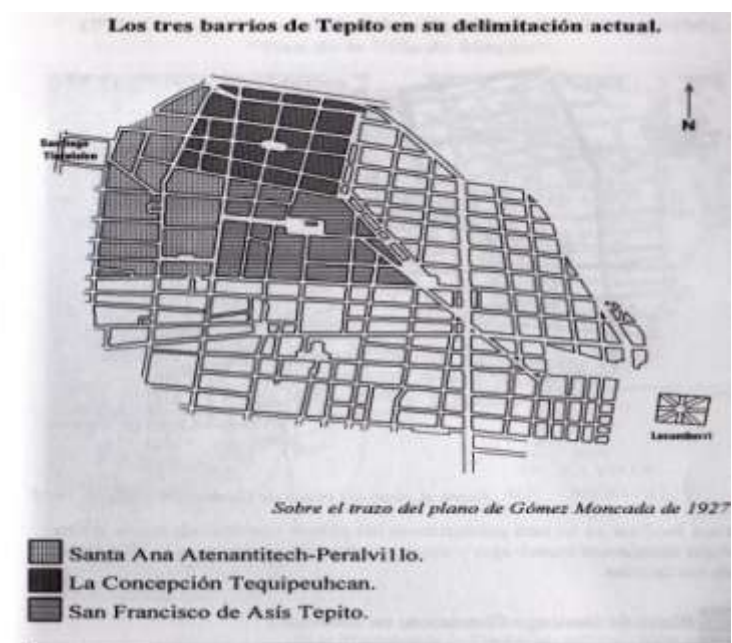
Mapa archivo, Tepito: del antiguo barrio de indios al arrabal. 1868-1929, historia de una urbanización inacabada, México, Ediciones Uníos, 2003. (Sábado Distrito Federal)