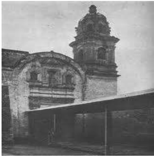
Parroquia de San Francisco de Asís, Tepito, la fotografía data de 1890 aproximadamente.