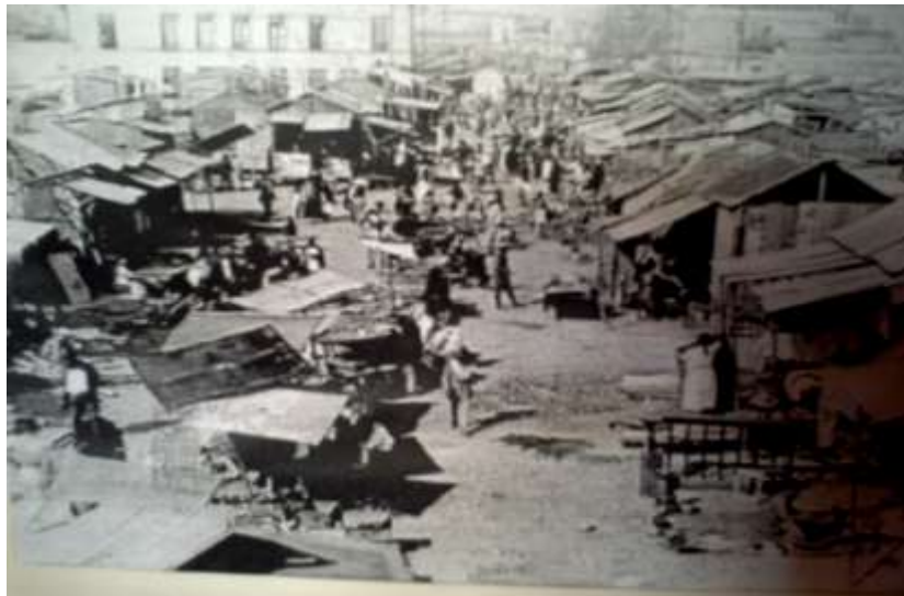
Tepito 1920, Fray Bartolomé de las Casas y Toltecas fueron las primeras calles comerciales en el barrio.

Ese baratillo fue símbolo de moneda y fortuna, ese lujo que humilló por muchos años a miles de plebeyos, hoy estaba a sus pies, formando hileras de ropa, zapatos del rojo más intenso, pulseras con un brillo consumido pero que con una buena pulida quedarían como nuevas, bolsa y guantes justo del mismo color del vestido que habías comprado en el puesto contiguo, todo para hacerte sentir como una verdadera persona de abolengo, aunque sea para olvidarte por un momento de la desigualdad económica que ya existía en la ciudad desde aquellos años.