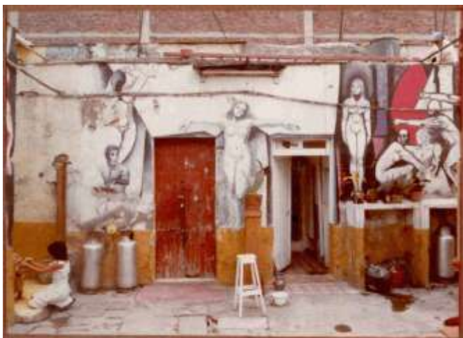
Interior de la vecindad de Florida 17, Tepito 1980. Foto http://www.barriodetepito.com.mx

Este proyecto sirvió como contrapuesta al Plan Tepito, pero nunca se puso en práctica por que el gobierno no lo apoyó pues se creía que si los tepiteños eran capaces de crear un proyecto de esa magnitud, entonces que ellos lo pusieran en marcha.