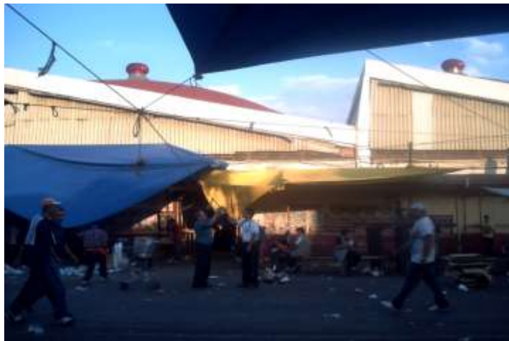
Mercado de zona 14 en total deterioro, basura en las calles, lonas y catres encadenados a las paredes del mercado. Tepito 2010.