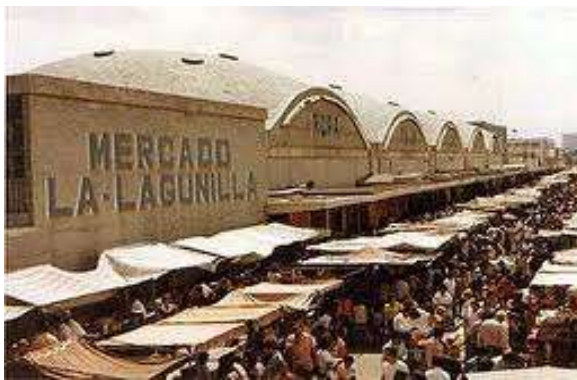
Mercado La Lagunilla 1970, con sus miles de puestos, que van desde las antigüedades hasta toda clase de objetos para complementar tu atuendo.

Este barrio popular está sobre lo que era una pequeña laguna que ahí se encontraba desde la época prehispánica y que albergó un desembarcadero estratégicamente cercano al tianguis de Tlatelolco. Con el crecimiento de la ciudad y la consecuente desecación de la zona lacustre, de La Lagunilla sólo queda la reminiscencia de su nombre.