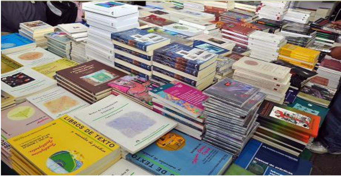
Oferta editorial de la UAM-I, Foto de Ricardo Rivera Cortes.