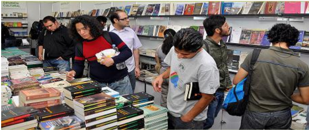
Asistentes a la Primera Feria del Libro Universitario UAM-I 2011, Foto de Ricardo Rivera Cortes.