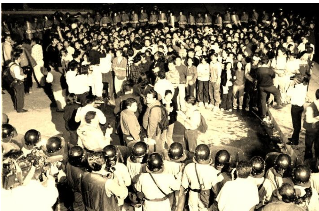
Foto 13. 1 de febrero de 2000: Martes negro de la prepa 3. La policía militar cerca a cientos de huelguistas, mientras a las afueras decenas de padres de familia y vecinos protestan por la intervención.

El plantel quedó custodiado por la PFP y los 245 estudiantes detenidos fueron conducidos a la PGR de “Camarones”, donde se les impidió el contacto con abogados de su confianza, y se les impuso defensores de oficio que se negaron a ofrecer cualquier probanza en su beneficio. Al finalizar el proceso, se les imputaron los delitos de terrorismo, motín, sabotaje, robo específico, daño en propiedad ajena, asociación delictuosa, lesiones y despojo, entre otras. Una vez declarado su auto de formal prisión, la mayoría fue turnada al Reclusorio Norte, mientras que los menores de edad fueron remitidos a las oficinas del Tutelar para Menores. Entre los universitarios trasladados al Reclusorio Norte estaba también Leticia Contreras ( La Jagger ) a quien la Rectoría acusó de haber orquestado la violencia.