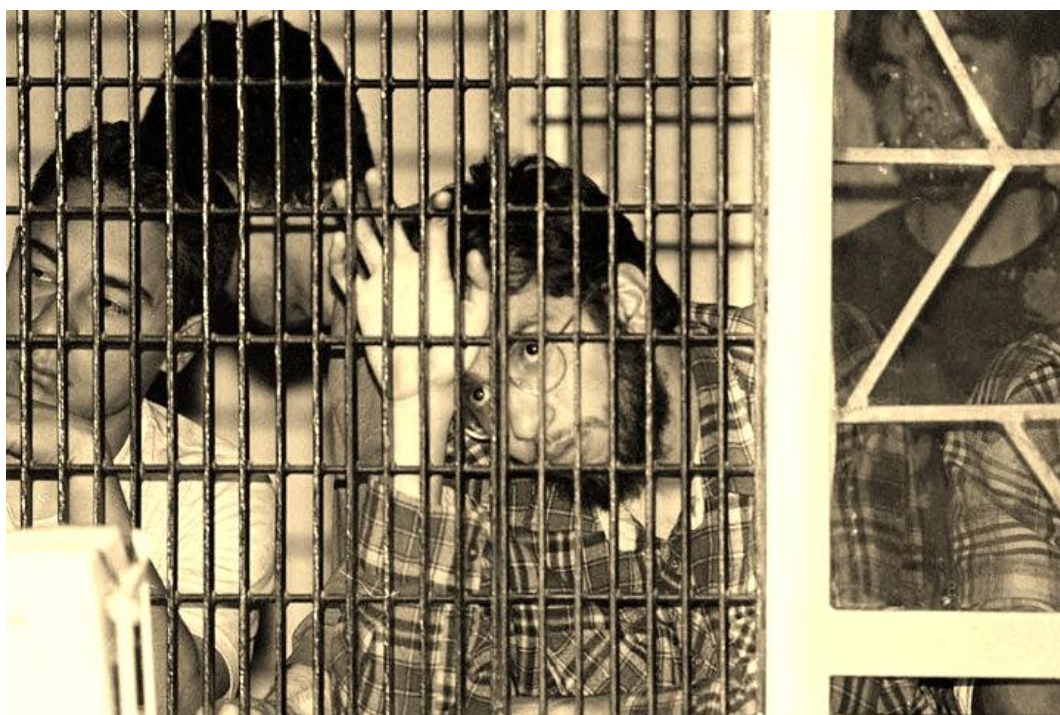
Foto 15. Estudiantes detenidos durante los acontecimientos de la preparatoria 3, rinden declaración ante los juzgados federales ubicados en el Reclusorio Norte. En total fueron encarcelados 998 huelguistas, la mayoría de ellos, procesados por los delitos de despojo, robo calificado, lesiones, motín y terrorismo.

Ahora bien, sin que el propósito del presente trabajo sea el análisis exhaustivo de las relaciones de poder en las cúpulas de la Universidad, debemos hacer una precisión sin la cual no puede entenderse la crisis de la poshuelga: al tiempo que De la Fuente purgaba a los funcionarios tecnócratas de la antigua administración, la brecha entre él y el gobierno federal se hacía más grande. Presionado por la nueva correlación de fuerzas, dentro de la cual el PRD Universidad desempeñaba un papel decisivo, el rector intentaba en la medida de sus posibilidades, distender el clima de enfrentamiento en las escuelas; sin embargo, el gobierno federal, actuaba por su propia cuenta, y en ocasiones, en contra de la misma voluntad del rector.