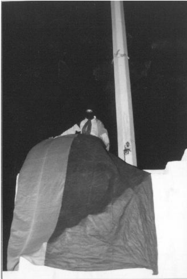
Foto 4. 20 de abril de 1999: Un joven iza una bandera rojinegra en la explanada de la Rectoría, mientras en el auditorio Che Guevara miles de estudiantes constituyen el Consejo General de Huelga.

en la “Preparatoria Pascual Ortiz” de la UMSNH; etcétera. 205