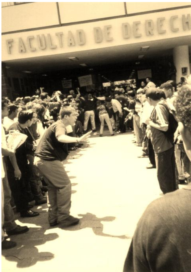
Foto 3. 21 de abril de 1999: Concentración de huelguistas a las afueras de la Facultad de Derecho. Por más de 48 horas estudiantes a favor de la huelga y autoridades universitarias, mantuvieron una tensa disputa por el control de las instalaciones.

país. En la memoria de la izquierda mexicana pesaban aún las sangrientas secuelas de la lucha contra el fraude electoral de 1988 y la derrota que en 1995 había sufrido el Sindicato Único de Trabajadores de Ruta 100 (SUTAUR-100) cuando todo su Comité Ejecutivo había sido encarcelado. Pero hubo de