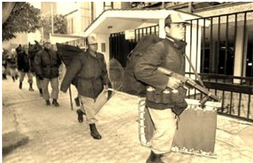
Foto 12. Elementos armados de la PFP toman control del CUEC el 26 de enero de 2000, luego de que estudiantes adheridos a la CDE levantaran la huelga.

Horas después de la entrega formal de la ENEO y el CUEC, la Rectoría solicitó al gobierno federal la intervención de comandos de la Policía Federal Preventiva (PFP), armados con gas lacrimógeno bajo el argumento de “verificar que no existan explosivos”; sin embargo, su intervención quedó evidenciada como una maniobra para impedir que el CGH las retomara. De la Fuente se presentó a las escuelas ocupadas por la policía en compañía de Federico Reyes Heróles, René Drucker y Luis de la Barrera y declaró: “El equipo está intacto, y yo creo que ésta es una muestra de cómo el sector democrático del CGH, que en una asamblea decidió hoy entregar las instalaciones, también supo cuidarlas.” 378