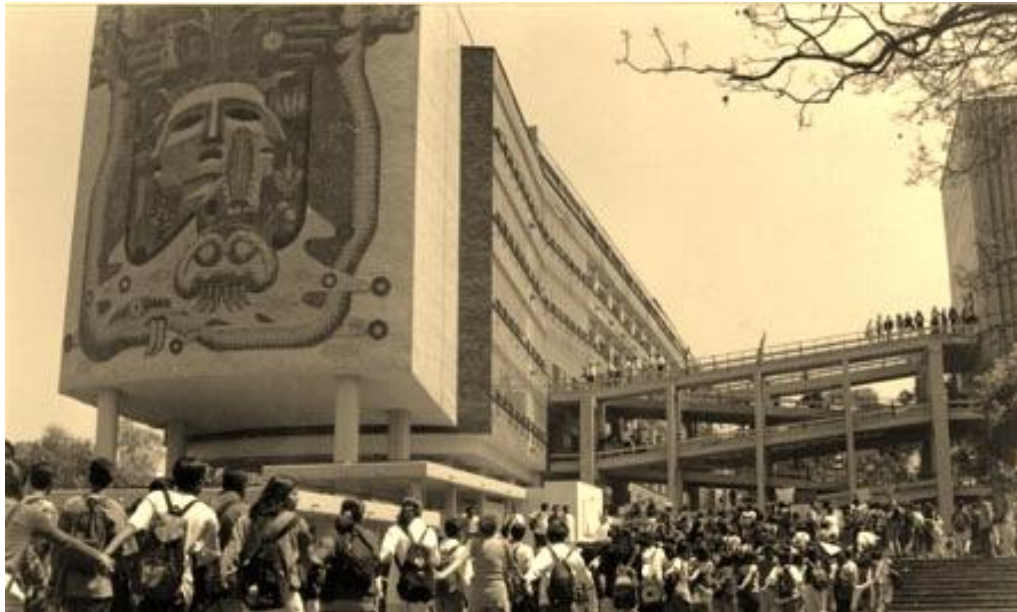
Foto 5. Toma de la Facultad de Medicina. Con la Universidad en huelga, el CGH se convirtió en un órgano de dirección muy fuerte, masivo, con influencia entre decenas de miles de estudiantes, y cuyas resoluciones comenzaron a tener gran resonancia a escala nacional.

movimiento mucho más cohesionado y con mucho mayor unidad que lo que demostró el CGH”. 211