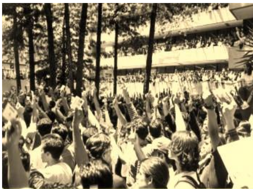
Foto 2. En la Facultad de Ingeniería, miles de estudiantes votan por el estallido de la huelga.

En similitud con otras facultades, en Políticas se habían desarrollado dos instancias para poner en marcha el movimiento estudiantil: la organización de un CGR, que era algo por lo que tenía afinidad el CEU, y por otra parte el mecanismo de asambleas directas. En los hechos éstas últimas hubieron de ser las que contaron con mayor legitimidad y las que terminaron definiendo la huelga. A unos cuantos días de que llegara el 20 de abril, casi mil estudiantes por cada uno de los turnos votaron abrumadoramente a favor del estallido. Sin embargo las diferencias generadas desde este momento dieron lugar a dos polos antagónicos: uno muy radicalizado y el otro renuente a aceptar los acuerdos de las asambleas.