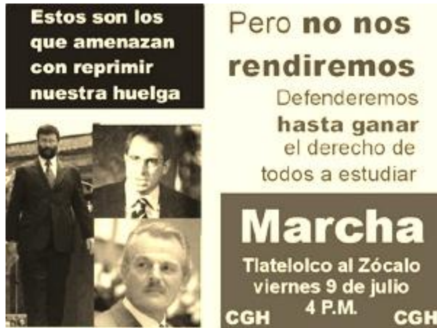
Foto 7. A principios de julio de 1999 el gobierno federal alistó los preparativos técnicos y políticos para romper la huelga mediante el uso de la fuerza pública. La desenfrenada campaña de propaganda desarrollada durante estos días por miles de jóvenes en las calles, frustraron el objetivo estatal.

Además, cuando las bases del movimiento rechazaron de forma aplastante la propuesta de “cuotas voluntarias” del 7 de junio y quedó evidenciado el papel de esquirolaje que desde abril habían sostenido sus dirigentes, la estructura de esta coalición entró en crisis y en sus filas aparecieron fisuras. El mismo Fernando Belaunzarán en su Balance a 10 años atestigua: “... diferentes tribus perredistas vieron la ocasión para desplazar a quienes consideraban sus adversarios internos y tenían su principal fuerza en la UNAM, así que se les hizo fácil hacer causa común con “la ultra” para lograrlo sin caer en cuenta que después ya no podrían tomar la conducción del movimiento y darle un rumbo diferente...”. 243 De haber preservado su estructura organizativa en la UNAM, el CEU histórico habría podido disputar desde el inicio la dirección del movimiento estudiantil, pero tan tarde hubo de articular sus células, que los acontecimientos lo colocaron en una posición de franca desventaja.