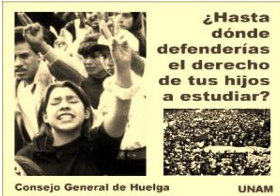
Foto 8. Uno de los carteles más emblemáticos del CGH. Por cada mes de huelga, la Comisión de Prensa y Propaganda emitió un millón de volantes y alrededor de 250 mil carteles.

La propuesta de los ocho profesores eméritos no resolvía las demandas del movimiento estudiantil, por el contrario, se trataba de un exhorto para que los estudiantes desistieran de los puntos centrales de sus peticiones en aras del “restablecimiento de la vida académica y el desarrollo de las funciones sustantivas de la universidad”, un llamado no muy distinto al que los empresarios y el Estado suelen hacer a los trabajadores de las industrias estratégicas cuando van a la huelga: “en aras del bien común”, “en pos del desarrollo nacional”.