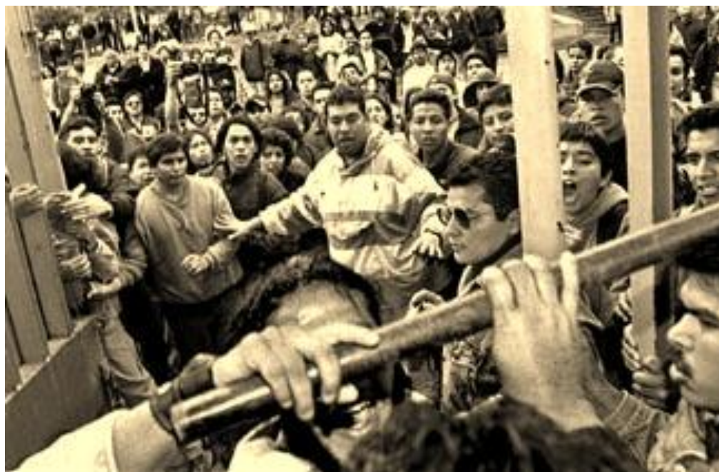
Foto 9. 27 de octubre de 1999: Integrantes del CGH recuperan la ENEP Acatlán luego de que funcionarios de la Universidad, miembros del CEU histórico y antiparistas, irrumpieran en el plantel e intentaran entregar las instalaciones a la policía.

esos días Alejandro Echevarría ( El Mosh ) y Ricardo Martínez, ambos activistas de peso en la FCPyS, fueron secuestrados por agentes federales; estudiantes de Ciencias habían sido amenazados de muerte y golpeados por individuos vestidos de civil; estudiantes de la ENTS habían sido tiroteados con armas de fuego por un grupo de sujetos en el circuito interior de Ciudad Universitaria; la ENEP Acatlán había sido tomada unas horas por un grupo de porros y policías del Estado de México; a centenas de profesores se les habían retenido sus cheques por negarse a participar en las actividades extramuros; y por si no fuera poco, el ahora precandidato priísta a la presidencia de la República, Francisco Labastida Ochoa, señalaba que el Ejército Popular Revolucionario (EPR) estaba suministrando armas al CGH, y que éstas se encontraban escondidas en el campus de CU. “En el movimiento –atestigua Higinio Muñoz- se expresó un sentimiento muy marcado entre muchos compañeros, de reaccionar con mucha virulencia frente a los ataques al movimiento estudiantil.” 292