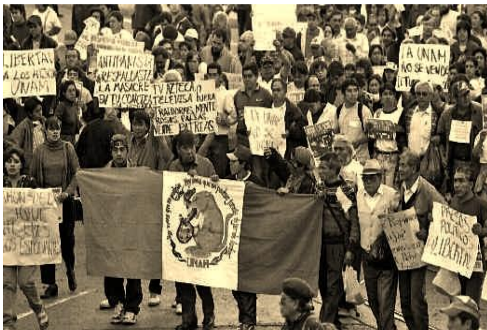
Foto 14. 9 de febrero de 2000: En una marcha que va del Ángel de la Independencia al Zócalo, más de cien mil personas repudian el asalto policiaco militar a la UNAM y exigen la liberación de los estudiantes presos.

Al regresar a sus escuelas, los estudiantes encontraron desarticulados diversos espacios de organización histórica, dentro de los cuales, el más emblemático había sido el auditorio Che Guevara de Filosofía y Letras: que hubo de ser bloqueado, su mural exterior borrado, y su nombre reemplazado por el del pensador positivista Justo Sierra . En la Facultad de Economía, el histórico cubículo 104, fue completamente desmembrado y dividido por un muro de concreto; en Ciencias, los locales del Comité de Huelga fueron completamente demolidos; en el bachillerato y las escuelas periféricas, los espacios de organización fueron adecuados como bodegas o salones de clase, etcétera. Pensando que el CGH no levantaría más la cabeza, la burocracia se había dedicado durante los nueve días de ocupación policiaca, a remodelar las instalaciones y a desaparecer todo vestigio de la huelga, pero lejos de atemorizarse, la reacción de los ex huelguistas fue aún más embravecida.