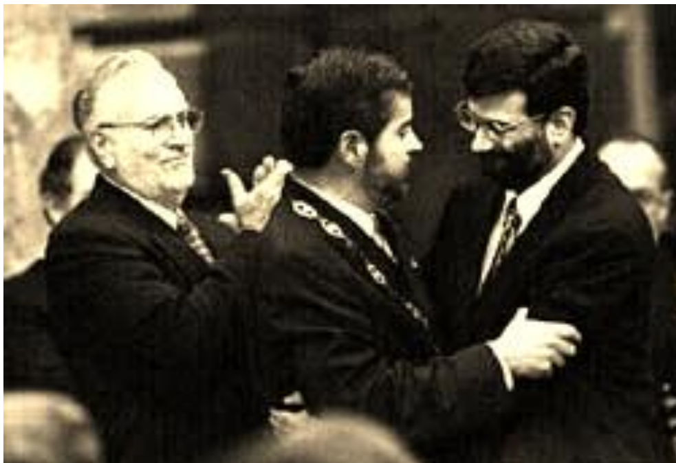
Foto 10. Toma de posesión de Juan Ramón de la Fuente como nuevo rector de la UNAM el 19 de noviembre de 1999. La caída de Barnés marcó el fin de la hegemonía de la derecha universitaria y el reacomodo de los grupos de poder de la institución.

Una vez que el CGH se dio por enterado de la convocatoria, acordó iniciar las pláticas lo más pronto posible, y así, la primera reunión entre la nueva administración y el consejo de huelga hubo de celebrarse el 29 noviembre en el Palacio de Minería. Lo primero que hizo la Comisión del CGH fue exigir a De la Fuente la cancelación de todas las actas universitarias y penales que habían sido levantadas contra los huelguistas como muestra de querer resolver el conflicto. La Comisión de la Rectoría por su parte, hizo una propuesta de diálogo al CGH que pedía se estudiara con detenimiento, y que en términos generales consistía en que las pláticas se centraran en los seis puntos del pliego petitorio, en la devolución de las instalaciones y en el inicio inmediato de la vida académica, advirtiendo que todos los acuerdos que emanaran del diálogo serían enviados al Consejo Universitario para su análisis y aprobación , punto que de entrada, suscitaba la desconfianza de los estudiantes.