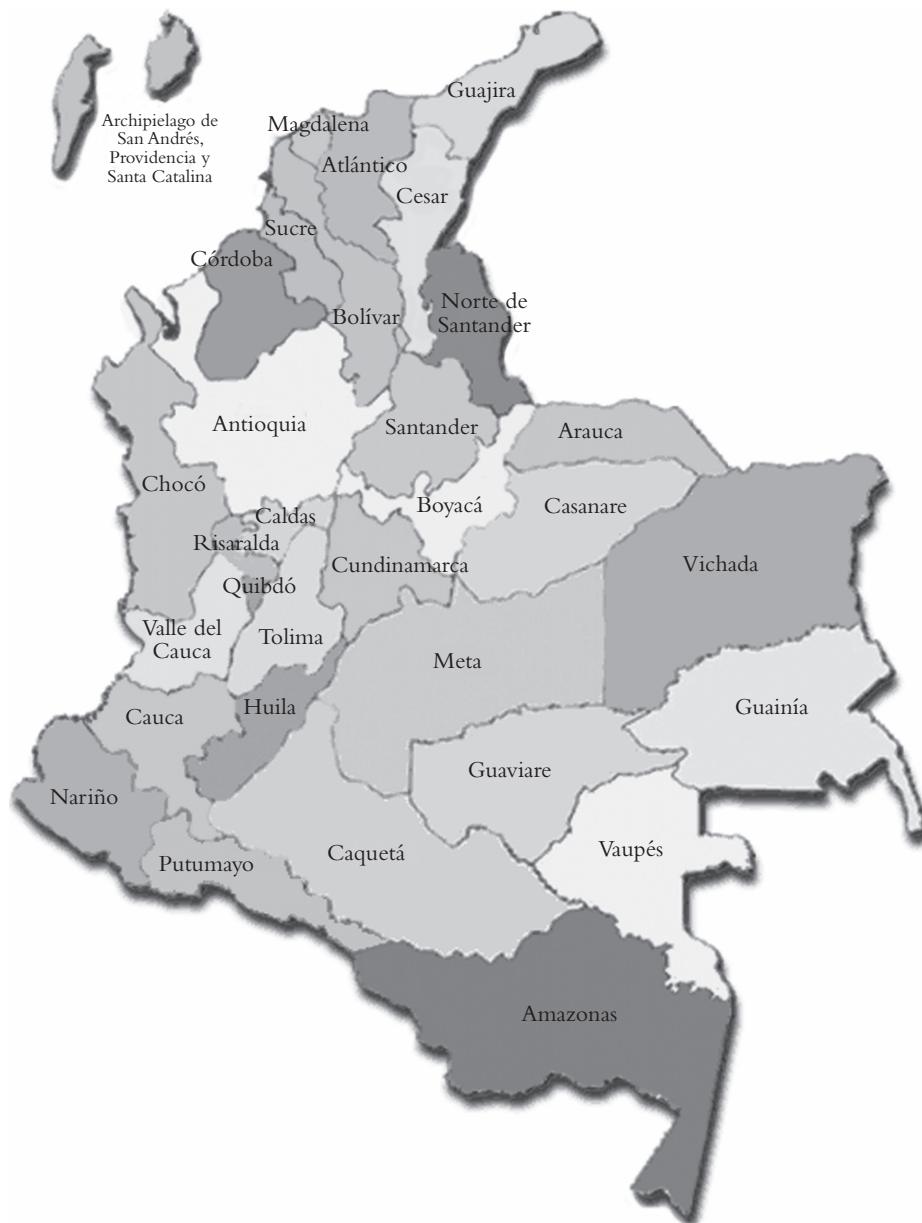
Mapa 1. División política de Colombia.