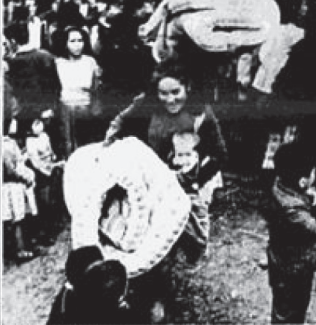
EL DESASTRE DE LAS INUNDACIONES EN LA ZONA DEL NOROCCIDENTE DE COLOMBIA. Seis mil damnificados por inundaciones.