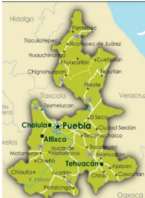
Mapa del Estado de Puebla

número a municipios como Ecatepec en el Estado de México y la delegación Iztapalapa en el Distrito Federal, que ocupan el segundo y tercer lugar respectivamente.