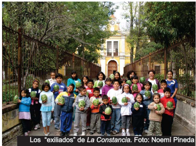
Los “exiliados” de La Constancia .

El entusiasmo de las organizadoras es tal que afirman que para el “taller de calabazas con los niños” (el cuál se hace el último domingo de octubre, aunque el año pasado ya no pudieron realizarlo): nosotros vamos a traer el chilacayote a los pueblos y los lavamos . Los pequeños son el principal motor que mueve a la asociación cuando ellos mismos solicitan: hagan unos talleres, queremos ir a La Constancia , expresa Noemí Pineda.