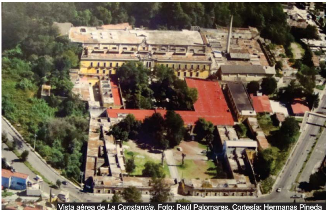
Vista aérea de La Constancia.