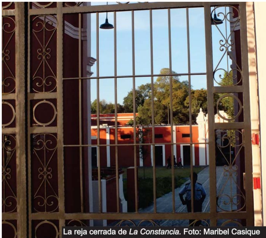
La reja cerrada de La Constancia .

Esa reja no había estado ahí, la reja te dice 'espérate, alto, a dónde vas!'. Es muy