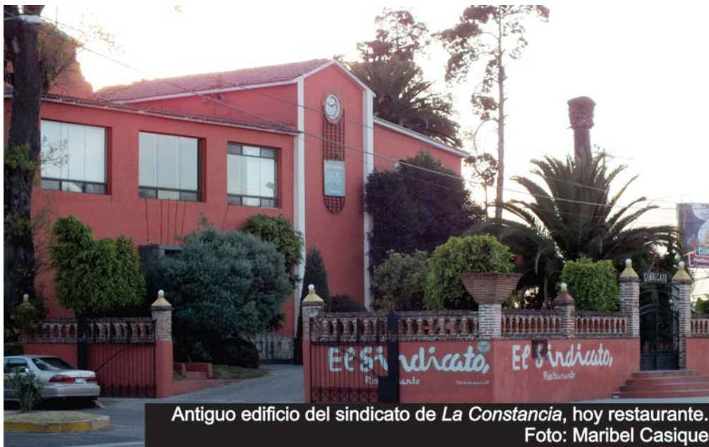
Antiguo edificio del sindicato de La Constancia , hoy restaurante.

— Nada más era de levantar la mano y los escrutadores contaban para que no salieran mal las cuentas y ya les decíamos ‘los que ganen, pagan la caja’, que era cartones de cerveza, botellas, alcohol hasta por donde más.