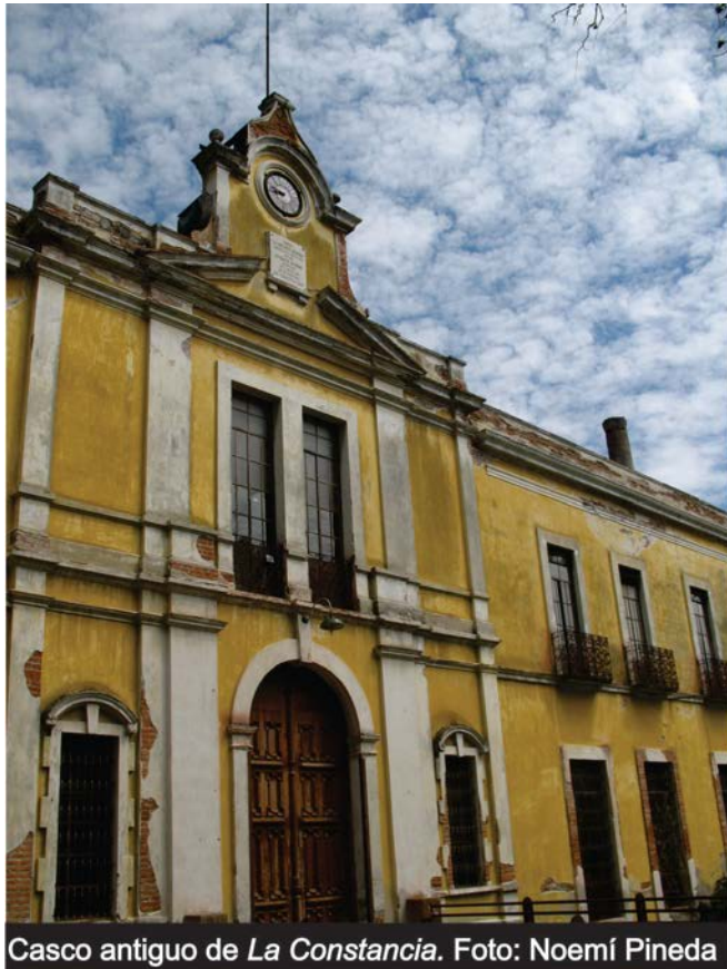
Casco antiguo de La Constanza.