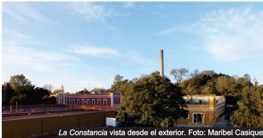
La Constancia vista desde el exterior.

Quienes fueron parte de La Constancia en poco detallan su lugar de trabajo, tal vez porque la evocación de nuestros lugares nos lleva de inmediato a la experiencia del recuerdo. ¿De qué color era el salón, la bodega, las paredes de tu vivienda? ¿A qué olían en los días de lluvia, en los días de calor o en días fríos? ¿Con qué te quitabas la grasa de las manos o cómo se envolvía la tela en cada conera? En las reuniones de “ex constanteros” no se hacen esas preguntas. En ellas, recuerdan, añoran, miran hacia atrás, a los años prósperos por la producción, por la juventud, por las celebraciones, por el sindicato.