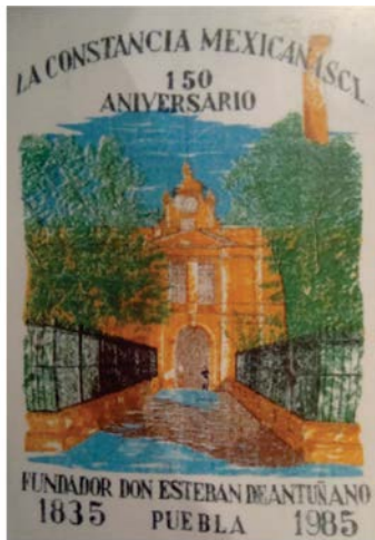
Toalla conmemorativa de La Constancia.