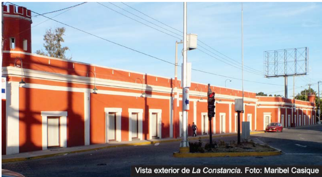
Vista exterior de La Constancia.