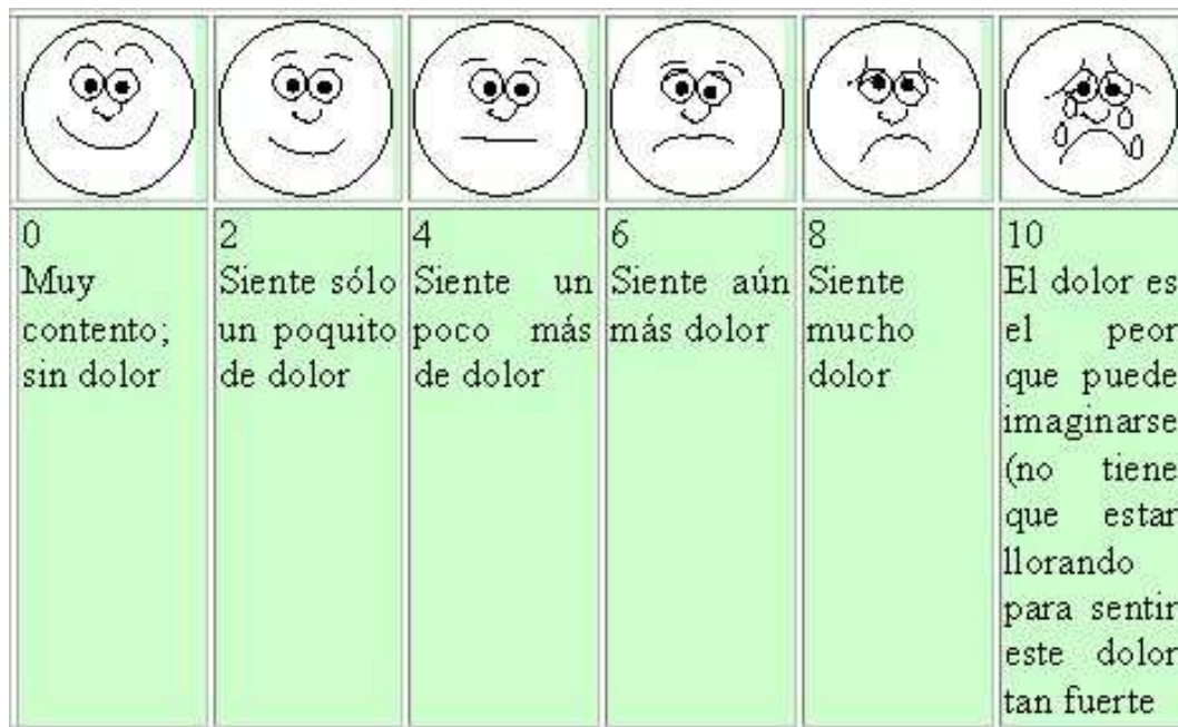
Fig. 2. Escala Visual Análoga del Dolor

La ventaja de añadir un analgésico no opioide por vía sistémica estriba no solo en aumentar la eficacia analgésica, sino que, al permitir disminuir las dosis de opioides necesarias, se reduce la incidencia de los efectos secundarios relacionados con estos (2).