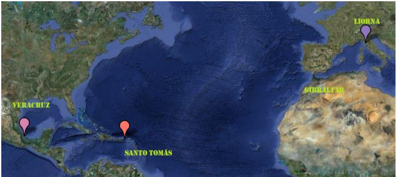
Recorrido del vapor Atlántico 42

barco. 41 Su llegada generó una expectación enorme en el puerto, donde una gran cantidad de gente se reunió para verlos llegar.