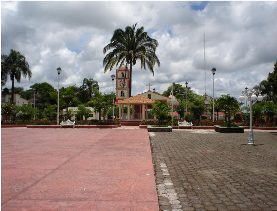
El centro de la colonia Manuel González en julio de 2010. 55