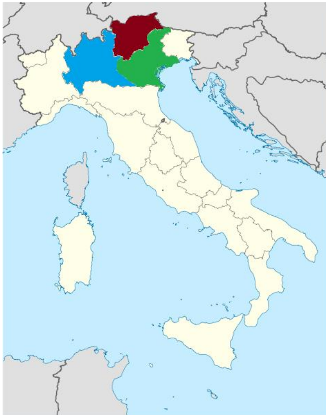
Provincias de origen de los colonos 48

se anexó en 1919, tras la firma del Tratado de San Germán-en-Laye al concluir la Primera Guerra Mundial. 46 En esas tres provincias las causas de la emigración antes señaladas se encuentran presentes. Justamente al norte de Italia se había dado el más importante proceso de industrialización y en los campos existía el fenómeno de la apropiación de la tierra; de hecho, hasta la fecha, los descendientes de los fundadores vénetos de la colonia mantienen el recuerdo de una condesa dueña de gran parte de las tierras en Belluno. 47 Asimismo, hubo situaciones particulares en regiones más pequeñas, que llevaron a las personas que hicieron el viaje a tomar la decisión de mudarse a México.