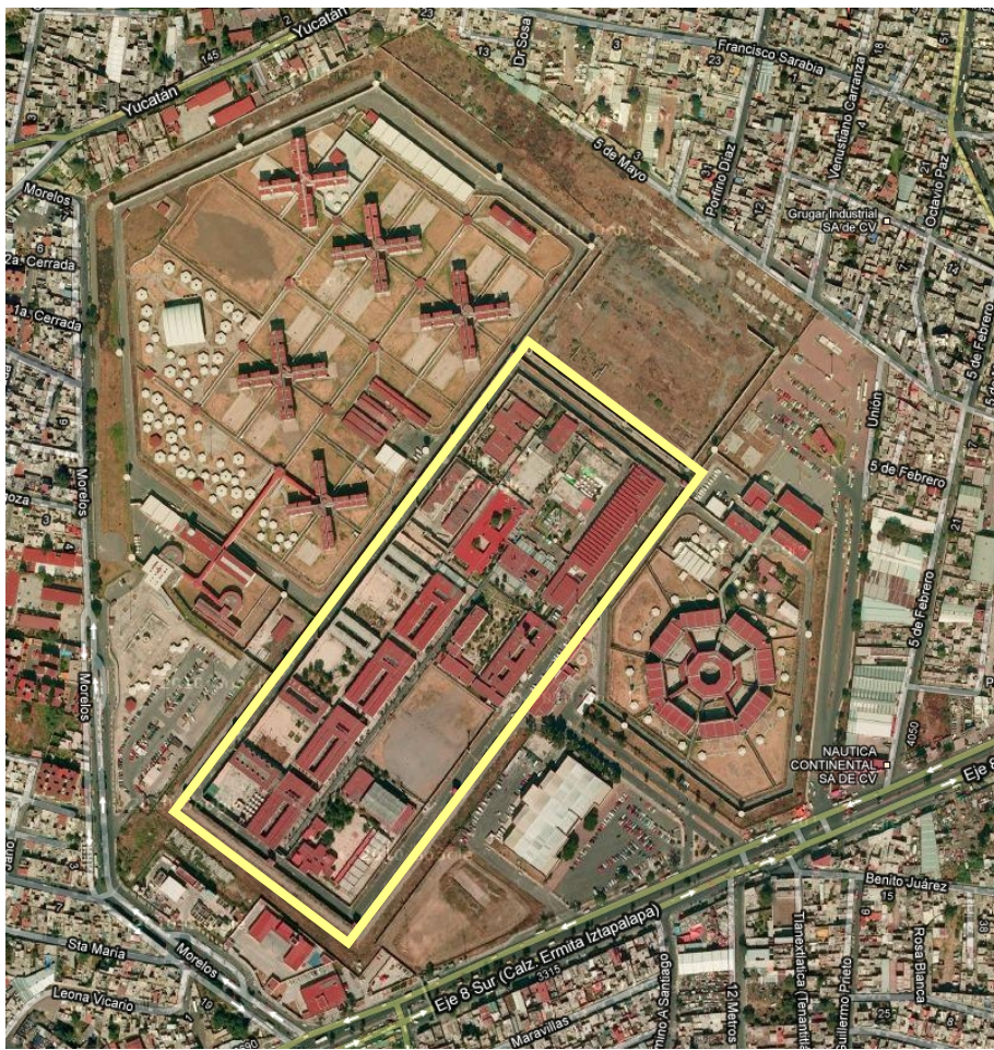
Fig. 1 Ubicación del Centro de Readaptación Social Masculino de Santa Martha Acatitla

El centro inicia su operación dando continuidad al Programa de Rescate y Reinserción de Jóvenes Primodelincuentes, con una población total de 672 internos provenientes de los Reclusorios Preventivos Varoniles Oriente, Norte y Sur, incluyendo jóvenes con sentencias menores de 10 años y con delitos patrimoniales.