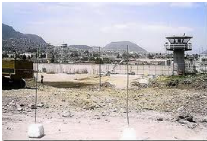
Fig. 2 Vista frontal del Centro de Readaptación Social Masculino de Santa Martha Acatitla

Los internos reciben la visita de familiares y amigos del exterior cuatro días por semana.