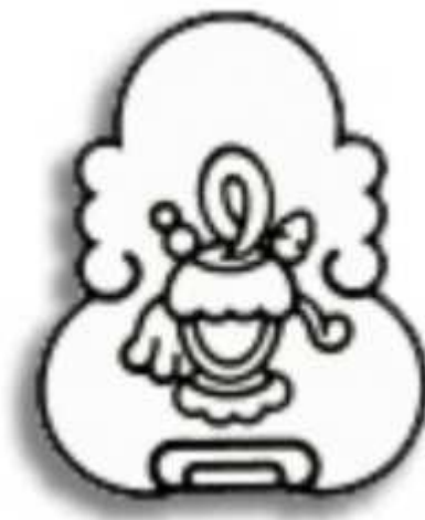
Figura 1.1. 2

El municipio de Jiquipilco etimológicamente, proviene del idioma mexicano: Xiquipilli, “lugar de costales o de alforjas”. Éste se representa mediante un glifoo que se usa para representar un cerro y en su interior la figura de una bolsa de ixtle adornada con los elementos siguientes: Una ala de ave que significa poder, una lagartija negra que representa al señor de Jiquipilco Tlicuetzpalin (Lagartija Negra) y cañutos de zacate empapados de sangre que eran depositados en el Xiquipilli durante las ceremonias de autosacrificio 1 .