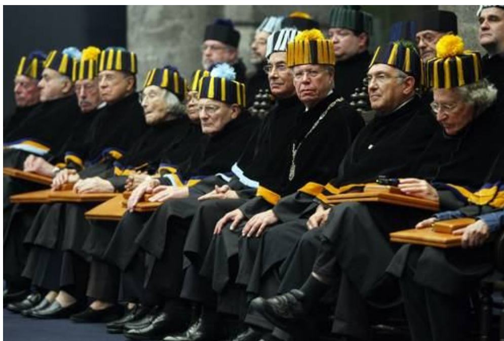
Ceremonia Honoris Causa.

A este acto añadimos los símbolos académicos que representaban antaño los atributos de Doctor y que hoy no se usan excepto para este acto y ya tenemos el desarrollo del Acto. Esta ceremonia fue la que llamó más la atención en los festejos del centenario de la universidad, y el traje académico tan fastuoso, los pendones adornando el salón, y a su vez enaltecendo los colores propios de la escuela, fueron 16 los pensadores a los que se les honro al otorgarles este grado, algunos doctorados pertenecen no sólo a la academia sino al mundo político, me gusta como en esta ceremonia es proyectada la presencia de la UNAM y el protocolo que fue esencial para que se llevara a cabo.