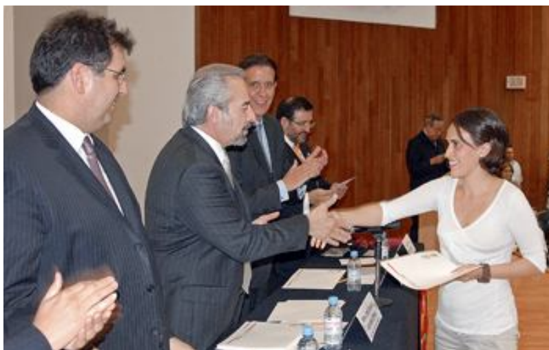
Entrega de medalla Gabino Barreda a sus mejores estudiantes.

máxima casa de estudios, pero también con la sociedad, y es que deben ser los portadores y defensores de todos los valores que la UNAM ha cuidado, la recepción de entrega de medallas, son ceremonias que se realizan de manera solemne, estos actos aportan al protocolo universitario motivación que permiten la visualización de un enfoque del protocolo y que al existir estas ceremonias no solo se practica el protocolo, también son manifestaciones vivas de enseñanza y aprendizaje que permiten conservar las costumbres, la cultura y la tradición.