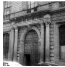
Academia de San Carlos