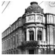
Palacio de la Autonomía