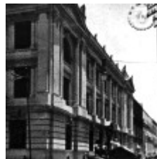
Escuela de Jurisprudencia