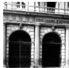
Palacio de Minería