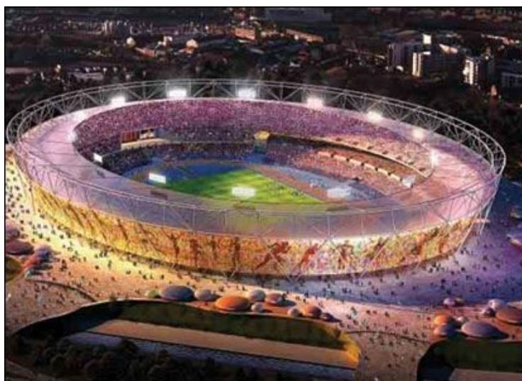
En la imagen, recreación del estadio olímpico londinense.