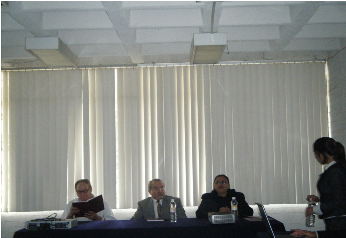
Ejemplo de Examen Profesional, en esta imagen se aprecia a los Miembros del jurado y a la sustentante.

Otros actos de carácter interno en la FES Aragón en donde se aplica el protocolo.