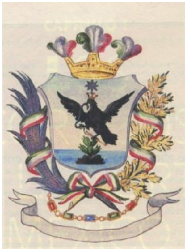
Escudo Nacional Mexicano 1822