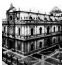
Antigo Templo de San Agustín