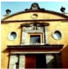
Templo de San Pedro y San Pablo