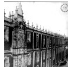
Antigo Colegio de San Idelfonso