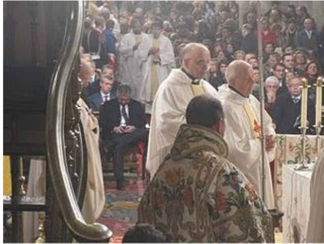
El Ministro de Fomento, llama la atención por su actitud en un acto litúrgico en la catedral de Santiago.