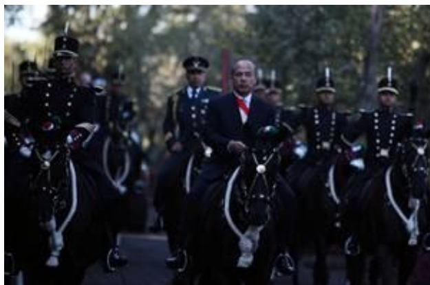
CABALGATA. La Marcha de la Lealtad es recordada cada año por el presidente en turno

El 9 de febrero del año en curso se llevó a cabo la Marcha de la Lealtad, el Presidente Calderón montó una yegua desde el Castillo de Chapultepec hasta el pie del cerro como una forma de evocar la escena en que Francisco I. Madero recorrió el Paseo de la Reforma hace 98 años. La madrugada del 9 de febrero de 1913 inició el movimiento contra Francisco I. Madero, pero fue contenido, y el entonces mandatario cabalgó en un caballo hasta Palacio Nacional a través del Paseo de la Reforma. Este hecho ha pasado a la historia como La Marcha de la Lealtad y es conmemorada todos los años por el presidente en turno. 120