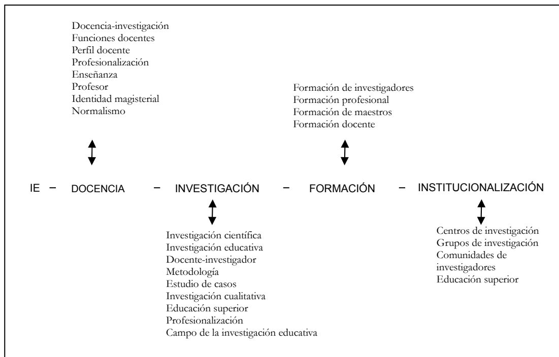
Ilustración 3: Diferimiento de sentidos