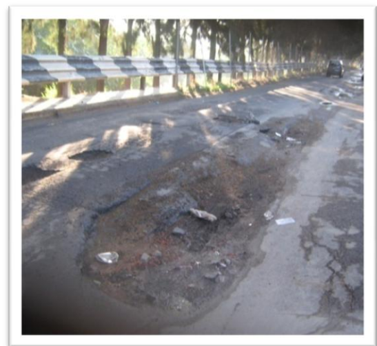
(Fig. 3.3) RECORRIDO PREVIO DE RUTA.