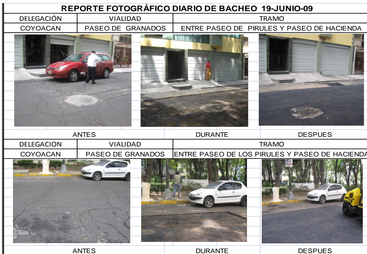
(Fig. 4.5) REGISTRO GENERAL EJEMPLIFICADO DEL REPORTE FOTOGRÁFICO.