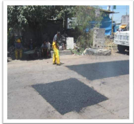
(Fig. 3.3.9) RELLENO DE ASFALTO 2ª CAPA 5 CMS.