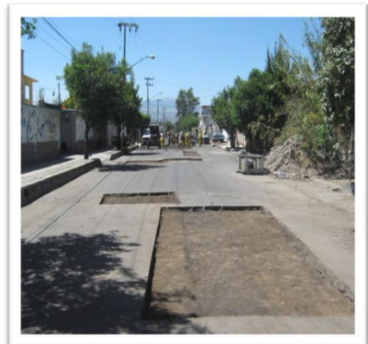
(Fig. 3.3.7) PERFILADO Y LIMPIEZA DE LA CAJA.