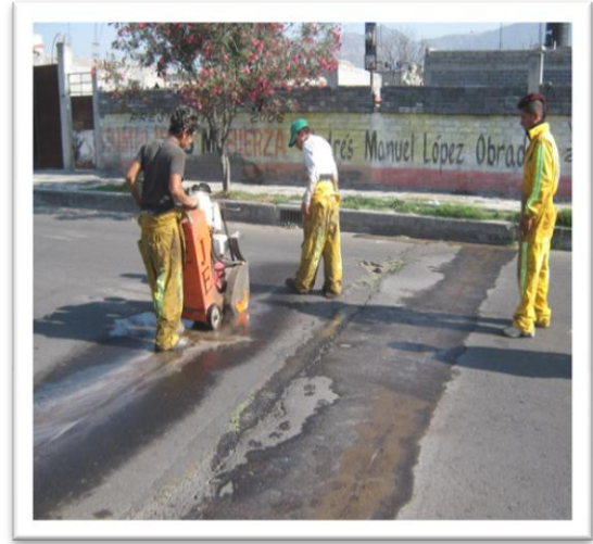
(Fig. 3.3.4) CORTE CON SIERRA MECÁNICA.