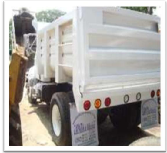
(Fig. 2) VOLTEO-RABÓN 7 m 3 (15 TON).

Según la demanda se utilizan tracto camiones también conocidos como tórtón mostrados en la fig. 3.