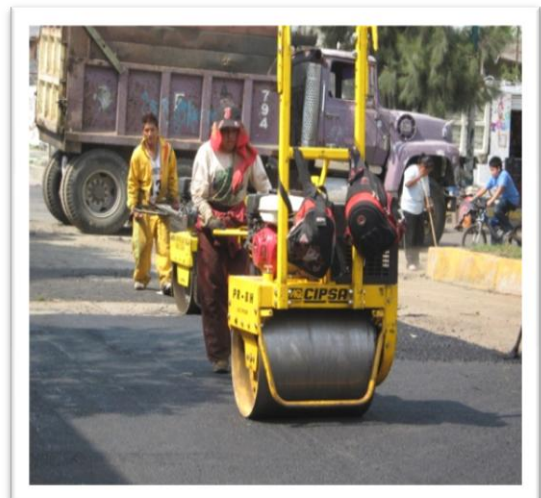
(Fig. 3.3.10) COMPACTACIÓN CON RODILLO VIBRATORIO MANUAL.