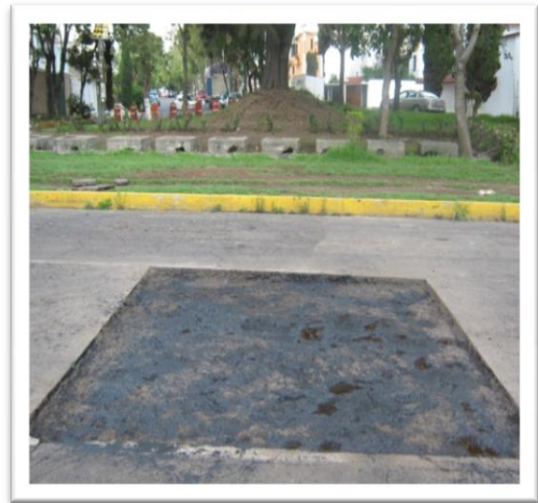
(Fig. 3.3.8) RIEGO DE LIGA A RAZÓN DE 1 LITRO POR M 2 .