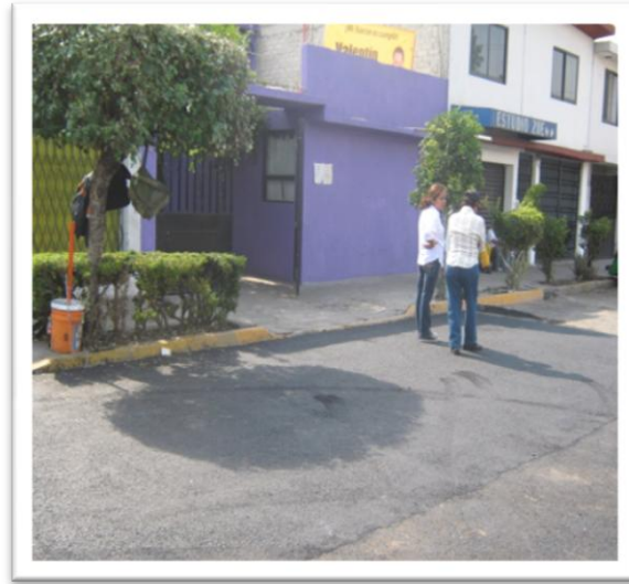
(Fig. 3.3.11) NIVELACIÓN DE BACHEO CON CARPETA EXISTENTE.

Se tomarán las debidas precauciones tratando de dejar el trabajo al nivel del pavimento existente tal como se muestra en la fig. 3.3.11.