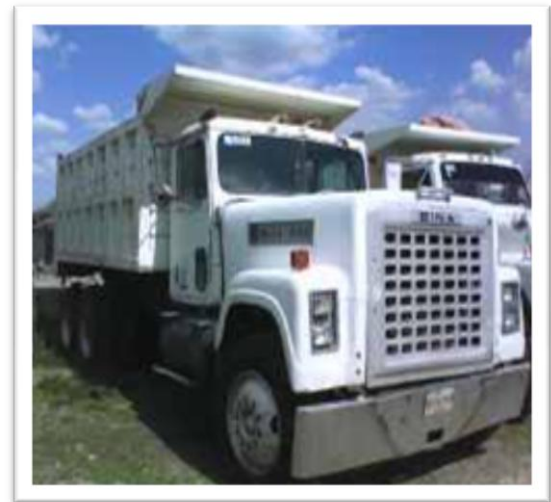
(Fig.3) TRACTO CAMIONES –TÓRTON 15 m 3 (30 TON).

A su vez también pueden ser transportados en dimensiones más grandes como son en tracto camiones de 30 m 3 de 5 o o 6 o Rueda, mejor conocidos como góndolas estándares o automáticas como se ve en la fig.4: