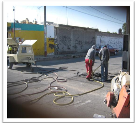
(Fig. 3.3.5) DEMOLICIÓN CON COMPRESOR NEUMÁTICO.