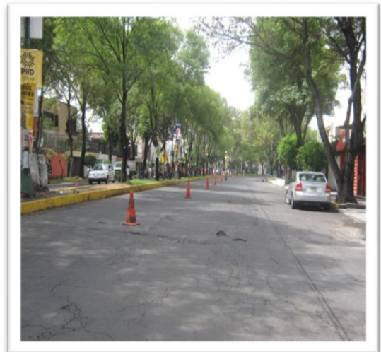
(Fig. 3.3.2) SEÑALIZACIÓN CON CONOS Y TRAFITAMBOS.