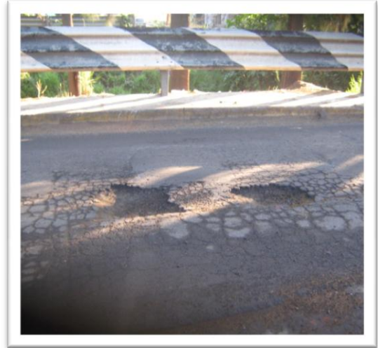
(Fig. 3.3.1) UBICACIÓN DEL BACHE.