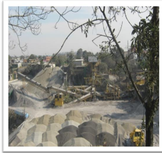
(Fig. 1) PLANTA DE ASFALTO.

intermedia, un ejemplo claro sobre los agregados del asfalto se observa en la fig. 1 correspondientes a la Planta de Asfalto de Distrito Federal.