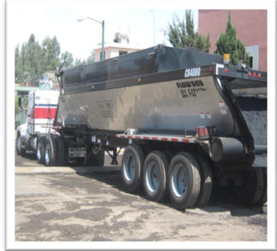
(Fig. 4) TRACTO CAMIONES-GÓNDOLAS ESTÁNDARES O AUTOMÁTICAS 30 m 3 (50 TON).

Según el volumen necesario, se colocan en la máquina pavimentadora (finisheer) para que esta la deposite sobre la vía con un espesor uniforme o bien sobre la caja en dado caso de ser bache, después de lo cual se compacta mediante rodillos (planchas de cierto número de tambor) mientras la temperatura se conserva alta para un mejor manejo.