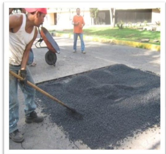
(Fig. 3.3.9) RELLENO DE ASFALTO 1 a CAPA 5 CMS.