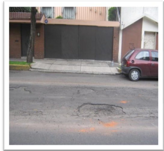
(Fig. 3.3.3) TRAZO PARA REPARACIÓN.