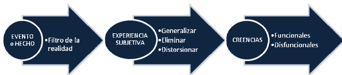
Figura 2. Proceso de formación de las creencias

CREENCIAS LIMITANTES: Son las que impiden, anulan y bloquean las capacidades, por lo que operan impidiendo con toda fuerza la realización de cualquier capacidad generativa de acciones útiles por falta de esperanza, capacidad, motivación, por expectativas catastróficas o problemas de identidad que puedan ser determinantes para no activar las capacidades.