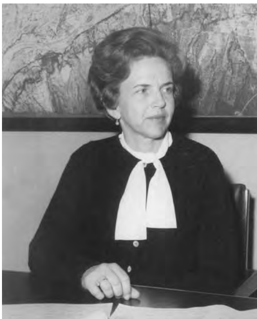
Norma Villarreal de Zambrano. Primera alcaldesa de oposición. San Pedro Garza García en 1967.