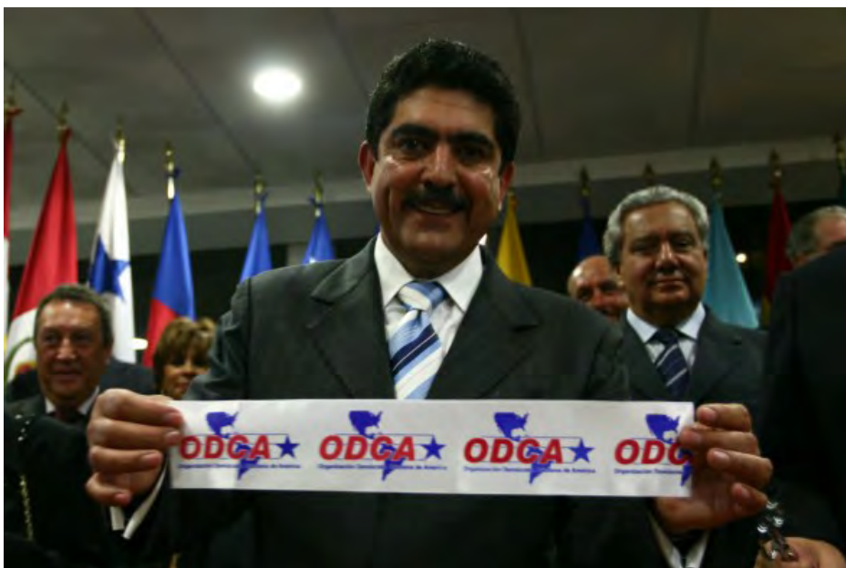
En el 2006 Manuel Espino, entonces Presidente Nacional del PAN, ganó la presidencia de la Organización Demócrata Cristiana de América (ODCA).