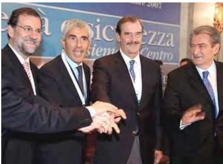
Octubre del 2007. Vicente Fox, primer presidente panista, ungido como co-presidente de la Internacional Demócrata Cristiana.