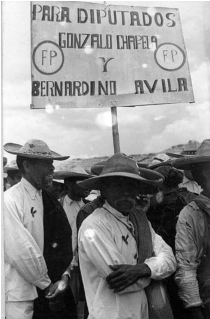
Contingentes del Partido Fuerza Popular de la Unión Nacional Sinarquista apoyando a diputados de unidad durante la campaña presidencial de Don Efraín González Luna. Mayo de 1952.