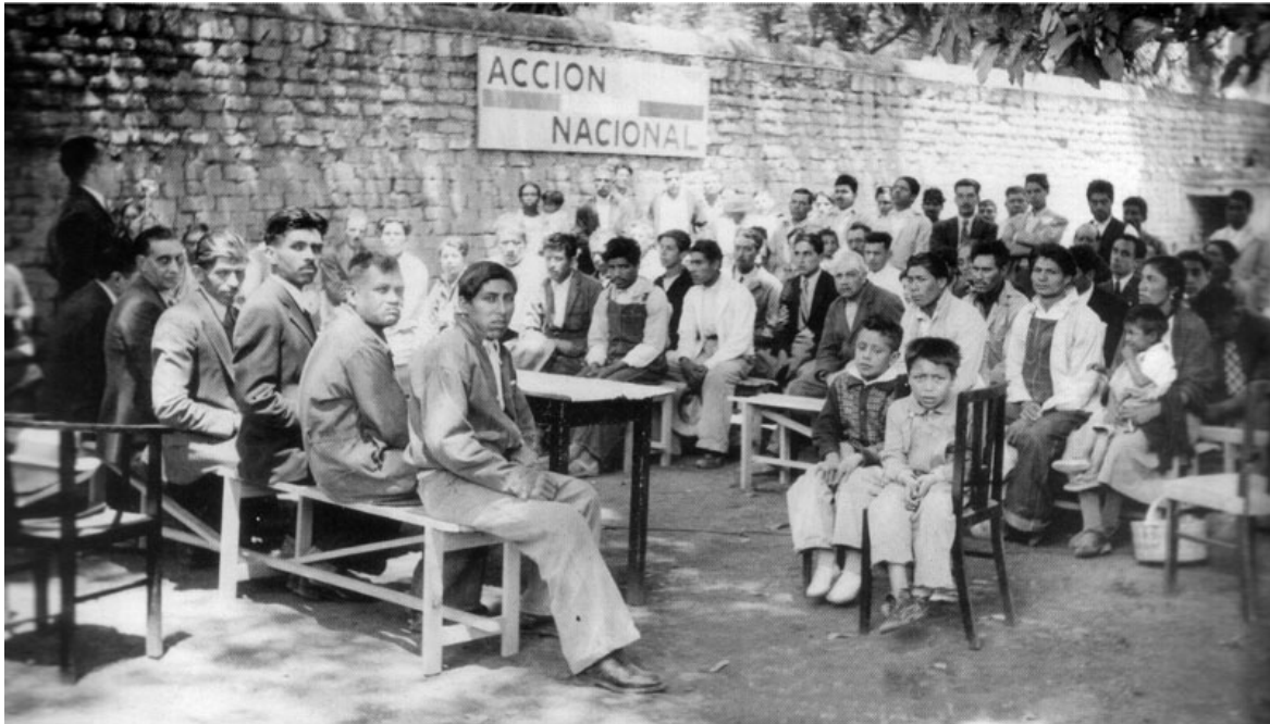
Primera asamblea panista en Tlalpan, DF. Enero de 1940.