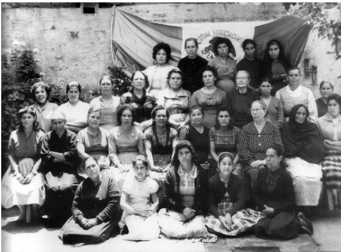
Presencia femenina en el partido. Foto sin fecha del archivo Fundación Rafael Preciado A.C.