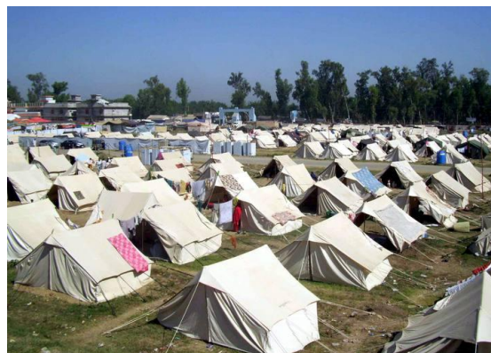
Campo de refugiados de Mardan en Pakistán