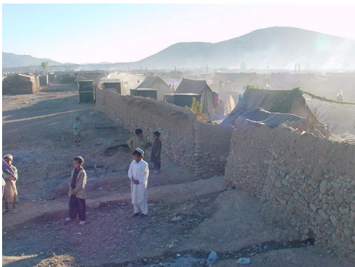
Campo de Refugiados afganos (Asgharo)