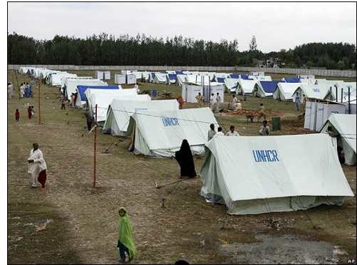
Campo de refugiados de Kacha Garhi