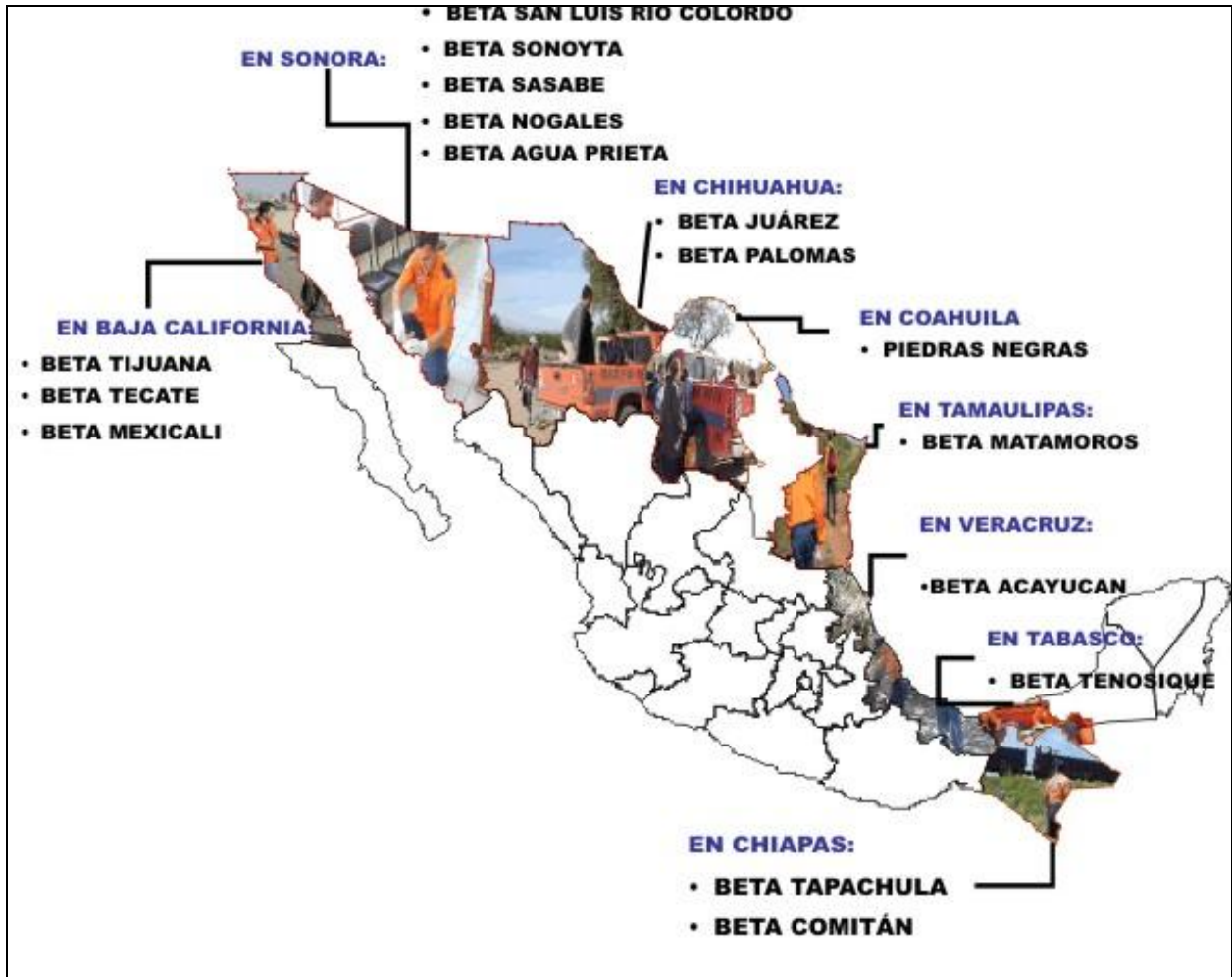
Mapa 3. Grupo Beta de Protección a migrantes (localización).