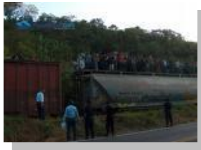
El tren 41

Un importante grupo de los transmigrantes centroamericanos tienen un bajo nivel de estudios, por ello es que en los Estados Unidos son empleados en los servicios, la construcción y las actividades agrícolas; con menor salario y largas jornadas de trabajo. Lo mismo ocurre con los migrantes de nacionalidad ecuatoriana, brasileña y peruana que laboran en los países europeos 42 .