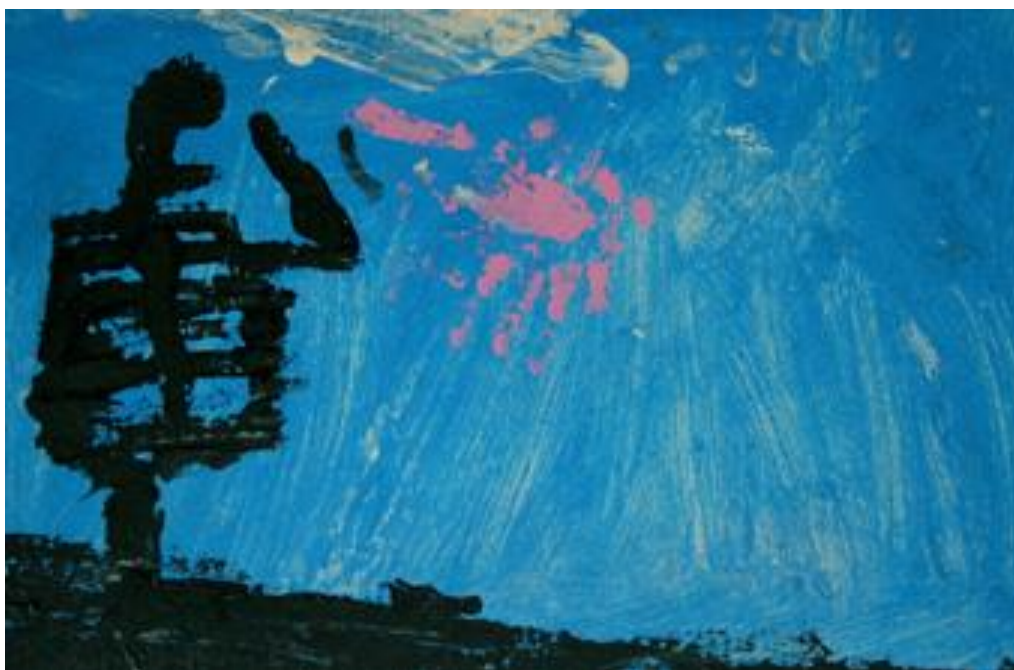
Pintura realizada por un niño de cinco años muestra la reinterpretación de “La Gran Galaxia” de Rufino Tamayo. Se observa la sensibilidad del niño al lograr un acercamiento plástico a la obra de este artista.

modelado necesitan de cierta coordinación entre mano, ojo y cerebro para poder llevarse a cabo, expresión plástica donde aprenderán a decir lo que piensan, definir lo que les interesa, lo que sienten por medio de la práctica de las diferentes disciplinas, es un buen momento para acercarlos a obras de arte y comentar en grupo lo que piensan al observar esos objetos desarrollando su sentido de la observación, haciendo lazos que les permitan familiarizarse con estos objetos, distinguir una pintura de una fotografía, tener y utilizar en su lenguaje cotidiano palabras como obra de arte, artista, dibujo, museo, por medio de experiencias escolares que contribuyan a este tipo de conceptos donde será necesario tener una idea sencilla que se complejizará con el tiempo.