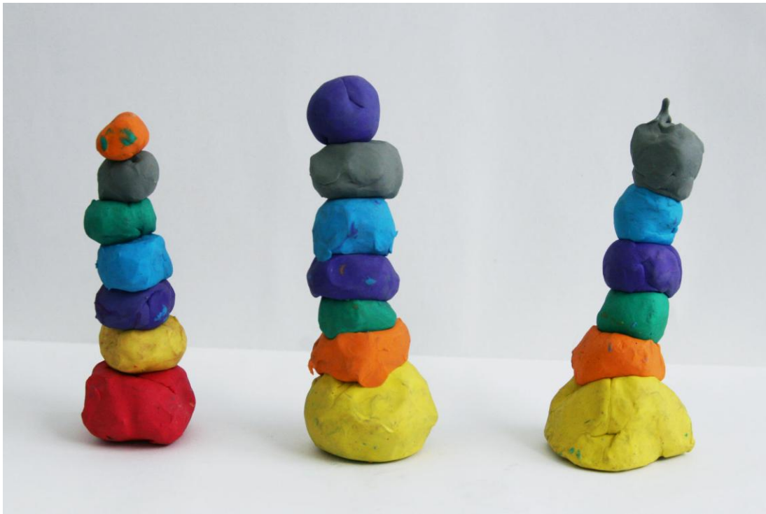
Ejercicio de equilibrio en la escultura. Realizado por niños de cinco años con plastilina de colores.

las Artes Plásticas que proporciona la oportunidad para incrementar la capacidad de acción, la experiencia, la redefinición y la estabilidad en el individuo, es un buen comienzo en preescolar para familiarizarse con la más alta expresión humana que ha sido hasta entonces.