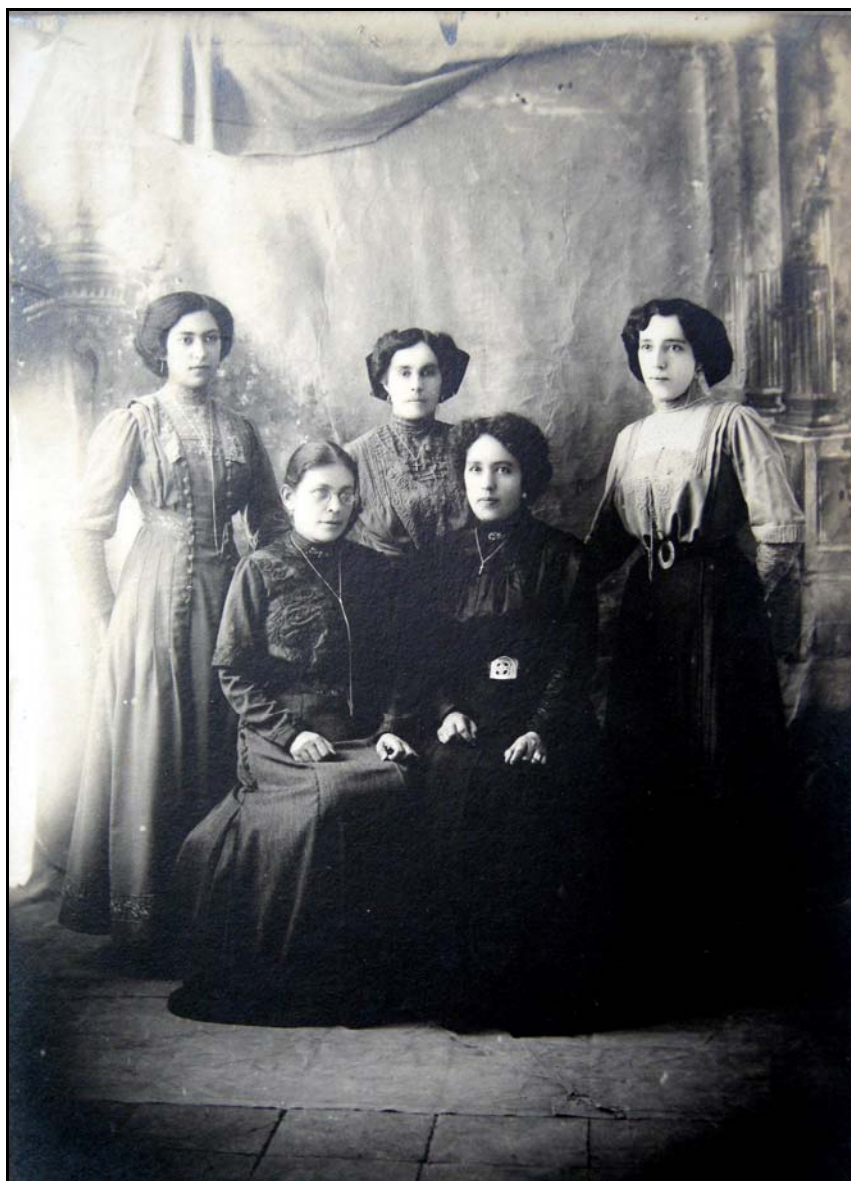
III. Las hermanas del Villar y amigas, ca.1906, Autor Desconocido