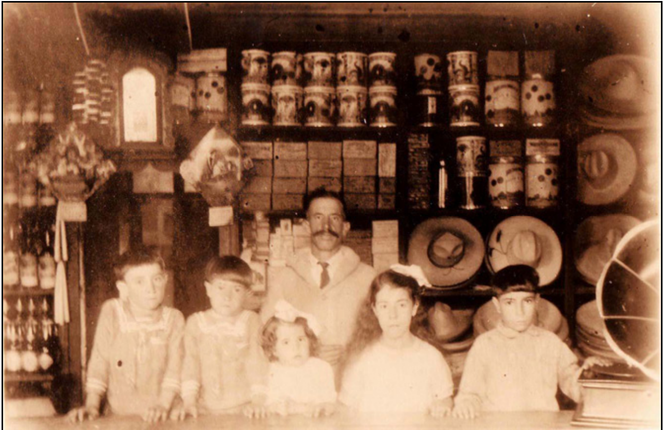
XXV. Tendero y familia, ca. 1926, IGB

atención a las botellas (lado izquierdo), podemos observar que estas no son unas simples botellas de licor o alcohol, pues vienen con una buena presentación, etiquetadas y selladas, lo que habla de modernidad; otro elemento que refiere a modernidad lo representa el gramófono (lado derecho), en los poblados de provincia no era muy usual tener este tipo de aparato en una tienda. Parte de la construcción en esta fotografía fue mostrar como su sociedad se encontraba inmersa ya en un proceso de modernidad, pues aquí la familia aparece flanqueada por íconos de esta.