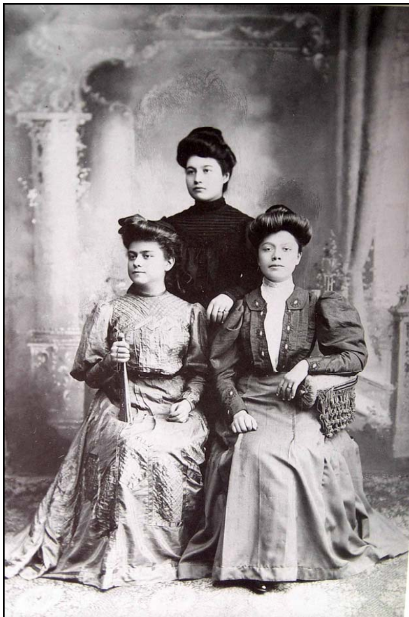
II. Sin título, ca. finales del siglo XIX, Romualdo García

construcción de caminos y puentes, de transportes, parte de sus tradiciones y festividades. Con ciertos elementos naturales se convertían en icónicas de la vida cultural, religiosa, social, política y económica de las regiones; éstas también repetían modelos de fotografías hechas en la capital.