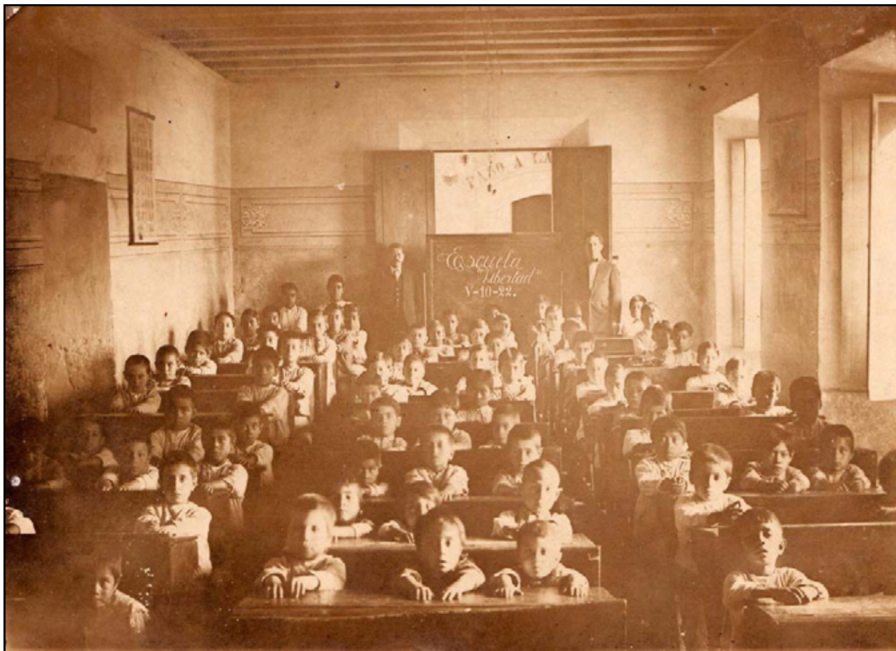
XXVIII. Escuela Libertad, 1922, IGB

poses tanto de alumnos como profesores, el cuidado en la luz y composición, etc.) para cumplir con los deseos de sus clientes –directivos de la escuela- de evidenciar en el reporte que se hacía a la recién Secretaría de Educación Pública (SEP), el orden y buenas condiciones que tenían los alumnos en las escuelas particulares y cómo estas compartían rasgos de modernidad con otras escuelas en la República Mexicana.