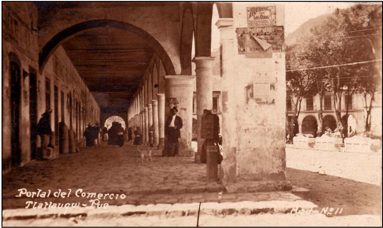
XXI. Portal del Comercio, ca. 1919, Atribuïda a MF