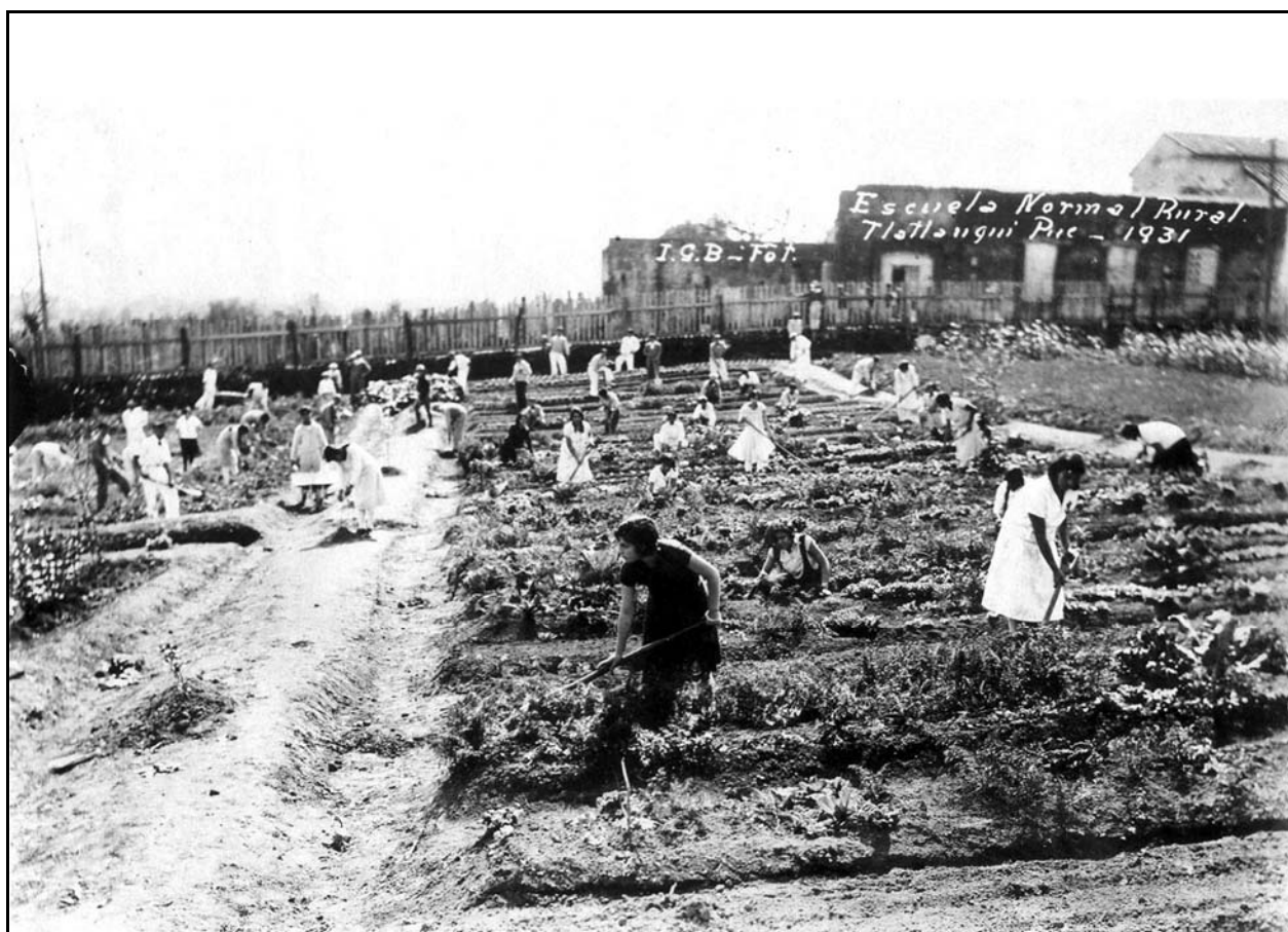
XXIX. Normal Rural, 1931