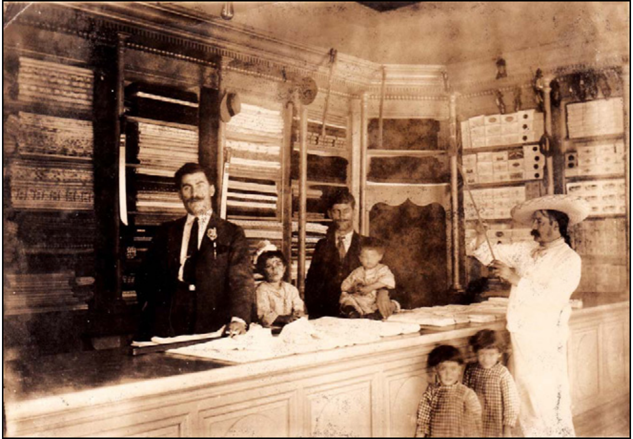
XXIII. Interior de La Nueva Siria, ca. 1924, IGB