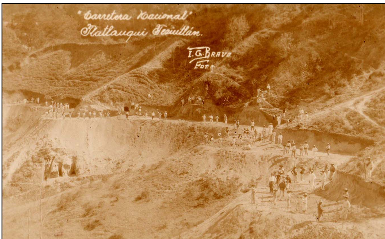
VIII. Carretera Nacional Tlatlauqui Teziutlán, ca. 1941

En relación a Gilberto, puede apreciarse que tenía mayor preferencia por las panorámicas y paisajes –tanto naturales como arquitectónicos-, en donde mostraba referentes de la vegetación y geografía serrana, los diferentes parajes del municipio, varias vistas que podían tenerse de Tlatlauqui en las cuales siempre buscó que al fondo apareciera el emblemático “Cerro Cabezón”, los diferentes edificios, construcciones y sitios importantes en la vida de la población, documentó los cambios físicos que iba teniendo el poblado haciendo muchas veces varias tomas desde el mismo lugar, permitiéndonos con ello observar la evolución que iba sufriendo a través de los años.