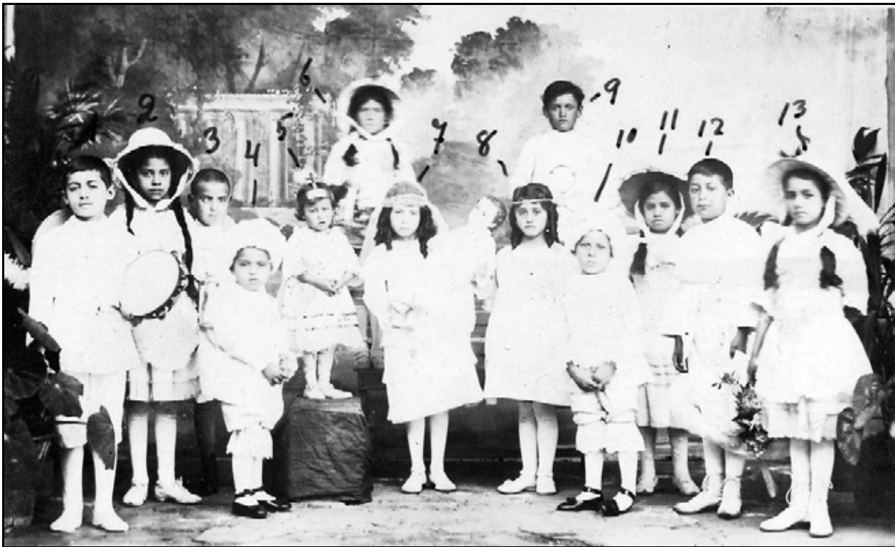
XXXIV. Pajes y Madrinas, ca. 1925, IGB