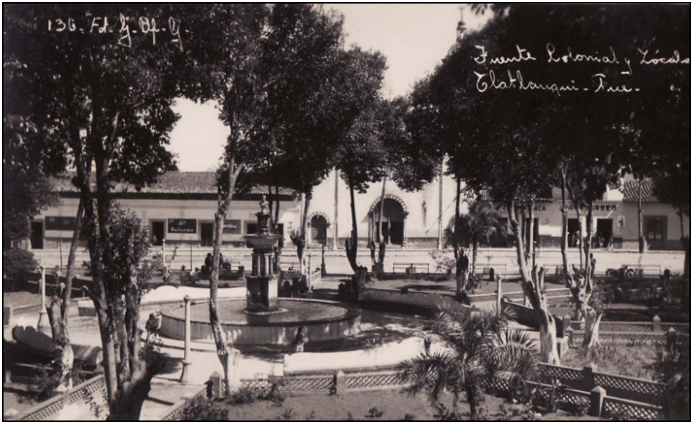
XIX. Fuente Colonial y Zócalo, ca. 1937