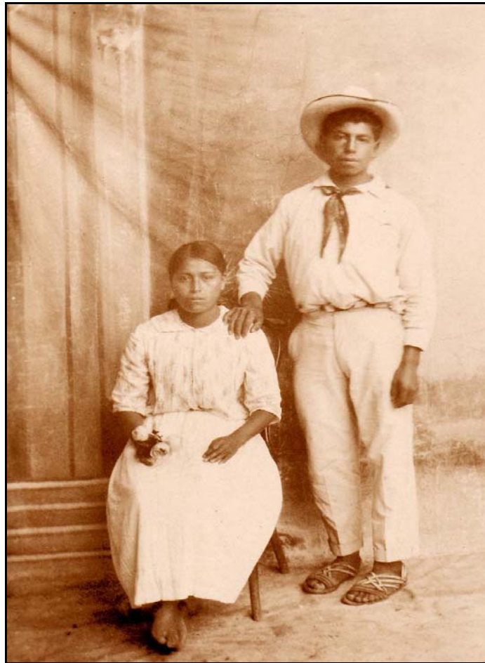
VII. Sin título ca. 1932 IGB