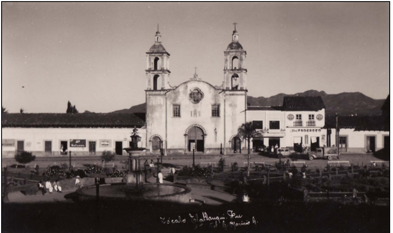
XX. Zócalo Tlatlaucui, ca. 1945