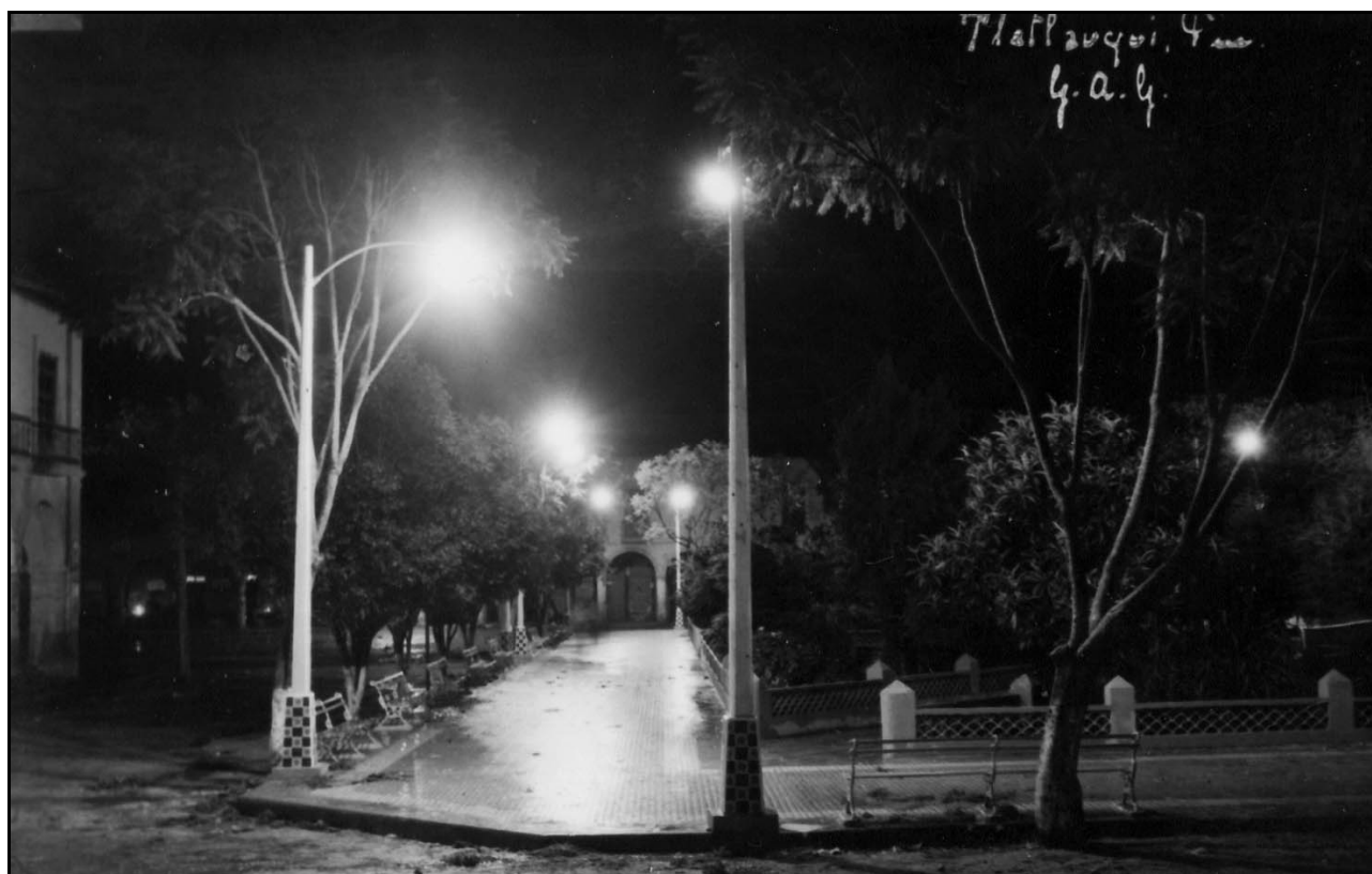
X. Vista nocturna del parque, ca. 1951, GAG

ideales políticos y oficiales a los cuales tanto él como Ismael pertenecieron, donde a partir de una mirada individual fueron creando imaginarios de modernidad y modernización en sus retratos, que fueron compartidos, validados y difundidos por ciertas esferas del poder en la sociedad de Tlatlauqui, convirtiéndolas así en parte del imaginario colectivo de los Tlatlauquenses.