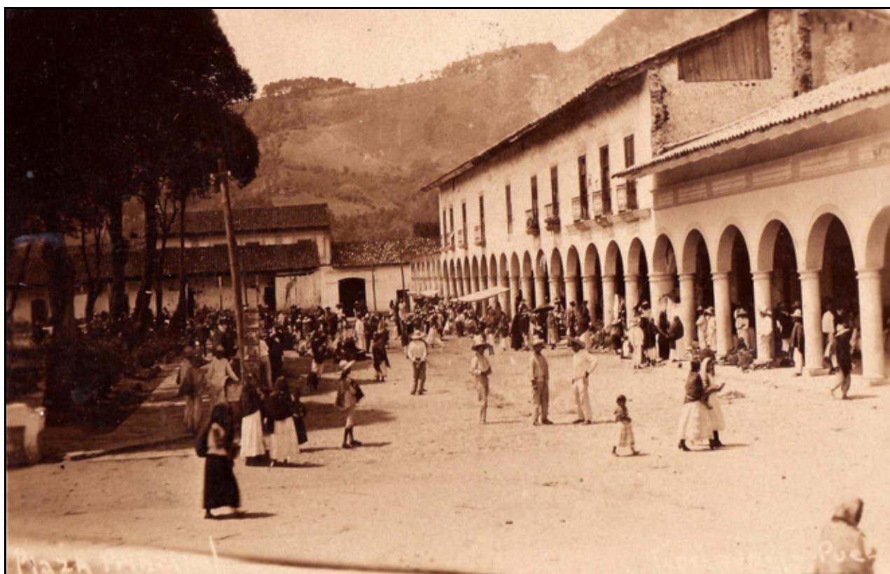
XXVI. Plaza Principal, ca. 1919, Atribuïda a MF.

hablaban español, pero no por ello la relación entre éstos dejaba de ser afectuosa y humana; o apreciar cómo se realizaba el trueque. [...]Los jueves, días de tianguis subían centenares de indios de los pueblos de tierra caliente. De los ranchos y poblados de los cuatro puntos cardinales, concurrían vendedores y compradores aportando rica variedad de productos. La plaza central se llenaba de toda clase de vecinos, de calzón y camisa albeante de blanco, con huaraches y sombrero de palma[...]. 42