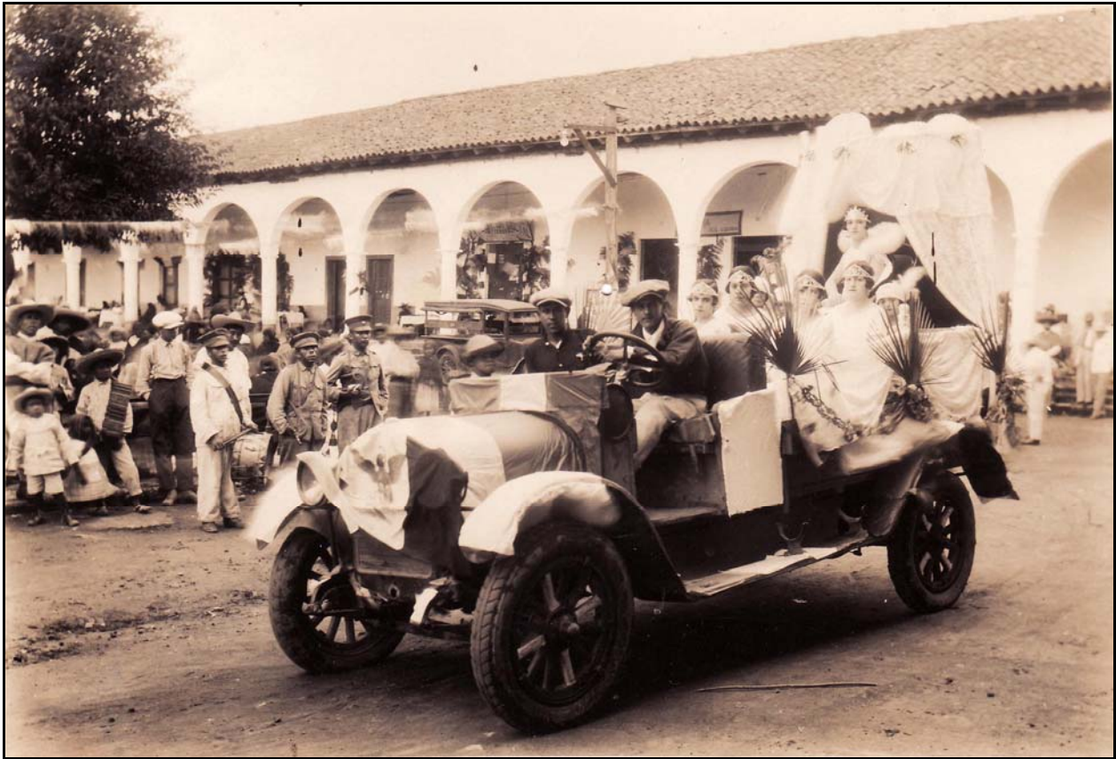
XXXIII. Desfile de septiembre, ca. 1931, IGB