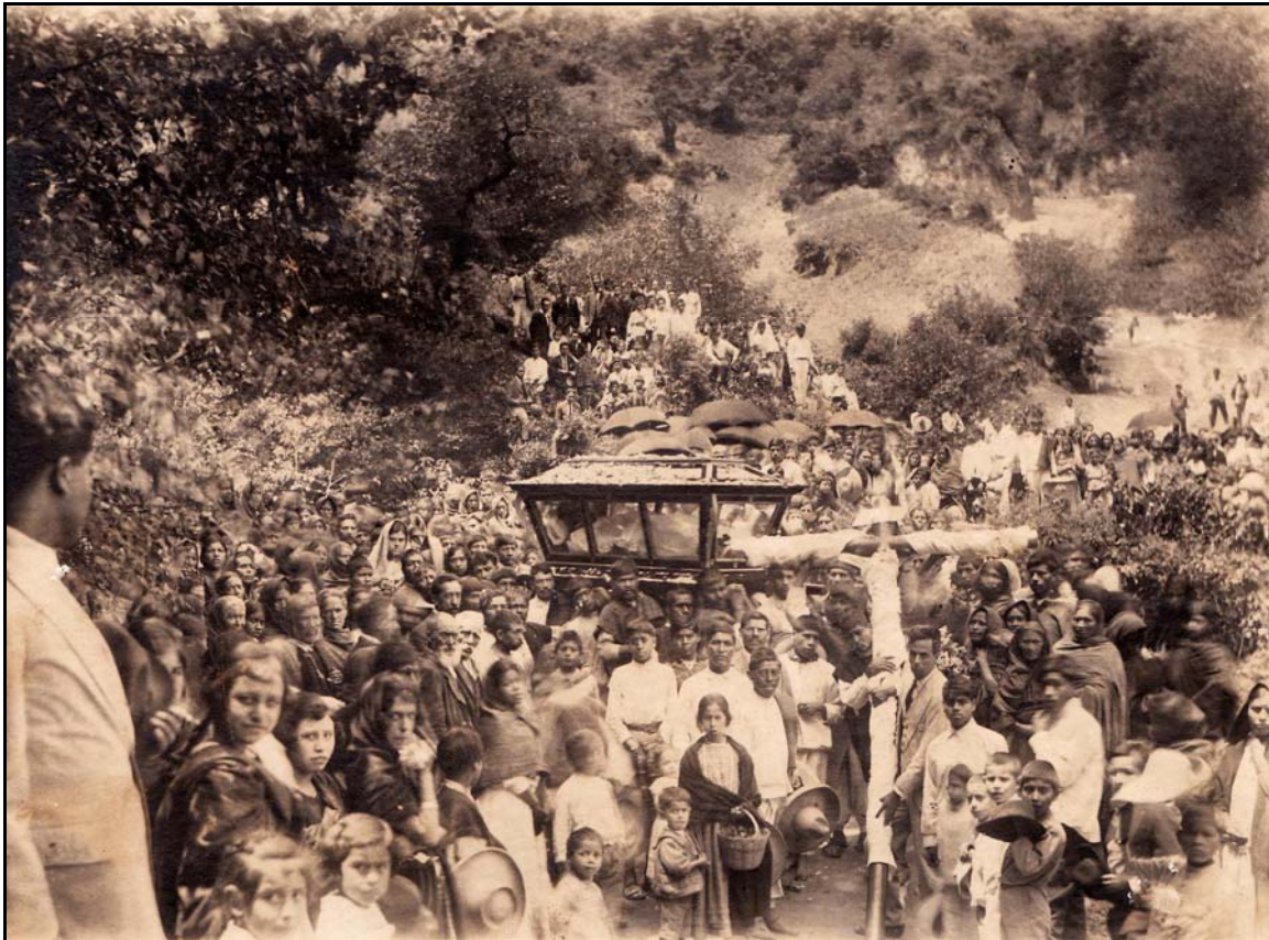
XXXII. Procesión de Semana Santa, ca. 1934, Atribuïda a GAG

En el mes de septiembre, se realizaban dos eventos muy importantes para la Villa (que hasta en la actualidad siguen efectuándose), los festejos patrios donde coronan a su reina y desfilaban con ella, y el tradicional baile de septiembre. Para ello, aproximadamente en junio se invitaba a ciertos miembros de la sociedad para que formarían parte de la Junta Patriótica, quienes se harían cargo de realizar estas fiestas. Una vez creada ésta, se convocaba a otras personas para que eligieran, tanto a las candidatas a reinas, como a sus comités. Con esto listo, comenzaba entonces su campaña, la cual consistía en recabar votos (cambiar un voto por dinero) en todo el municipio, organizando para ello bailes, rifas y otros eventos para recaudar dinero. El 12 de septiembre se contaba el monto reunido de cada una de las aspirantes y se nombraba a la ganadora, para que el día 15 fuera coronada. Terminada la coronación, en los altos de Palacio se hacía un pequeño brindis en honor a la reina. Al día siguiente junto con otros pobladores e integrantes de los gremios participaban en el desfile, para ello se decoraban los automóviles y camiones que funcionaban como carros alegóricos. En la noche de ese día se celebraban dos bailes, el popular en los bajos del Palacio para la gente de las comunidades y barrios aledaños –donde tocaban los siete menudos–,