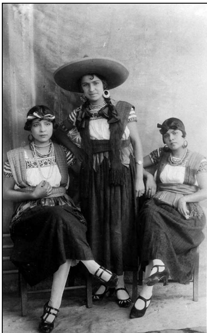
XXXV. Tres hermosas Chinas Poblanas, ca. 1934, IGB

individual se convierte en una mirada colectiva no solo de la localidad sino de la nación entera. Es así, como miradas de fotógrafos regionales (que son micro) al reproducir aspectos que son fácilmente compartidos y entendidos en otras entidades complementan una mirada de carácter nacional, sobre todo en cuanto a los procesos de modernización y progreso. [...]En ese mundo rico y pródigo de acontecimientos, los pueblos serranos crecieron, maduraron, se desarrollaron y la sociedad entera progresó, reforzó su individualidad dentro de la evolución general del país[...]. 59