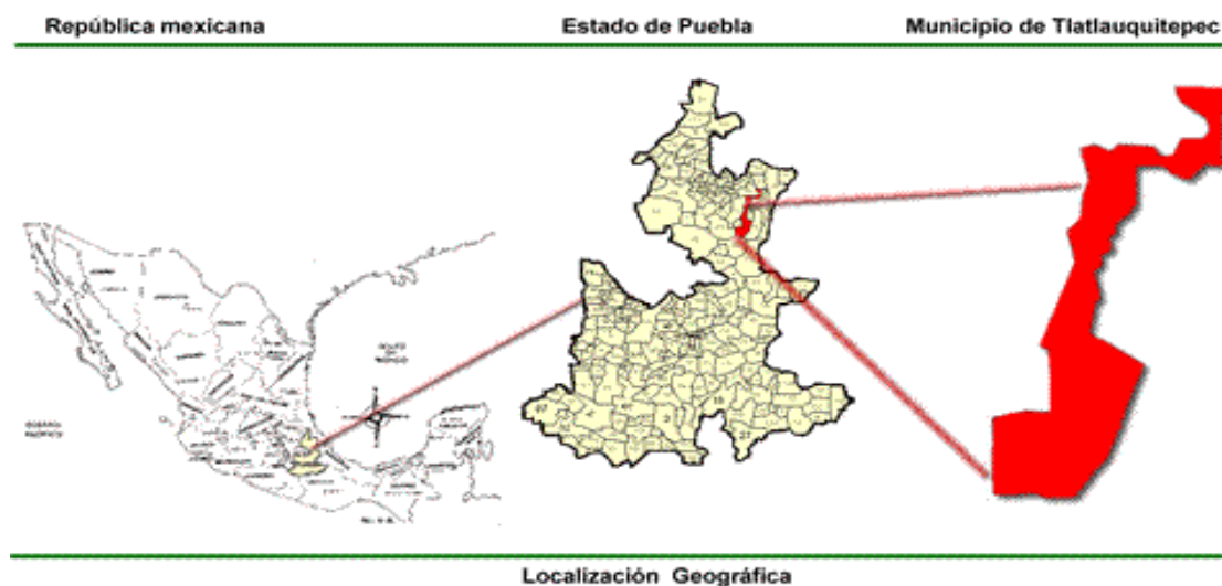
XII. Mapa de ubicación del Estado de Puebla y del Municipio de Tlatlauquitepec dentro de la República Mexicana

Enclavado en la sierra nororiental del Estado de Puebla se encuentra el municipio de Tlatlauquitepec, con una altitud variante de entre 900 a 3000msnm y a 141km de la ciudad de Puebla, en los paralelos 19° 36'24'' y 20° 03'18'' latitud Norte y los meridianos 97° 14'42'' y 97° 28' 06'' de longitud occidental. El clima templado-húmedo con lluvias en verano 4 predomina sobre la mayor parte de su territorio, limita al norte con Cuetzalan del Progreso, al Este con Chignautla, Atempan, Teteles de Ávila Castillo y Yaonahuac, al Sur con Cuyoaco y al Oeste con Zautla, Zaragoza y Zacapoaxtla.