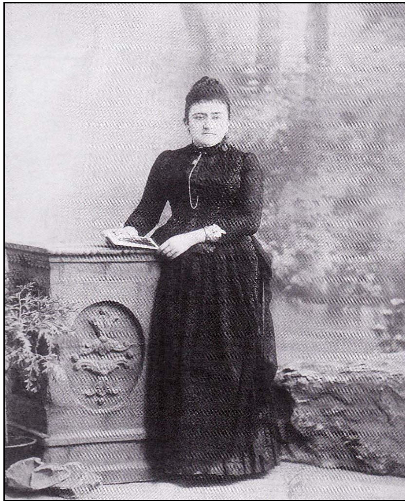
I. Sin título, ca.1885, Hermanos Valletto

muestra la precariedad de algunos estudios fotográficos-), así como prestar poco cuidado a la iluminación que en este caso es en cenit lateral, cuidando con ello la luminosidad de los rostros pero descuidando el lado izquierdo del telón ya que la imagen resultó quemada en esa parte. Los limitantes económicos y de conocimiento pudieron en ciertas ocasiones provocar la existencia de este tipo de fotografías.