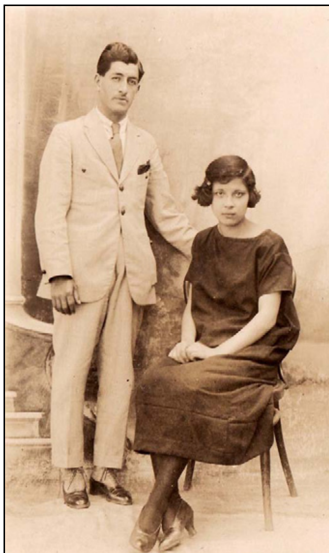
XXXVI. Dama y Caballero, ca. 1932, IGB

Los episodios relevantes para la historia e investigación regional: eventos políticos, transformaciones físicas, inclusión de tecnología, festividades, etc., requieren de un