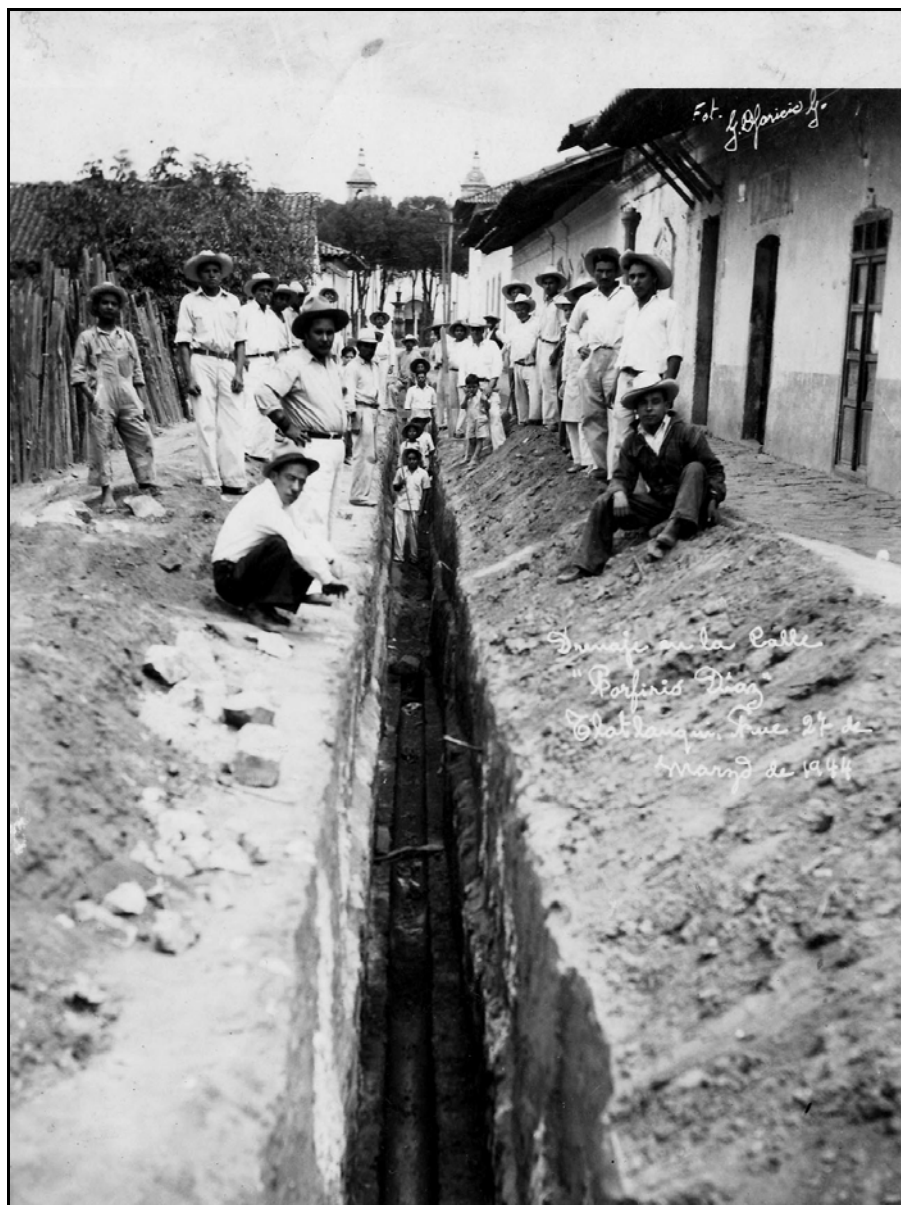
XVI. Drenaje en la Calle Porfirio Díaz, 1944

sociedad, esto debido a que la Tesorería se había quedado ya sin fondos, 24 para lo cual se recurrió al mismo tipo de discurso oficialista del que se ha mencionado anteriormente para convencer a los ciudadanos de cooperar económicamente con esta obra [...] acudo a los buenos hijos del pueblo que quieren su progreso, para que con su valiosa cooperación se pueda solventar este gasto, el que oportunamente se comprobará para mejor satisfacción de los interesados [...]. 25 Finalmente se lograría terminar dicha construcción el 7 de enero de 1951.