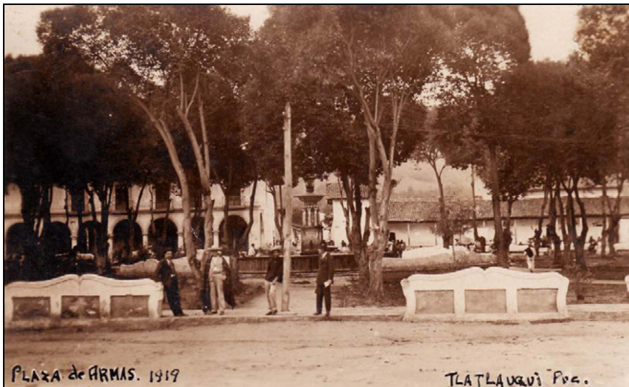
XVIII. Plaza de Armas, 1919

en sus extremos se hallaban la mayor parte de los negocios importantes de la población. En esta misma imagen al fondo del lado izquierdo, se observan los arcos del Palacio Municipal, recinto del poder político y al otro extremo una construcción perteneciente también a éste, pero que era rentado por particulares, donde se encontraban un tendajón con expendio de bebidas alcohólicas, y pulquerías, entre otros más. Durante las dos primeras décadas del siglo XX, Tlatlauqui aún no se encontraba inmiscuido en estos procesos de modernización como nos los deja ver ésta imagen, un lugar aún muy pueblerino.