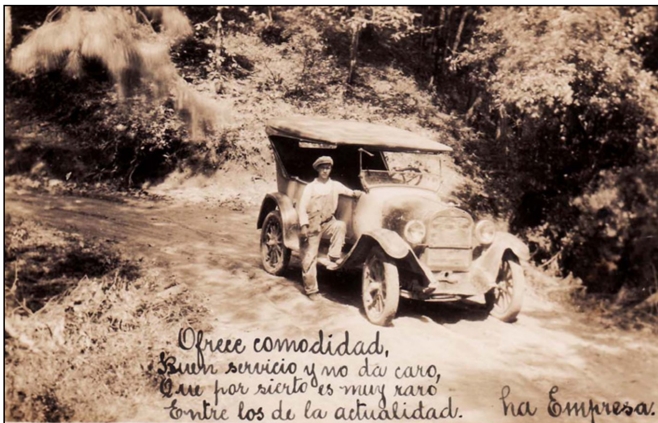
XIV Sin título, ca. 1926, Atribuída a IGB

los sujetos se colocaran en esta curva, donde el camino comienza a ensancharse, implica una indicación al espectador de un avance, un progreso que ha llegado a su encuentro (la rama de pino que se deja ver colgando del lado superior izquierdo, permite tener esa noción de realidad, de estar ahí y de haberse encontrado con este progreso representado por los sujetos), donde nuevamente se observa un ícono de la modernidad –auto- logrando con ello tener una fotografía de modernidad contextualizada. Con respecto al individuo que forma parte de la imagen, se observa que porta el uniforme común de chofer que se usaba en la época, el cual consistía en un overol, camisa de manga larga y una boina; se ve cómodo con la pose que el fotógrafo le indicó, lleva cargando de manera cruzada una bolsa al parecer de piel y con su mano derecha sujeta un cigarrillo; se sabe fotografiado así que procura seguir las indicaciones del fotógrafo para no verse rígido sino natural e incluso con cierta galantería en la postura. El uso que tuvo esta imagen fue como un medio publicitario de La empresa (en tamaño postal) pero además, de manera particular el joven chofer puede emplearla también como un recuerdo particular de su juventud y de esta etapa laboral, de esta manera podía obsequiarla a alguna persona de su estimación (familia, amigos, novia o esposa).