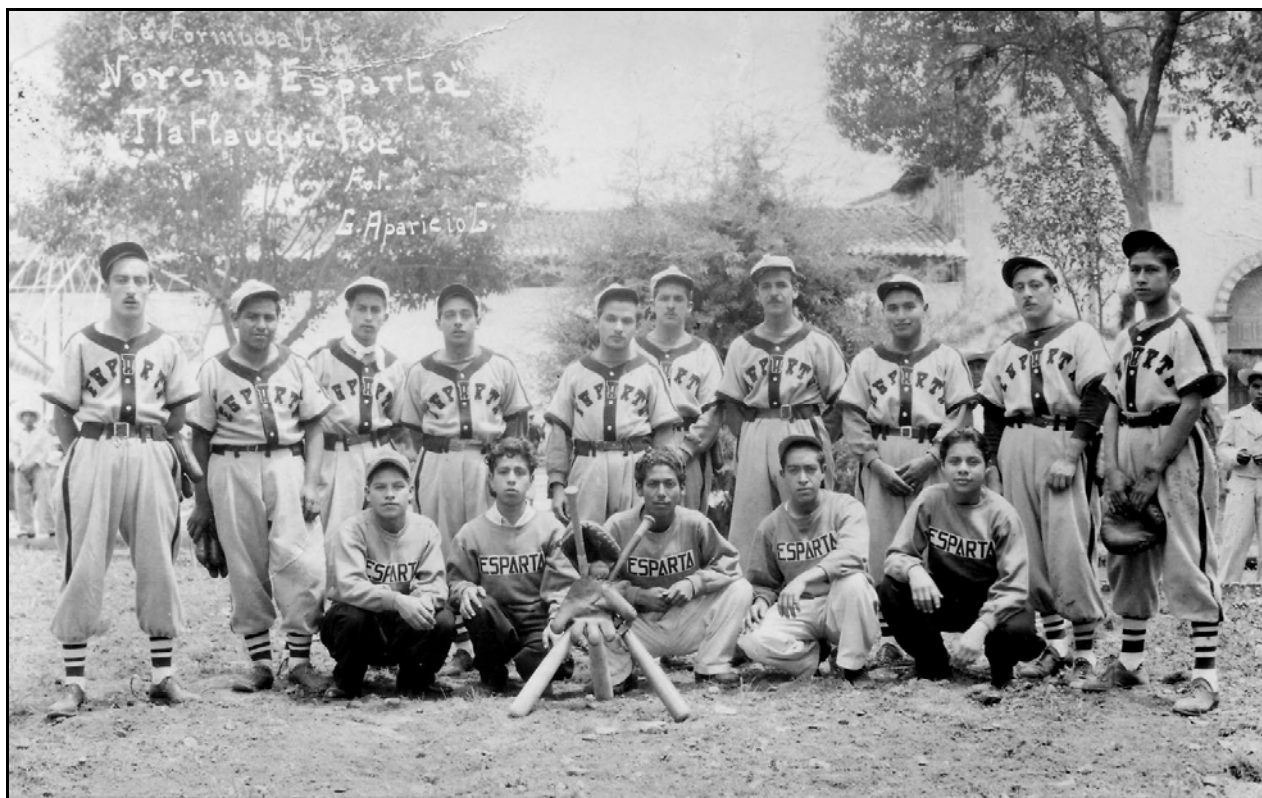
XXXI. La formada Noreña Esparta, ca.1940

usado en ese tiempo por equipos amateurs no solo de nuestro país sino de otros países, demostrando con ello que en Tlatlauqui conocían la moda deportiva predominante de la época, al igual que el tipo de pose que debían de tener para este tipo de retratos (aunque no todos tienen una uniformidad en su pose). En esta imagen podemos observar que los que permanecen de pie portan su uniforme compuesto por camiseta bordada por el frente con la leyenda ESPARTA (7 llevan debajo de la camiseta una sudadera), pantalón fajado, calcetines con rayas negras horizontales, casquillo, sus zapatos y por supuesto su guante (hay un integrante que lleva puesto en su cuello una mascasda probablemente era el pitcher y la usaba para diferenciarse de los demás); los 5 restantes están en cunclillas portando una sudadera que lleva también boradada la leyenda ESPARTA, un pantalón de vestir (2 con pantalón claro y tres en oscuro), zapatos común y corrientes y solo dos de ellos llevan puesto su casquillo. Por si se llega a tener duda de que es un equipo de béisbol, se compone una figura enfrente de todos formada por tres bates que se unen gracias a dos guantes.