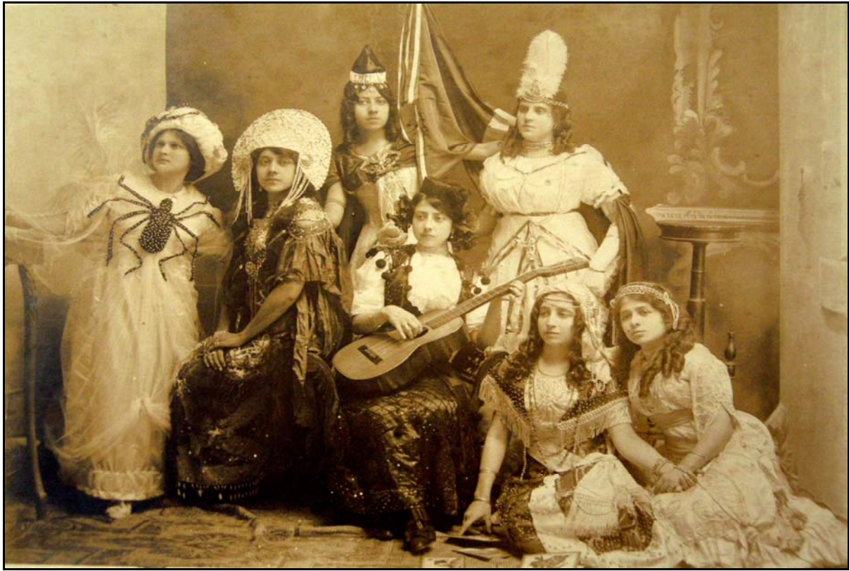
VI. Sin título, ca. 1925 Atribuïda a IGB