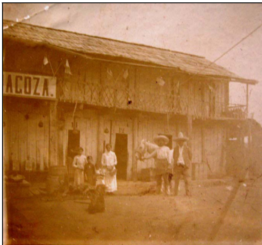
XIII. Posada de Zaragoza, ca. 1917 – 1920, Autor Desconocido

concurrir en febrero a la ciudad de México para la peregrinación al Santuario de Guadalupe (asignada esa fecha por la diócesis poblana; para ir a surtirse de mercancías, por asuntos políticos, a visitar amistades y familia o por de simple paseo,etc.