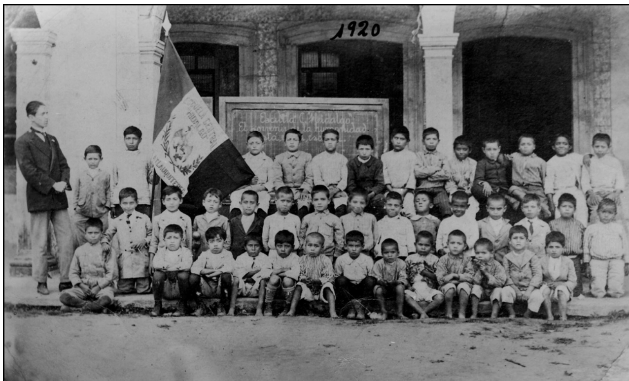
XXVII. Escuela Pública para Niños Central Hidalgo, 1920, IGB

Mientras esta fotografía nos causa cierta impresión de precariedad enfatizándose mucho el aspecto rural; la imagen XXVIII muestra todo lo contrario, comenzando porque la fotografía se lleva a cabo en un salón aquí predomina el orden, organización y buenas condiciones de las aulas, sobre todo como lugares espaciosos e iluminados que permitían una correcta enseñanza, retomadas de propuestas de arquitectura funcionalista de Le Corbusier con respecto a la circulación del aire y luz (elementos que formaban parte de la modernidad en las escuelas). Aquí el grupo es mayor que el anterior con 71 alumnos, es también multigrado por la diferencia de edades entre los niños, los pupilos aparecen sentados en sus pupitres (compartiendo el mismo con uno o dos compañeros más), también están conscientes de ser fotografiados, solo que ellos no se ríen, están sentados muy propios y con gestos muy serios; a comparación de la otra imagen se ve mayor uniformidad en cuanto la clase social de los niños –por su vestimenta, la cual es también diferente entre los profesores de ambas imágenes), este tipo de retrato muestra la diferencia que existía en aquellos años entre las escuelas públicas y las privadas, donde estas últimas aventajaban en cuanto a espacios y enseñanza a las públicas (más cercanas a las escuelas modernas eran las privadas). Para esta fotografía, se aprecia que Ismael si planeó más como tomarla (se puede apreciar esto en la uniformidad de las