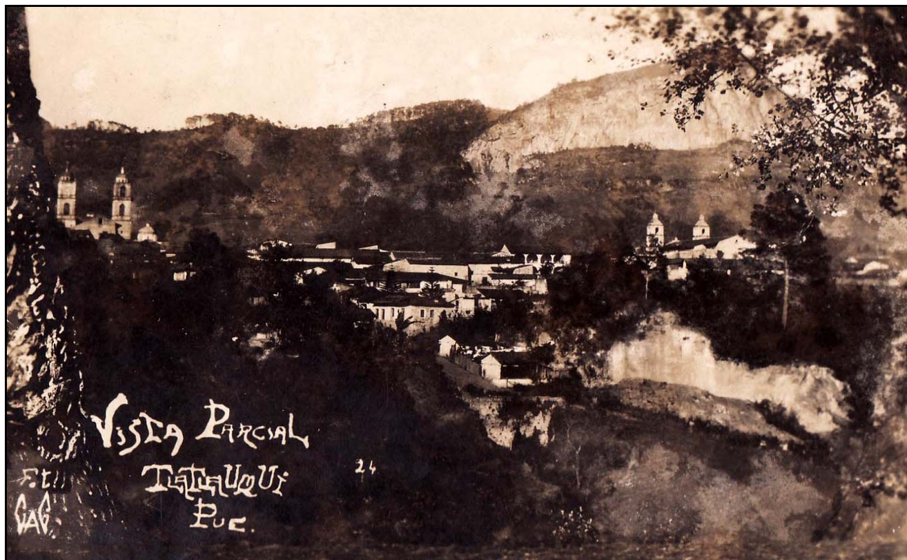
IX. Vista Parcial de Tlatlauqui, ca. 1930, Gilberto Aparicio Guerrero (Fot. GAG)

tipo de vistas y/o paisajes realizadas en diferentes ciudades de nuestro país por Charles B. Waite o A. Briquet por mencionar algunos fotógrafos extranjeros que llevaron a cabo este tipo de registros en formato de tarjeta postal que formaron muchas veces parte de álbumes y que seguramente Gilberto conoció y reprodujo a su modo ciertos elementos.