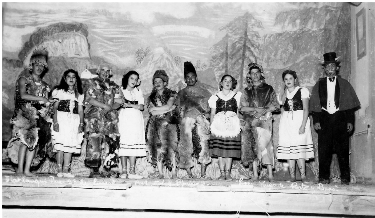
XXX Pastorela "Los hijos de Bato y Bras", 1949, GAG

se empleaba como un registro de este tipo de eventos que se hacían en pro de la Iglesia y como recuerdo para los actores de su participación en estas puestas a escena.