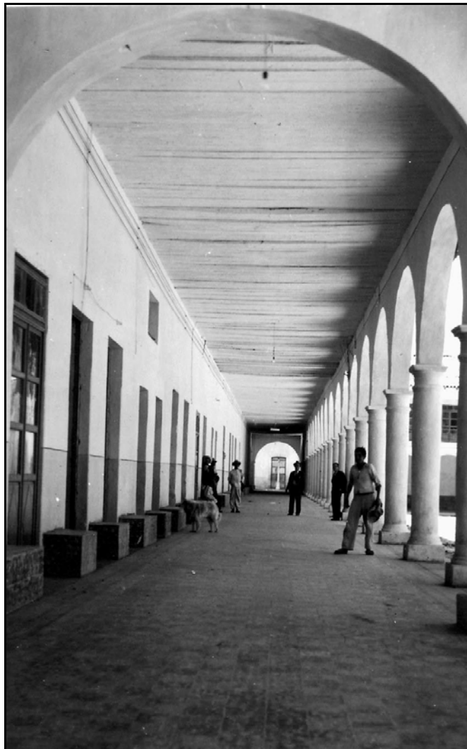
XXII. Portal del Comercio I, ca. 1952, GAG