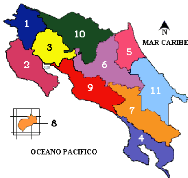
Figura (7).

Para lograr la conservación de las áreas protegidas y los recursos naturales a largo plazo, su conocimiento a través de inventarios y estudios científicos y su valoración por parte de la sociedad, juega un papel fundamental. Existen estudios que proporcionan información tanto básica como aplicada sobre la riqueza biológica del país (qué existe, dónde, para qué sirve, estado de conservación, etc.), elaborados por numerosas instituciones públicas y privadas, así como por ONG.