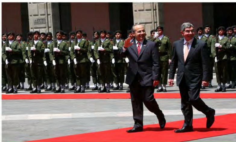
Figura (5).

En este sentido, el encuentro más reciente que se llevo a cabo fue la Visita de Estado a Costa Rica que realizó el presidente de México, Felipe Calderón Hinojosa, del 28 al 30 de julio del presente año; dicho encuentro se hizo con el “objetivo de analizar las relaciones bilaterales e intercambiar impresiones sobre la situación regional e internacional; así como profundizar los vínculos comerciales, abordar temas como la pandemia de la gripe porcina y el medio ambiente”.