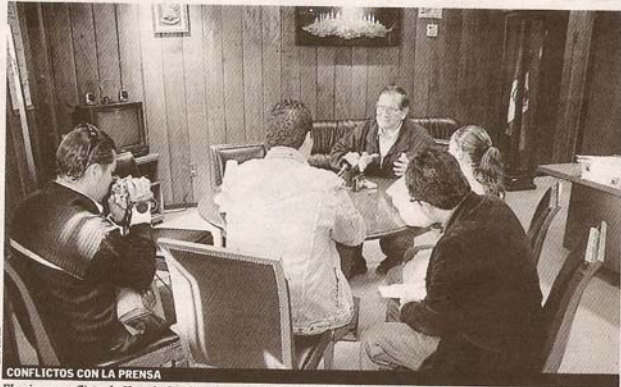
CONFLICTOS CON LA PRENSA

Los militantes panistas afirman que el secretario particular del alcalde guarda en su computadora