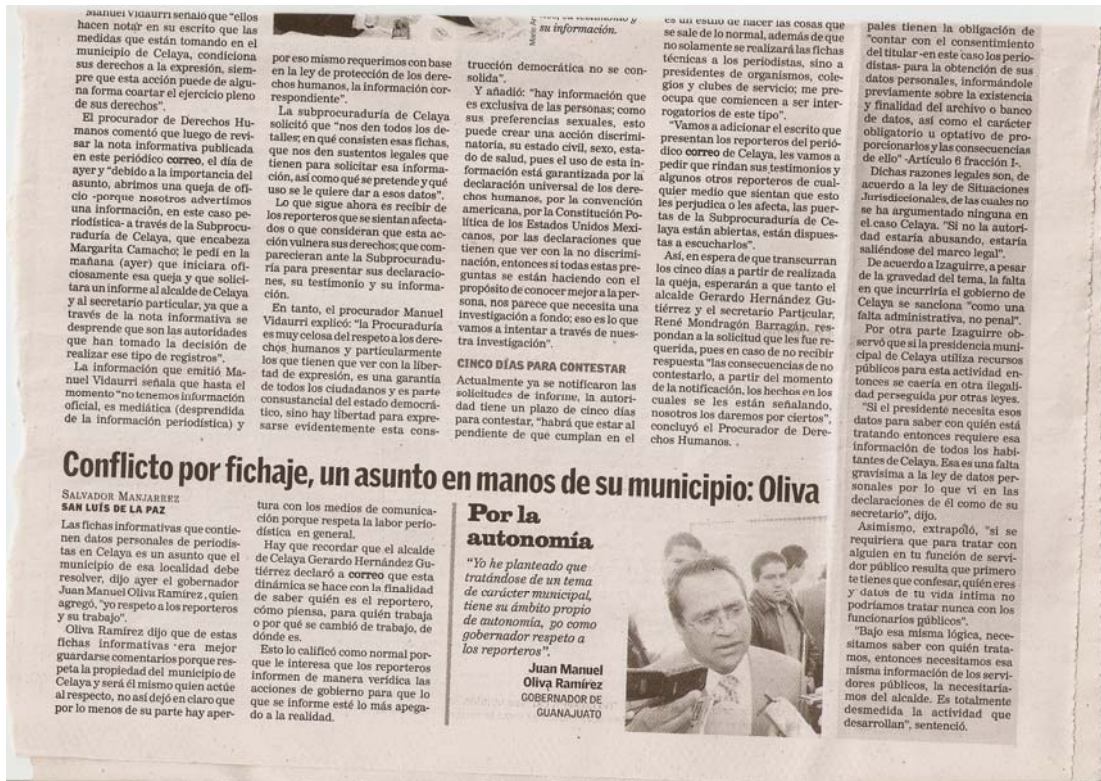
El gobernador, Juan Manuel Oliva Ramírez, prefirió mantenerse ajeno al conflicto mediático y dejó todo en manos del municipio de Celaya.