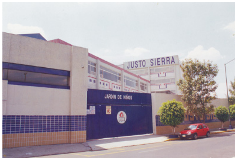
Instalaciones del Jardín de Niños Justo Sierra. Av. Jardín No. 294 colonia del Gas.

En el ciclo 2002-2003 el jardín de niños comienza sus trámites para su incorporación a la Secretaría de Educación Pública lo cual se hace efectivo el 13 de marzo de 2003. Este paso ha sido de gran trascendencia, puesto que fue uno de los primeros planteles a nivel jardín de niños que se incorporó.