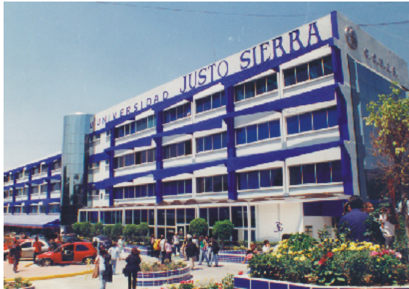
Universidad Justo Sierra, plantel Acueducto. Av. Acueducto No. 914 colonia La Laguna.

La Universidad Justo Sierra, en sus inicios no contaba con toda la infraestructura que ahora posee.