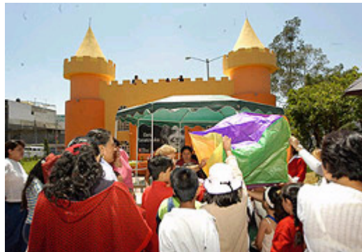
Evento realizado en la librería Elena Poniatowska, en el inmueble conocido como el castillito.

Para fomentar la lectura y ofrecer a los habitantes de Nezahualcóyotl un espacio donde tener contacto directo y cercano con la literatura a costos accesibles; el 12 de mayo de 2005 entró en operación la librería del Fondo de Cultura Económica Elena Poniatowska Amor, ubicada en avenida Chimalhuacán esquina con Clavelero en la colonia Benito Juárez.