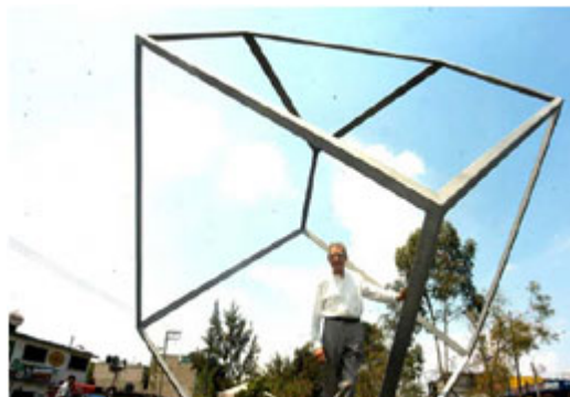
El poliedro. Paseo Escultórico Nezahualcóyotl.

Un poco más adelante está una pieza metálica de 6.8 metros de alto con siete lados, cuya base circular construida con cemento la acerca más a un juego infantil, según palabras de su creador Ricardo Regazzoni, “es una escultura urbana, de ciudad, para que la puedas tocar”. El Poliedro es el espacio perfecto para que los más pequeños jueguen.