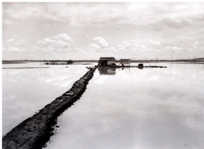
El lago. Aspecto de los primeros asentamientos humanos en los que hoy es el municipio de Nezahualcóyotl.

Los primeros asentamientos humanos en la zona se dieron en los años 40 debido a la importante migración de campesinos provenientes de Oaxaca, Guerrero, Veracruz, Michoacán, Jalisco y Puebla, que llegaba al Distrito Federal en busca de mejores oportunidades de vida y a pesar de que en esa época la capital tenía sólo un millón 500 mil habitantes, las viviendas eran de costo elevado.