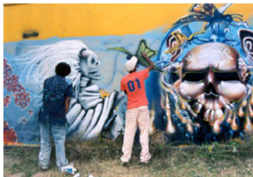
Jóvenes que participan en la Expo Graffiti, en las instalaciones de Ciudad Deportiva.

Desde la administración 2000-2003, el conjunto piramidal ubicado en la Plaza Unión de Fuerzas que alberga las oficinas del gobierno municipal, está decorado con la técnica de graffiti, convirtiéndose así en un espacio más para estos jóvenes creadores, quienes poco a poco han conseguido permiso para pintar en lugares como la estación Peñón Viejo de la Línea A del Sistema de Transporte Colectivo Metro o la Facultad de Estudios Superiores Zaragoza.