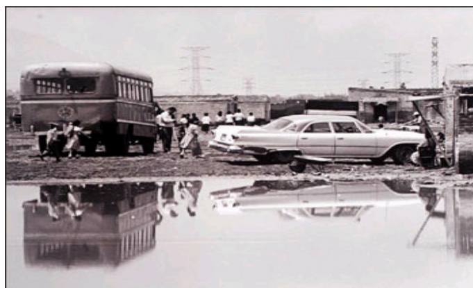
Así fue. Aspecto de las calles de Nezahualcóyotl en los inicios de este municipio.

La intención del presente escrito además de informar las labores de un gobierno, es llamar la atención del lector hacia los cambios que ha sufrido esta importante ciudad en la que se ubica la Facultad de Estudios Superiores Aragón, de la Universidad Nacional Autónoma de México, para lograr este objetivo, el género reportaje era el más adecuado, ya que como lo menciona Carlos Marín en el Manual de Periodismo , “el reportaje amplía, complementa y profundiza la noticia para explicar un problema”, que es justamente lo que busca esta investigación.