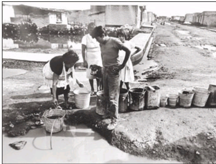
A la cola. Era necesario hacer largas filas para obtener el agua que después tenía que llevarse hasta los domicilios.

mujeres, desde las cuatro de la mañana. Escuelas con aula única, en el mejor de los casos era una casa adaptada, pero las más de las veces un cuarto con paredes endebles y techos improvisados, con botes por pupitres y profesores realmente heroicos, quienes impartían clases entre charcos de agua y remolinos de tierra.