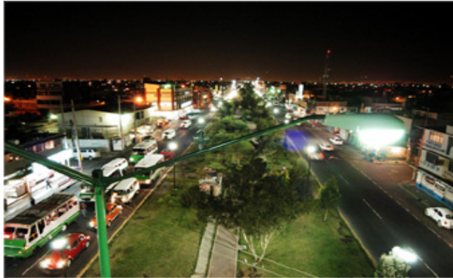
Así es. Avenida J.F. Kennedy, una de las principales del municipio.

Sin duda la administración municipal 2003 -2006 inició el trabajo, pero corresponde a las autoridades siguientes continuar con la labor de acercar las expresiones culturales a los habitantes de Nezahualcóyotl y a éstos aprovechar los espacios creado por el gobierno.