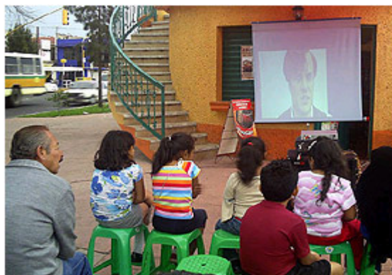
Los kioscos ofrecen actividades diversas.

Paralelamente, se construyeron ocho Puntos de encuentro , llamados kioscos, que por su estructura recuerdan los centros de reunión de los pueblos; de forma circular en la planta baja tienen pequeños negocios en los que las personas con capacidades diferentes o adultos mayores venden postres, dulces, etcétera; en la parte alta, se ofrecen espectáculos artísticos y culturales como pequeñas exposiciones o conciertos.