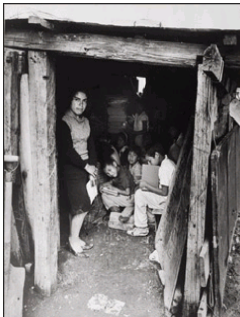
Para estudiar. Las primeras escuelas de Nezahualcóyotl eran construcciones improvisadas.

La encomienda de gobernar el municipio mexiquense más grande de la entidad, precedido por Ecatepec, significó un reto para Luis Sánchez, quien ha vivido en Nezahualcóyotl desde su fundación, cuando “el viento era tan fuerte que incluso levantaba los techos de lámina y la gente iba corriendo para alcanzar sus láminas”. En ese tiempo no imaginó que algún día sería el primer mandatario de este lugar que por calles tenía montes de tierra y en temporada de lluvias se convertían en auténticas arenas movedizas.