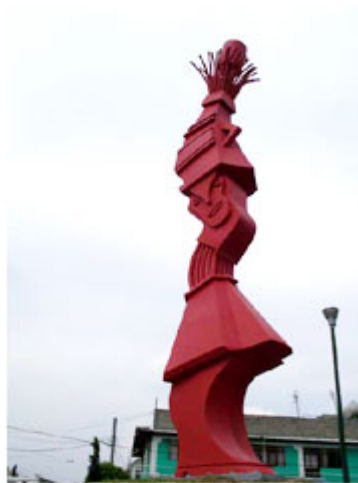
Carmen, de José Luis Cuevas.