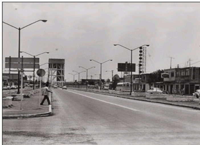
Glorieta del Tinaco, hoy el cruce de las avenidas Adolfo López Mateos y Pantitlán.

El lugar donde se puede ver esta pieza es una referencia histórica en el municipio, en un principio se le conocía como la glorieta del tinaco , porque ahí estaba el único depósito de agua en la zona. El “tinaco” desapareció a finales de los 70 y construyeron en su lugar el Cine Lago, por lo que su nombre cambió a glorieta del Cine Lago , porque albergaba una sala cinematográfica con este nombre.