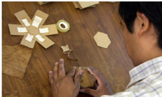
Curso de cartonería en el CEMUAA.

entrar a la universidad”, lo que comenzó como un pasatiempo, ahora se ha convertido en una fuente de ingresos: “mi mamá puso en la sala de la casa un cuadro que hice en el curso y a mi tía le gustó, así que me pidió que le hiciera uno y me pagó el material y un poquito más, luego me pidió otro para una amiga suya que ya me dio más dinero y así poco a poco y ahora pues ya los vendo y hago cosas más grandes. Hice mi examen para la Universidad Autónoma Metropolitana y me inscribí en diseño, yo creo que puedo combinar lo que me enseñen en la escuela con la técnica que aprendí en el CEMUAA”.