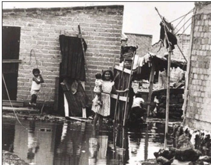
Entre agua, lodo y miseria. Las viviendas en Nezahualcóyotl.

La historia de Nezahualcóyotl, es la de una gran familia que día a día ha trabajado para mejorar su vida. Contaremos pues, algunas de estas vidas, en la que este municipio ha sido protagonista.