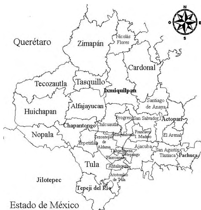
Mapa 2. Área de influencia de Ixmiquilpan y la cultura otomí, de acuerdo con la actual división geográfico-administrativa, basado en INEGI. Marco Geoestadístico Municipal 2005. cuentame.inegi.gob.mx y Otomíes del valle del Mezquital de Beatriz Moreno Alcántara, María Gabriela Garret Ríos y Ulises Julio Fierro Alonso. México, Comisión Nacional para el Desarrollo de los Pueblos Indígenas, México, 2006.

en los que se ha trabajado por más de un año para realizar el Catálogo de Protocolos de Ixmiquilpan del siglo XVII, que abarca sólo uno de los más de cuatro siglos sobre los que da fe esta sección documental.